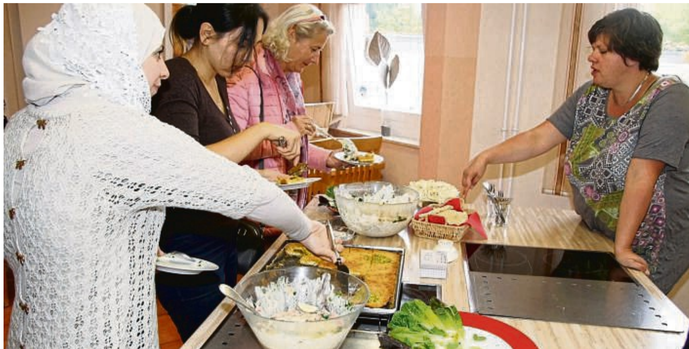
Gehört zur interkulturellen Woche dazu: Um andere Kulturen kennenzulernen, sollte man sich wie hier beim orientalischen Frühstück auch mit anderen Speisen auseinandersetzen.

Flohmarkt Tiefgarage der UNI-KS Kassel-Brückenhof 1., 2. + 3. Oktober Tel.: 0172 / 288 31 56 Heinrich-Plett-Str. 40, Kassel www.flohmarkt-kassel.de