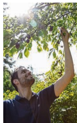
In geringen Mengen dürfen Früchte von wild wachsenden Bäumen geerntet werden.

Wer gar nicht erst in Verdacht geraten will, mutwillig zu stehlen, sollte vor dem nächsten Herbstspaziergang also erst einmal abklären, bei welchen Bäumen und Sträuchern man sich bedienen darf.