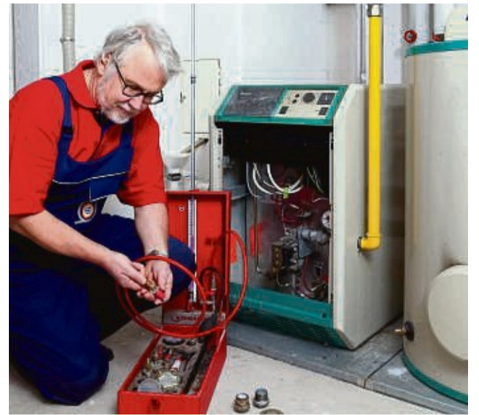
Hintergrund eines Checks ist die Optimierung. Das Energieeinsparpotential steht hier im Mittelpunkt.

Möglichkeiten zur Dämmung der Gebäudehülle, dem Austausch von Fenstern und Türen, dem Einsatz von Solarenergie, aktuelle Fördermittel oder den barrierefreien Umbau werden dort ebenfalls behandelt. „Und natürlich auch die Heiztechnik betrachtet“, so Schülbe. Ein Heizungs-Check vor Ort könne aber nur durch einen Fachbetrieb vorgenommen werden. „Damit kann der Ist-Zustand erhoben werden, der Heizungsinstallateur kann meist durch wenige Handgriffe das Einsparpotential der Heizungsanlage schon erhöhen“, so Schülbe.