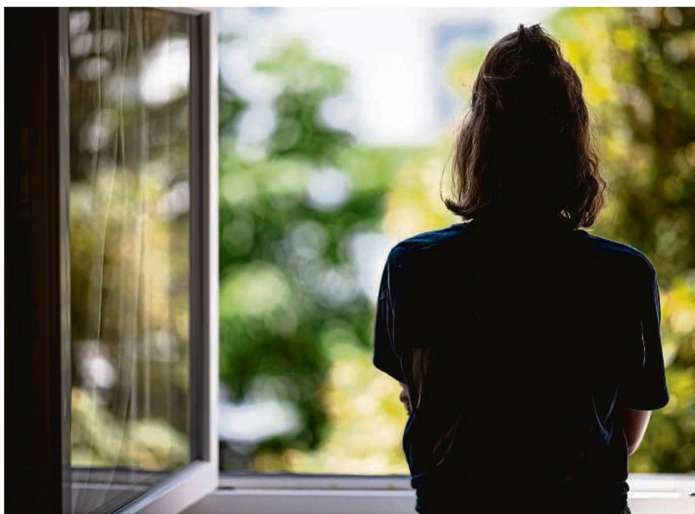
Wer spürt, dass die eigenen Ängste überhandnehmen, sollte sich genügend Pausen zugestehen.

Eine eigenständige Diagnose ist Krisenangst allerdings nicht. Kathrin Macha hält das zum jetzigen Zeitpunkt für richtig: „Attestieren wir jemandem eine individuelle