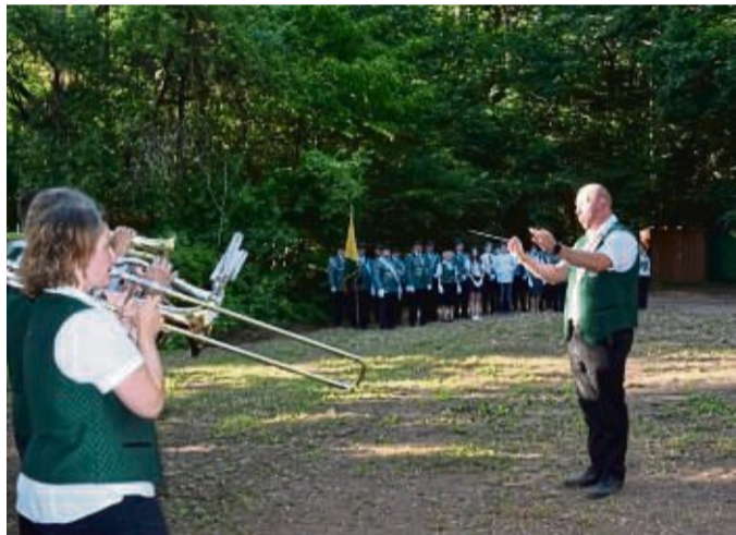
600 Jahre Schützengilde: Die Geschichte zum Nachlesen gibt es im Touristbüro.