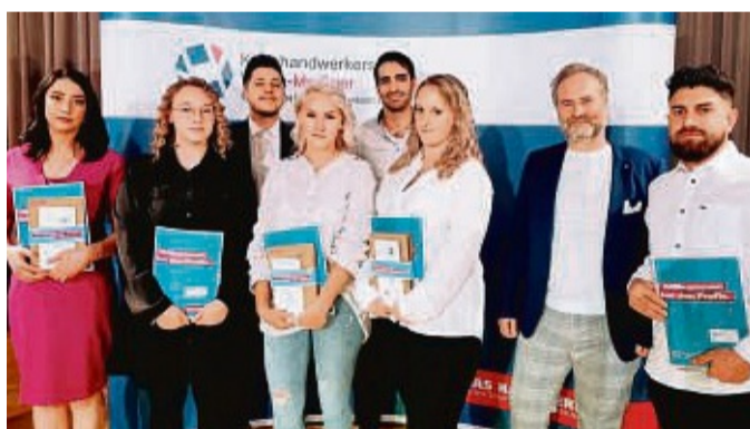
Die Innung der Friseure kann sich über sieben neue Gesellen freuen.