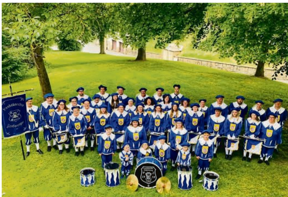
Freuen sich über viele neue Mitglieder: Der Landsknechtsfanfarenzug Sontra 1958 e.V. tritt am 1. Oktober in Sontra auf.

Wer den Fanfarenzug einmal live erleben möchte, kann dies beispielsweise auf