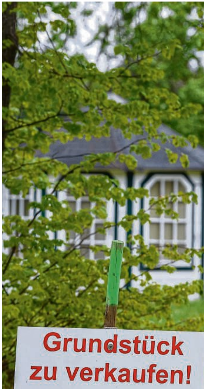
Hier entsteht neuer Wohnraum: Gemeinden versuchen mit der Ausweisung neuer Baugrundstücke Einfluss auf die Bevölkerungsstruktur zu nehmen.

Käufer sollten also genau darauf achten, ob solch eine Verpflichtung im Vertrag festgeschrieben ist. Ist zum Beispiel eine Frist von drei Jahren gesetzt, muss das Haus zum vereinbarten Zeitpunkt fertig sein. „Deuten