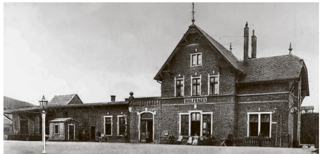
Ein Foto des 1897 in Betrieb genommenen Bahnhofs Wolfhagen: Hier eine Postkarte der Station, die unter anderem Gäste locken sollte.