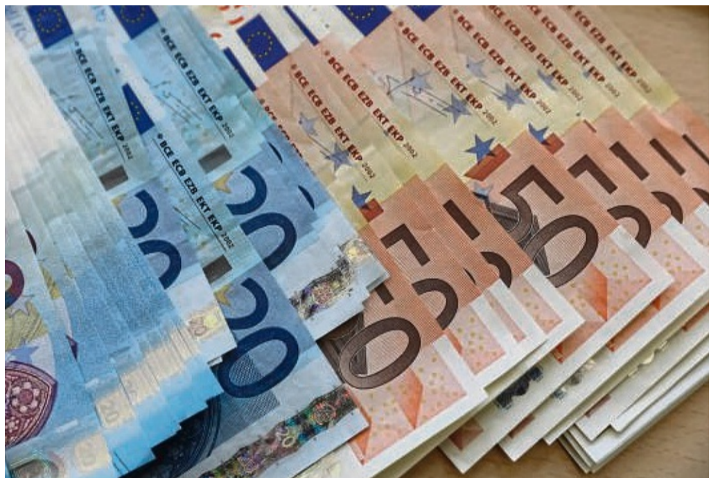
Die Gemeinde Reinhardshagen will von Fördergeld durch die Region Kassel-Land profitieren. Sie tritt dem Verein nach neun Jahren wieder bei.