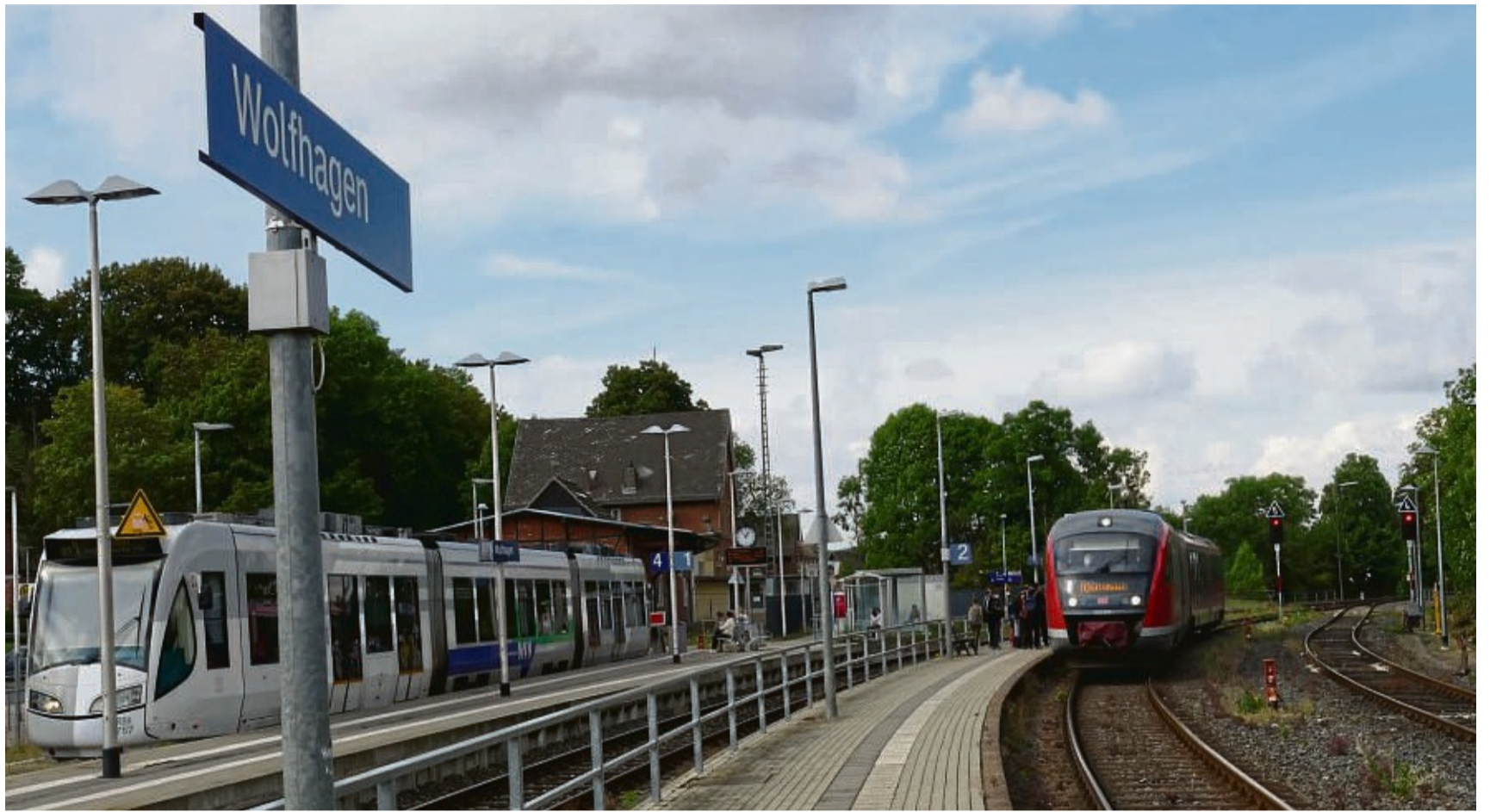
Viel los am Wolfhager Bahnhof: Sowohl die Line 4 der Kasseler Tram als auch die RB 4 der Kurhessenbahn fahren hier in Richtung Kassel. In der anderen Fahrtrichtung geht es nach Korbach.

Die Freude der Wolfhager über ihren neuen Bahnhof ging sogar so weit, dass sie ei-