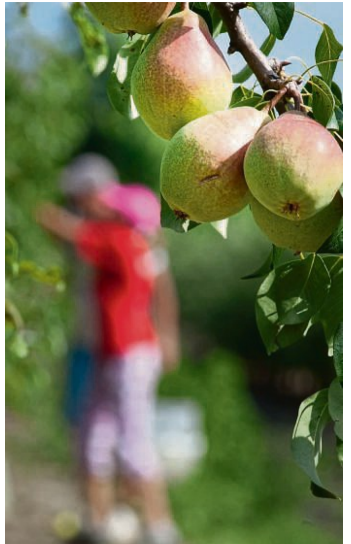
Ist die Ernte einer Birne erlaubt? Das hängt davon ab, ob der Baum wild wächst oder kultiviert wurde.

Wer gar nicht erst in Verdacht geraten will, mutwillig zu stehlen, sollte vor dem nächsten Herbstspaziergang also erst einmal abklären, bei welchen Bäumen und Sträuchern man sich bedienen darf.