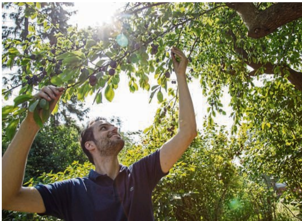
In geringen Mengen dürfen Früchte von wild wachsenden Bäumen geerntet werden.