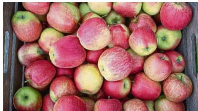
Messe „Nordhessen geschmackvoll!“: am Sonntag, 9. Oktober von 11 bis 17 Uhr in Melsungen.

tor Ernst Henn sind vorrätig: „Als der Landesvater sich noch Sorgen machte: Vom Leben der kleinen Leute“ und „In diesen seltsamen, geschwinden und arglistigen Zeiten“. Außerdem gibt es Chronik zu Hornel und eine zu Breittau zu erwerben. Geöffnet hat das Büro am Montag, Dienstag, Donnerstag und Freitag von 8 bis 12 Uhr sowie mittwochs von 7 bis 12 Uhr. Nachmittags ist Montag und Dienstag von 13.30 bis 16 Uhr und donnerstags von 13.30 bis 18 Uhr geöffnet. Zusätzlich ist jeden ersten und dritten Samstag von 10 bis 12 Uhr geöffnet. ulk