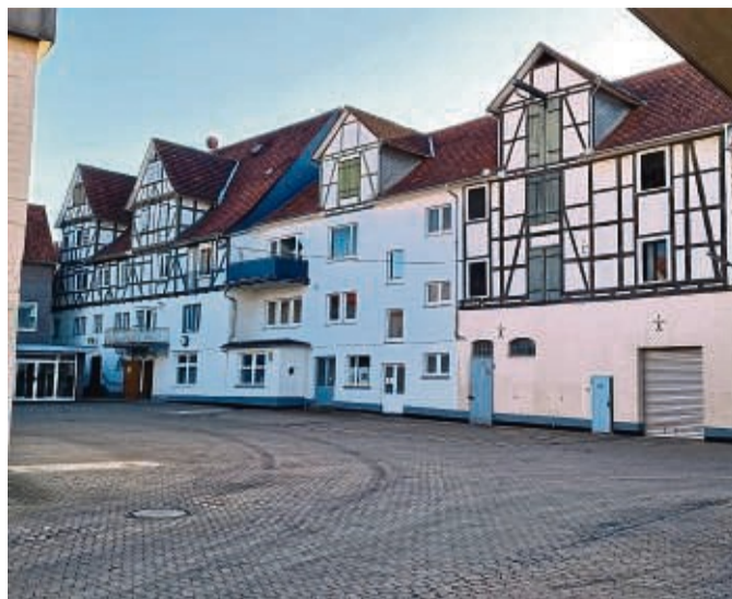
Erstmals findet das Kreiserntedankfest auf dem Gelände der neuen Eschweger Markthalle statt.