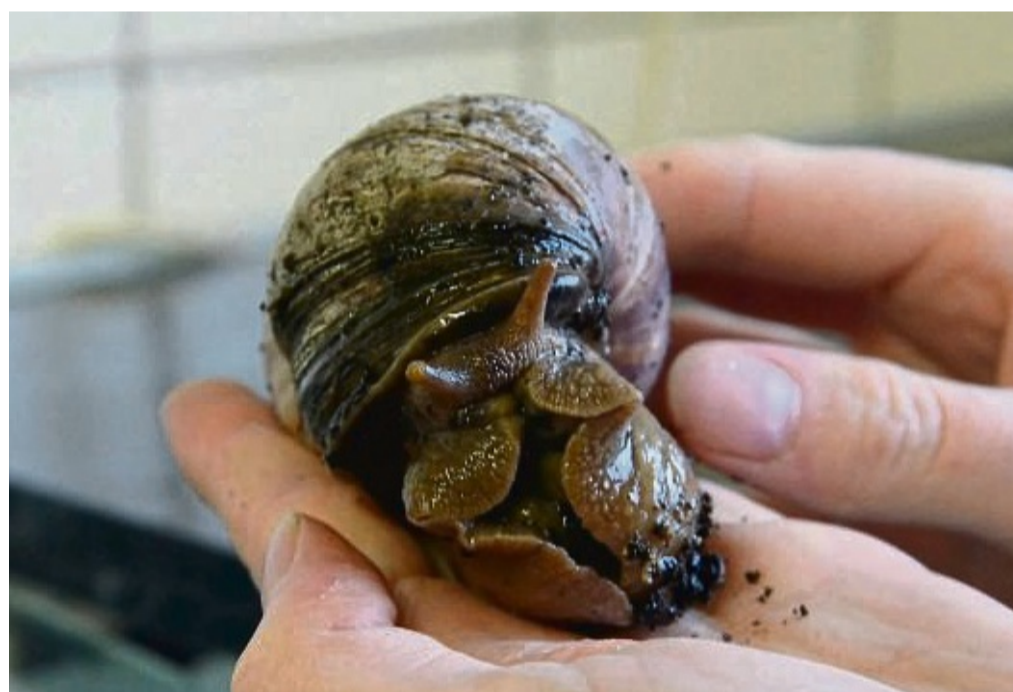
Riesenschnecke aus der Nähe: Zwei afrikanische Achatschnecken leben jetzt für drei Wochen bei den Wiesenwichteln.

Für die beiden Riesenschnecken ist die Ulfener Kita so eine Art Tourneeauftritt durch den Werra-Meißner-Kreis. Denn die beiden Tiere, die übrigens wie alle Achatschnecken Zwitterwesen sind und sich bei der Paarung ge-