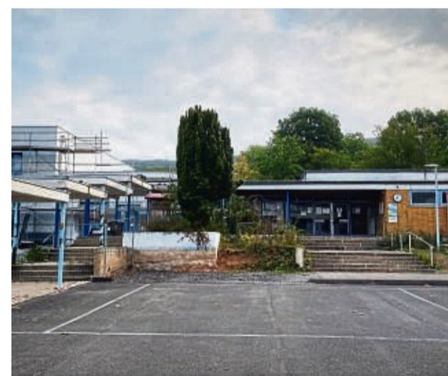
Kreis verhängt für Gebäudeteil D einen vorläufigen Baustopp, weil sich bei Renovierung große Mängel herausgestellt haben.

Bei der Teilentkernung des alten Gebäudes D wurden zahlreiche Schäden festgestellt. So ist die Wärmedämmung des Daches durch jahrelang eindringendes Wasser irreparabel durchnässt. Tragende Elemente der Holzfassade sind größtenteils verfault und statisch nicht tragbar. Die Alufenster zum Innenhof, bei denen eigentlich nur die Scheiben ausgetauscht werden sollten, haben sich als irreparabel undicht herausgestellt. Zudem müsse nun auch eine umfassende Betonsanierung gemacht werden, und unter anderem deshalb auch die gesamte verklüftete Fassade abgetragen sowie Schimmel- und Feuchtigkeitsschäden behoben werden. Als Alternative zu der jetzt um 1,6 Millionen Euro teureren Sanie-