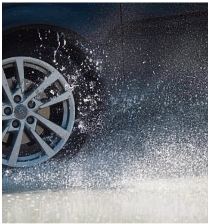
Sicher durch den Regen: Fahren auf nassen Straßen verlangt nach gefühlvollem Umgang mit Gas, Bremse und Lenkung - und nach mehr Abstand.

Bei Anzeichen von Aquaplaning gilt: Ruhe bewahren, nicht scharf bremsen, nur langsam vom Gas gehen. Wichtig: Starke Lenkbewegungen vermeiden und die Räder gerade halten. Dann fährt das Auto nach Ende der Rutschstrecke normal weiter.