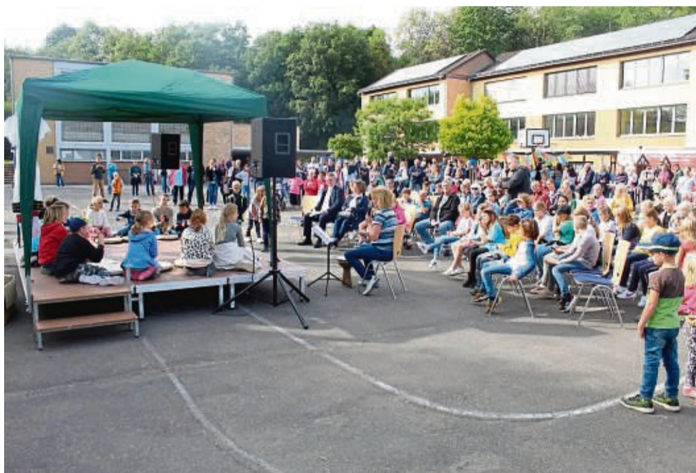
Seit 20 Jahren unter neuem Namen: Anlässlich des Jubiläums der Namensgebung fand ein Fest in der Grundschule statt.

Die Schule engagiert sich für den Kontakt der Kinder mit anderen Kulturen und unterstützt die von Namensgeber Karlheinz Böhm gegründete Stiftung „Menschen für Menschen“. Die Hilfsorganisation, die im Jahr 1981 ins Leben gerufen wurde, führt in Äthiopien langfristig angelegte Hilfsprojekte unter Böhms Credo „Hilfe zur Selbsthilfe“ durch. Unter anderem werden die gesammelten Spenden für den Bau von Brunnen in Äthiopien eingesetzt, um die Versorgung mit