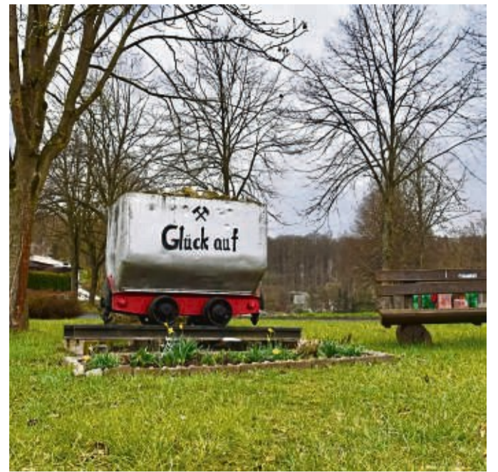
500 Jahre Bergwerksordnung und mehr: Geschichtliche Bücher über Sontra gibt es im Touristbüro.

dell-Region Hersfeld-Rotenburg: Die Ökomodell-Regionen aus Nordhessen stellen sich vor. Im Rahmen des Slow-Food-Spezialitätenfestivals „Nordhessen geschmackvoll!“ am Sonntag, den 9. Oktober von 11-17 Uhr präsentieren sich in Melsungen gemeinsam die Ökomodell-Regionen aus Nordhessen mit einem Infostand über ihre Arbeit und Projekte. Es präsentieren sich die Ökomodell-Region Hersfeld-Rotenburg, die Ökomodell-Region Schwalm-Eder und die Ökomodell-Region Nordhessen, die die Landkreise Werra-Meißner, Kassel und die kreisfreie Stadt Kassel umfasst. Wir freuen uns auf ihren Besuch. Weitere Infos: Ökomodell-Region Hersfeld-Rotenburg, 06621-872209 oder per Mail oemr@gutesaus-waldhessen.de oder www.oekomodellregionen-hessen.de. Weitere aktuelle Hinweise für die Landwirtschaft der hiesigen Region sind im Internet unter www.aglw.de zu finden. red