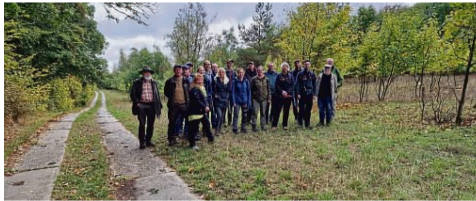
Experten aus ganz Deutschland waren auf Exkursion entlang des ehemaligen Todesstreifens bei Wanfried.

Und dabei spielt die Beweidung der Flächen eine große Rolle. „Schaf schafft Landschaft“ arbeitet in dem sogenannten „Hotspot 17“