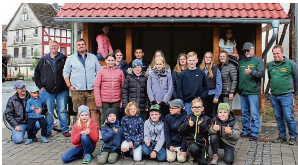
Große Freude: Mitglieder des aktuellen und ehemaligen Ortsbeirates mit einigen Busfahrkindern aus Sehlen vor dem neuen, in Eigenregie gebauten Buswartehäuschen am Dorfmittelpunkt.