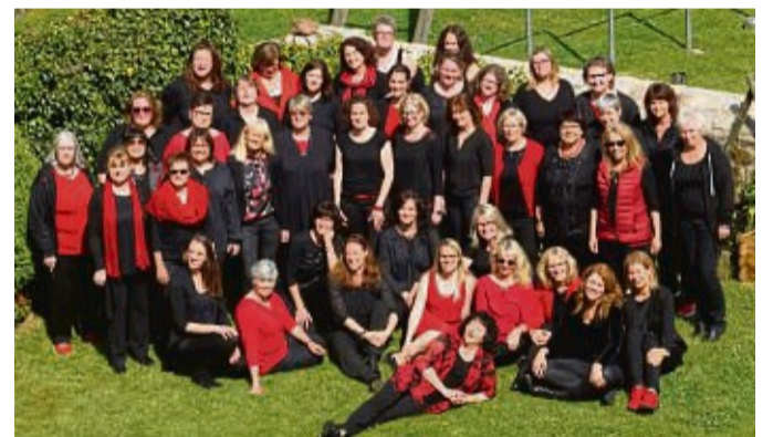
Der Gospelchor „Sisters in Action“ gibt am Samstag, 8. Oktober, ein Konzert in der Korbacher Nikolaikirche.