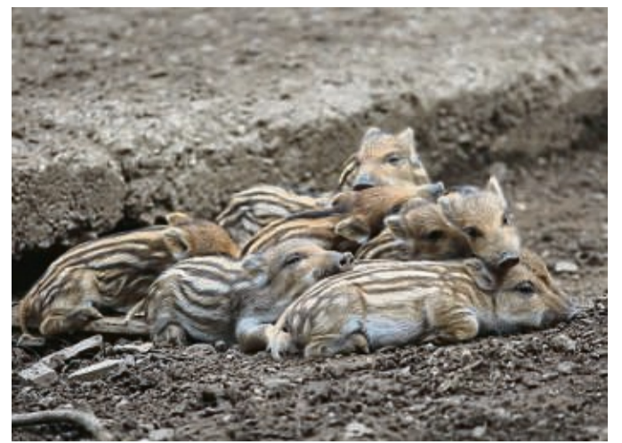
Mit Wildschweinen fing alles an: Fünf „Schwarzkitel“, ein Mufflon und acht Damhirsche waren die ersten Bewohner von Gehegen am Bericher Holz, wo der Wildpark 1970 gegründet wurde.