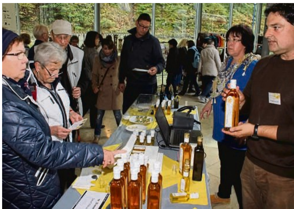
Viel zu verkosten gibt es traditionell bei der Wildunger Direktvermarktermesse.