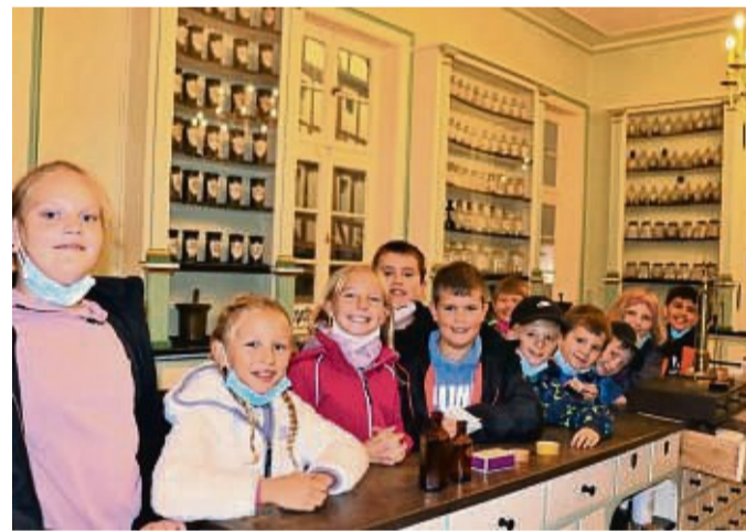
Lernen einiges über Arzneimittel: Die Kinder der dritten Klassen der Würfelturmschule waren zu Gast im Hofgeismarer Apothekenmuseum.