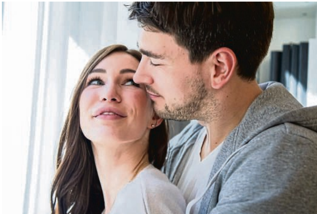
Eine Umarmung fühlt sich einfach gut an - auch weil so das Kuschelhormon Oxytocin im Körper stärker ausgeschüttet wird.

Damit wir uns gut fühlen, muss der individuelle Cocktail stimmen. Allerdings sind viele dieser Vorgänge hochkomplex und noch nicht bis ins Detail erforscht. Dennoch stellt sich die Frage: Können wir auf unsere Glückshormone Einfluss nehmen?