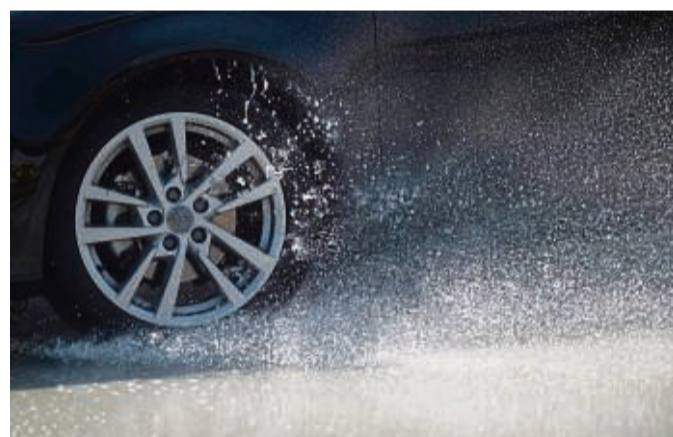
Sicher durch den Regen: Fahren auf nassen Straßen verlangt nach gefühlvollem Umgang mit Gas, Bremse und Lenkung - und nach mehr Abstand.

bahnauffahrt. Auch ausgefahrene Fahrbahndecken mit tiefen Spurrillen sind Gefahrenstellen mit Schleudergefahr.