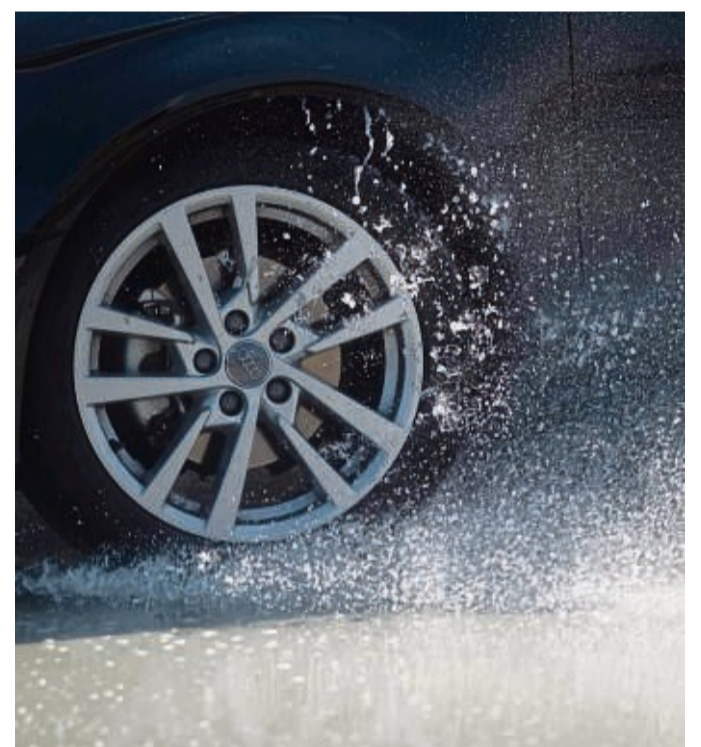
Sicher durch den Regen: Fahren auf nassen Straßen verlangt nach gefühlvollem Umgang mit Gas, Bremse und Lenkung - und nach mehr Abstand.

Warnsignale für Aquaplaning sind ein schwammiges