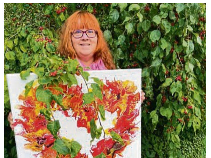
Die Bilder von Bettina Weyrich im Naturgarten bestechen durch ihre Farbigkeit und eigenwillige Formgebung und fügen sich bestens in die herbstlichen Farben ein, wie hier mit den Früchten der Japanischen Zierkirsche.

Durch die Entstehung der unterschiedlichen Dichte und Fließfähigkeit entstehen kraftvolle, geheimnisvolle Gemälde in erfüllten Farben, die dem Betrachter Inspiration und Entspannung schenken. Es sind viele Motive aus