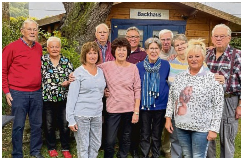
Die Wiedersehensfreude nach 61 Jahren nach der Schulentlassung war bei den Ehemaligen groß.

Von den ehemals 27 Schülerinnen und Schülern sind bereits zehn gestorben, sechs sagten aus gesundheitlichen Gründen ab, und die elf sind aus der Umgebung aber auch aus Melle, Bad Pyrmont, Seesen und Hannover angereist. Eine große Überraschung für alle war es, als Udo Pohlitz aus