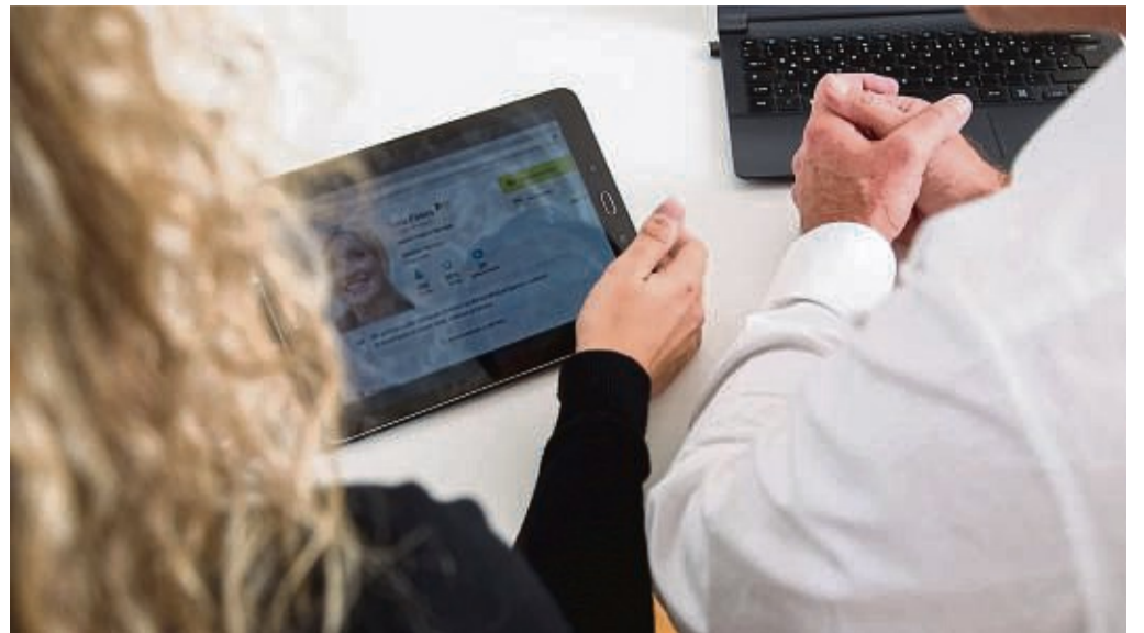
Ein Profil in einem Online-Karriere-Portal kann beim Netzwerken helfen - wenn es aussagekräftig und aktuell ist.

Nützliches Karriere-Tool oder Zeitkiller?