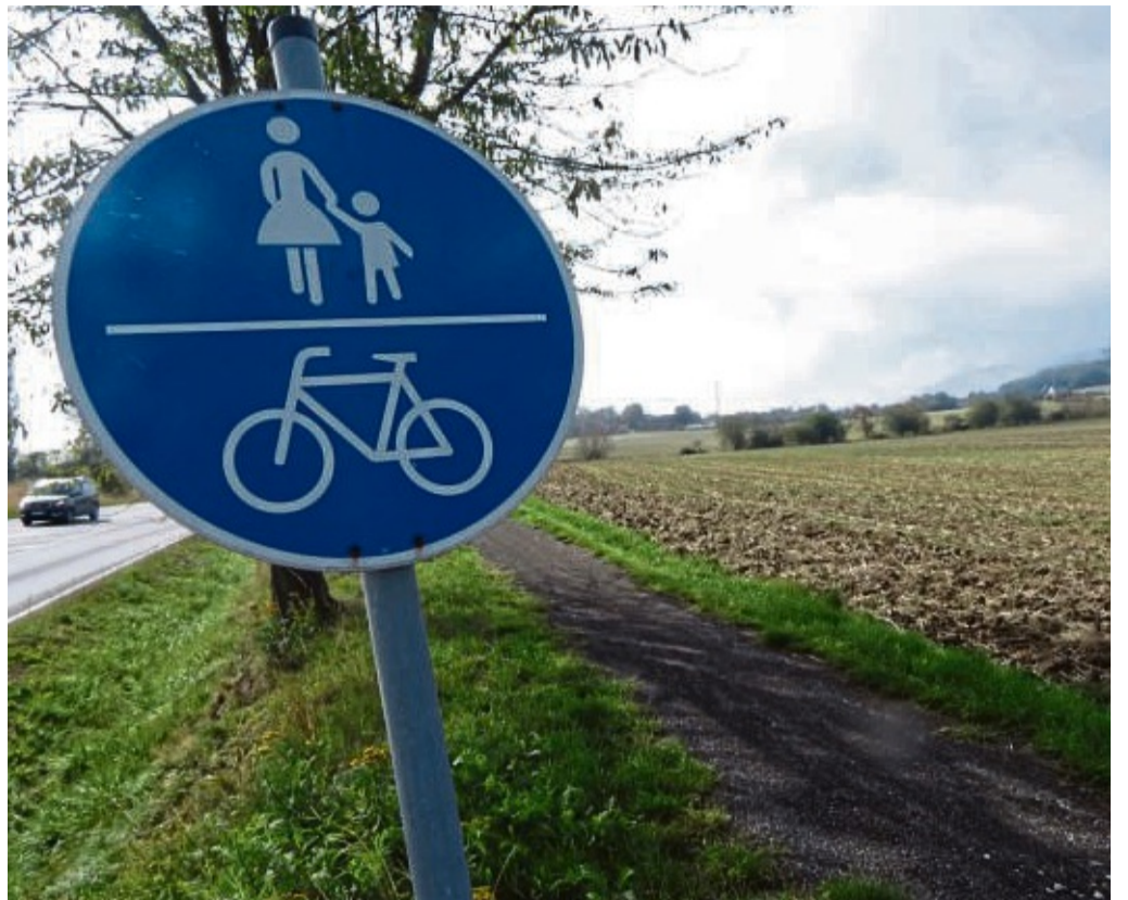
Auch für Radfahrer frei: Auch wenn die Ausweisung als offizieller Radweg fehlt, darf der Weg von Hebenshausen zur Ernst-Reuter-Schule (im Hintergrund) natürlich auch mit Fahrrädern genutzt werden.

Dem Beschluss, einen Arbeitskreis einzurichten, ging eine längere Vorstellung des Radverkehrskonzepts des Kreises voraus. Diethard Lindner vom Geo-Naturpark Frau-Holle-Land, der mit der Erarbeitung beauftragt ist, berichtete auch vom Stand der Din-