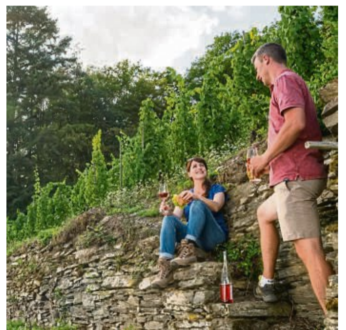
Historische Terrassenmauern zeugen von einem der kleinsten Weinbaurelikte Deutschlands mit einer fast 900-jährigen Geschichte - es liegt direkt an der Lahn.

Für Dirk Schulte, selbst ein geprüfter Bergführer, haben Wanderungen und Bergtouren im Herbst einen ganz eigenen Reiz: „Die vielen Farben, abwechslungsreiche Lichtverhältnisse und prächtige Weitsichten machen Herbsttouren zu etwas ganz Besonderem.“