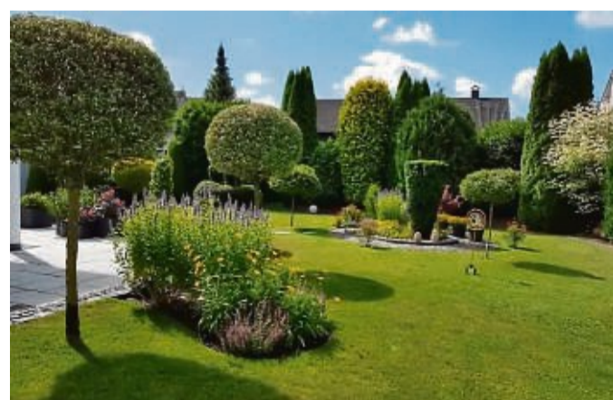
Nachhaltigkeit spielt auch im Garten eine große Rolle.

Wie jedes Haus ist auch jeder Grund anders und bietet in puncto Nachhaltigkeit verschiedene Möglichkeiten. Themen wie Anbau, Ressourcennutzung und Materialauswahl beweisen dabei vielversprechendes Potenzial. „Nachhaltigkeit ist auch in der Immobilienwirtschaft ein immer wichtiger werdendes Thema. Dabei wird der gesamte Lebenszyklus einer Immobilie berücksichtigt – von