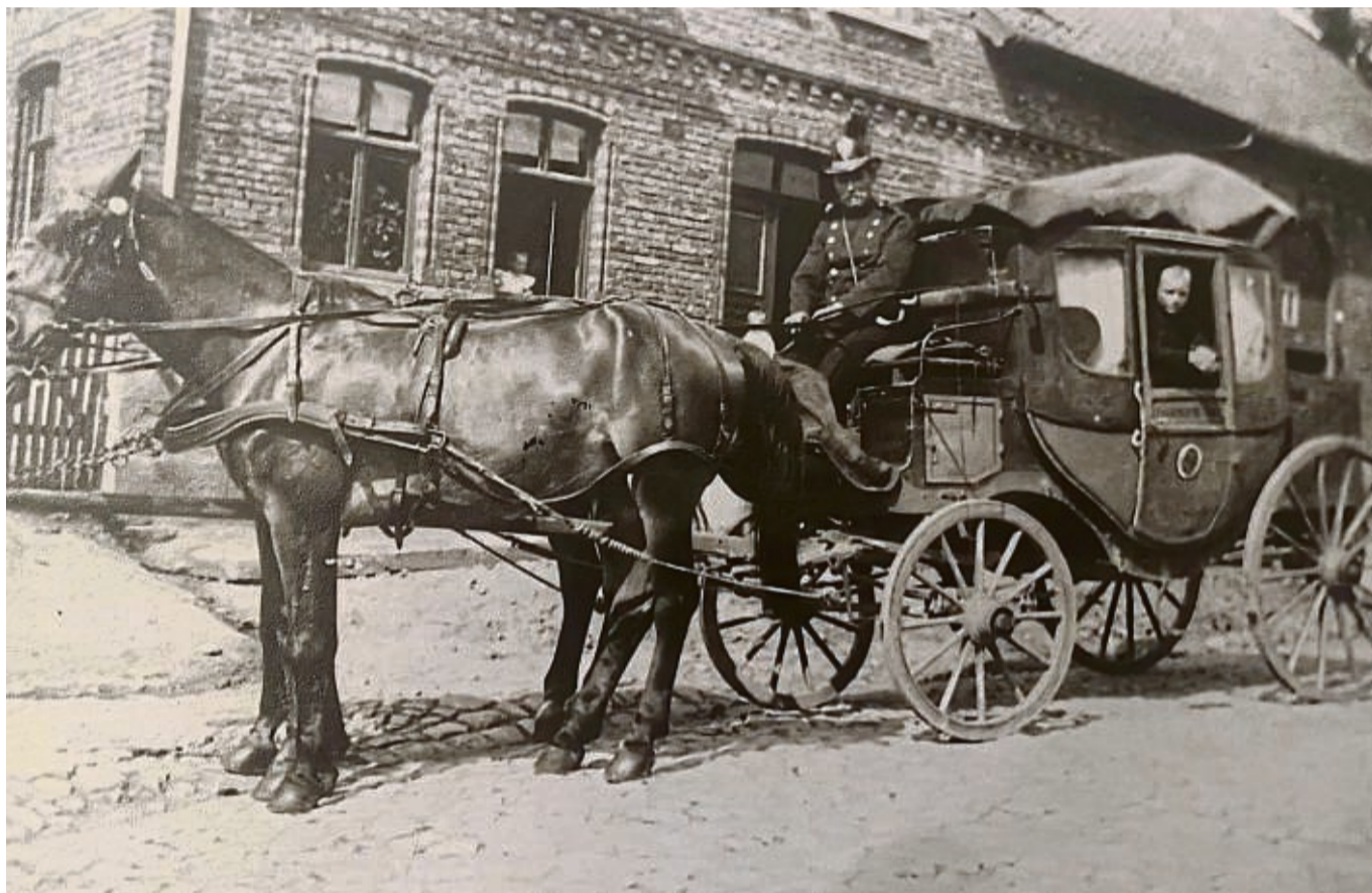
Die letzte Postkutsche fuhr in Rhoden am 30. September 1922. Es war ein wehmütiger Abschied. Nach Überlieferung sollen damals viele Menschen in Wrexen, Rhoden, Schmillinghausen, Helsen und Arolsen der Postkutsche nachgewunken haben.