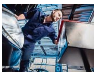
Im Herbst bieten die Autowerkstätten den Lichttest an.

Der Licht-Test umfasst die Sicht- und Funktionsprüfung sowie die Prüfung der vorschriftmäßigen Einstellung der Scheinwerfer bei allen Lichtsystemen, die dies ohne Diagnosegerät erlauben. Überprüft werden Fern- und Abblendlicht, Nebel-, Such-, Arbeits- und andere Zusatzscheinwerfer/-leuchten, Tagfahrlicht und Abbiegescheinwerfer, Rückfahrcheinwerfer, Begrenzungs- und Parkleuchten, Bremsleuchten, Schlussleuchten, Warnblinkanlage, Fahrtrichtungsanzeiger und Nebelschlussleuchte. Festgestellte Fehler können in der Regel zu den üblichen Kosten sofort behoben wer-