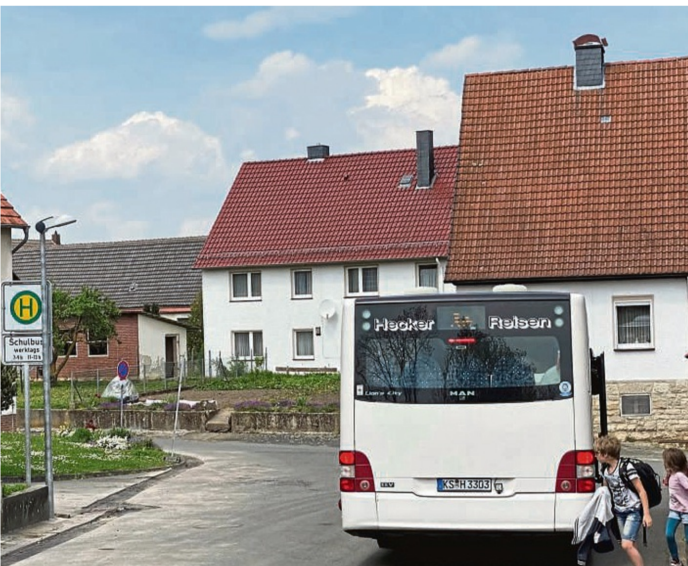
Der Schulbus fährt, der Gemeindebus derzeit nicht mehr: Kindergartenkinder müssen von Eltern von Niederlistingen zur Kindertagesstätte nach Oberlistingen gebracht werden.

Aus der Elternschaft wurde darauf hingewiesen, dass seitens der Gemeinde gerade mit diesem Angebot gewonnen wurde. In der Diskussion kam man schließlich überein, nochmals zu prüfen, unter welchen Bedingungen gegebenenfalls eine Wiederaufnahme des Fahrdienstes möglich sein könnte. Mit Blick auf die Finanzlage der Gemeinde soll geprüft werden, ob die Eltern sich mit einem Fahrgeld an den Kosten beteiligen müssen. „Zum Nulltarif wird es nicht gehen können“, so