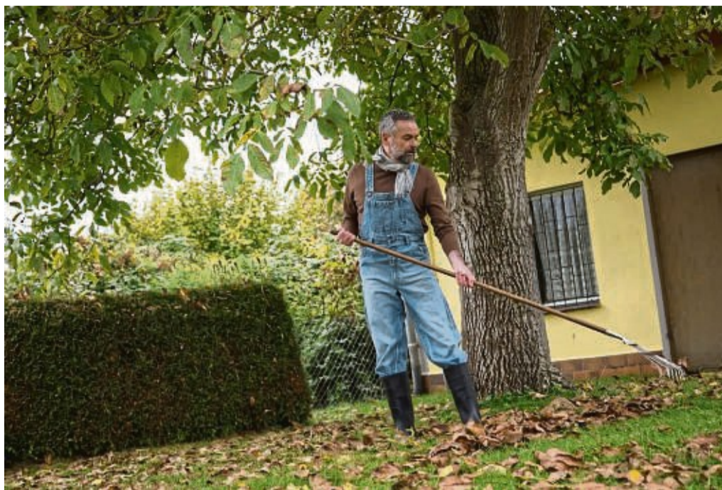
Laub sollte man vom Rasen entfernen. Auf Beeten aber kann es bleiben.

Ab 1. Oktober ist dies laut Bundesnaturschutzgesetz aber wieder erlaubt. Wer Igel, Zaunkönig und Co. aber weiterhin etwas Gutes tun möchte, schichtet den Heckenchnitt, Reisig und anderes Totholz in einer Ecke des Gartens als Überwinterungsmöglichkeit auf.