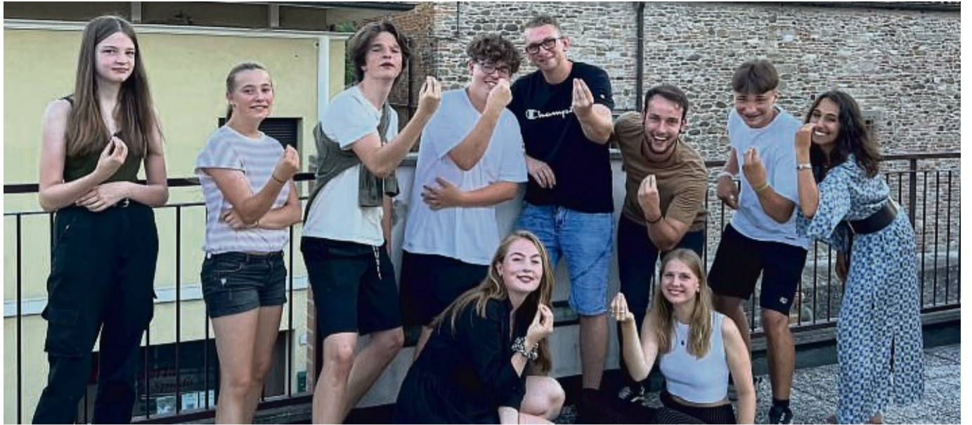
Der Spaß kam nicht zu kurz: Jugendliche aus Grebenstein und Umgebung waren eine Woche zu Gast in Grebensteins Partnerstadt Sarsina in der Emilia Romagna.