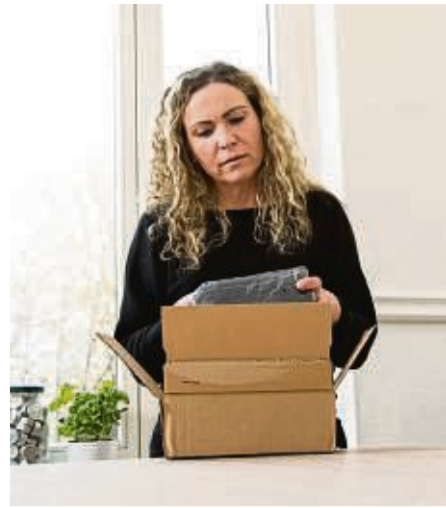
Heiße Luft in der Post? Wer online einen angeblich stromsparenden Heizstecker bestellt hat, erhält am Ende meist nicht funktionierende Ware.

Eine Luftfeuchtigkeit zwischen 40 und 60 Prozent wird von den meisten Menschen als angenehm empfunden und hält das Schimmelrisiko gering.