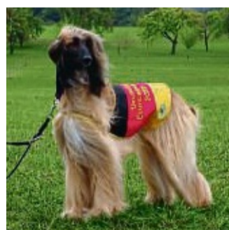
Gewonnen: Kirana nach dem Sprint.

Die Windhunde stammen, wie schon der Name sagt, aus Afghanistan. Um 4000 vor Christus soll der Vorfahr dieser Rasse von Nomaden gezüchtet worden sein. Der Afghane ist ein Jagdhund und wurde ursprünglich zur Hatz auf Schakale, Gazellen und anderes Wild eingesetzt. Um 1900 kamen die ersten Hunde dieser Rasse nach Europa. In den vergangenen Jahrzehnten wurde der elegante Jagdhund immer mehr zum Ausstellungstier bei Schönheitsschauen. Windhundtypisch ist der Afghane im Haus ruhig und unauffällig. Draußen muss er wegen seines Jagdtriebes gut kontrolliert werden. ewa