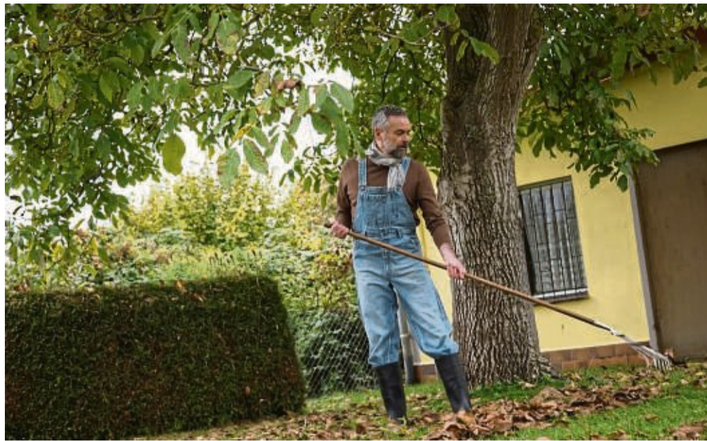
Laub sollte man vom Rasen entfernen. Auf Beeten aber kann es bleiben.