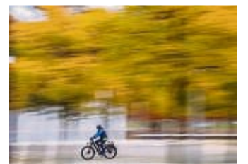
Wer im Herbst mit dem Rad unterwegs ist, sollte möglichst rutschfeste Reifen haben.

• Herbstlaub und Regen - die Lichter und Felgen sollten gelegentlich gereinigt werden. Felgenbremsen verschleifen sonst schneller. Bei Scheibenbremsen sollten die Beläge erneuert werden, wenn sie weniger als einen Millimeter dick sind. tmn