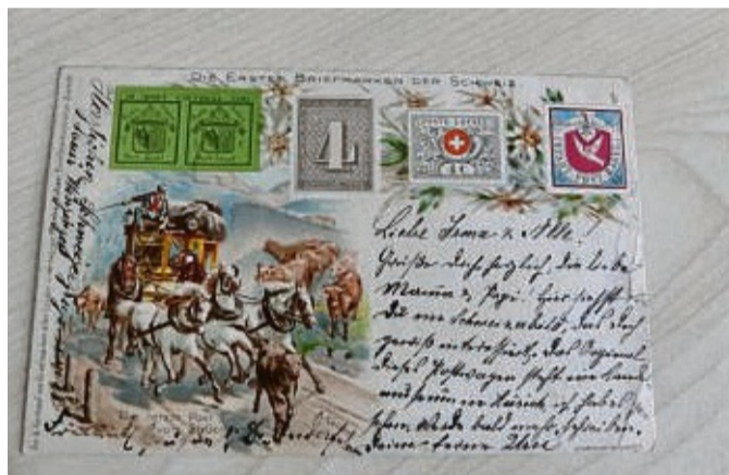
Eine Schweizer Postkarte gehört auch zur Sammlung des Ehepaars.