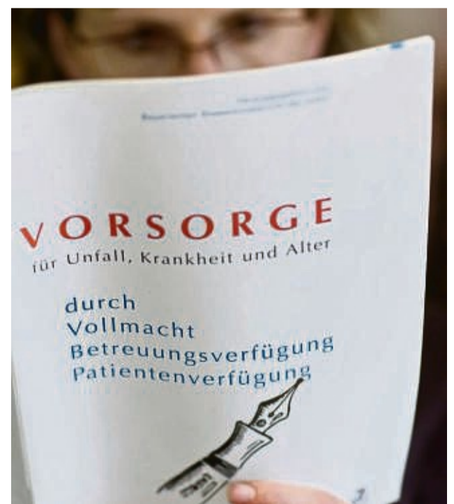
Rechtzeitig seine Wünsche fixieren: Vorsorge hilft Hinterbliebenen.

ma einzeln informieren und Dokumente selbst zusammenstellen zu müssen, kann man auf professionelle Hilfe zurückgreifen, etwa in Form eines Vorsorge-Ordners, den es von verschiedenen Organisationen oder lokalen Ansprechpartnern gibt. Er beinhaltet eine strukturierte Übersicht aller wichtigen Themen. Dazu kommen Hilfestellungen und Tipps zum Ausfüllen sowie Vordrucke, Formulare und Checklisten. Zusätzlich ist ein Notfallausweis enthalten. Dieser kommt ins Porte-