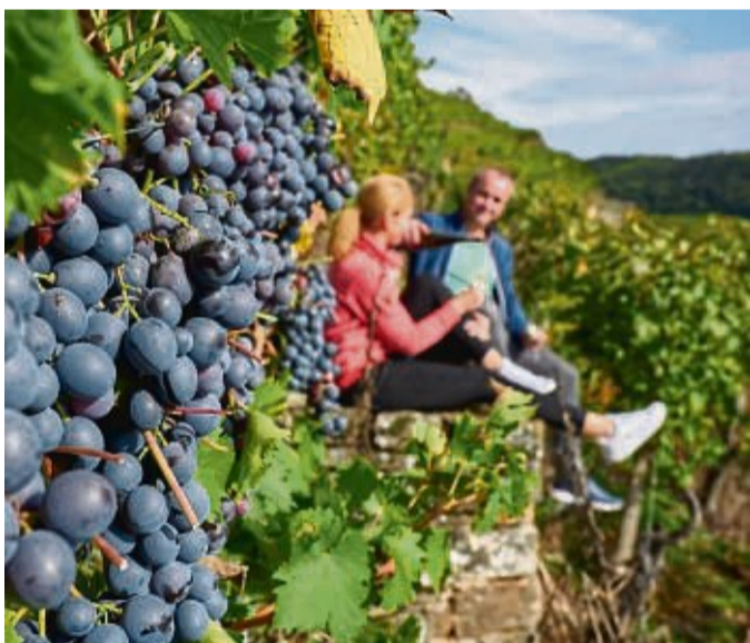
Bei einer Wanderpause in den Weinhängen können Ausflügler Wein und Aussicht genießen.