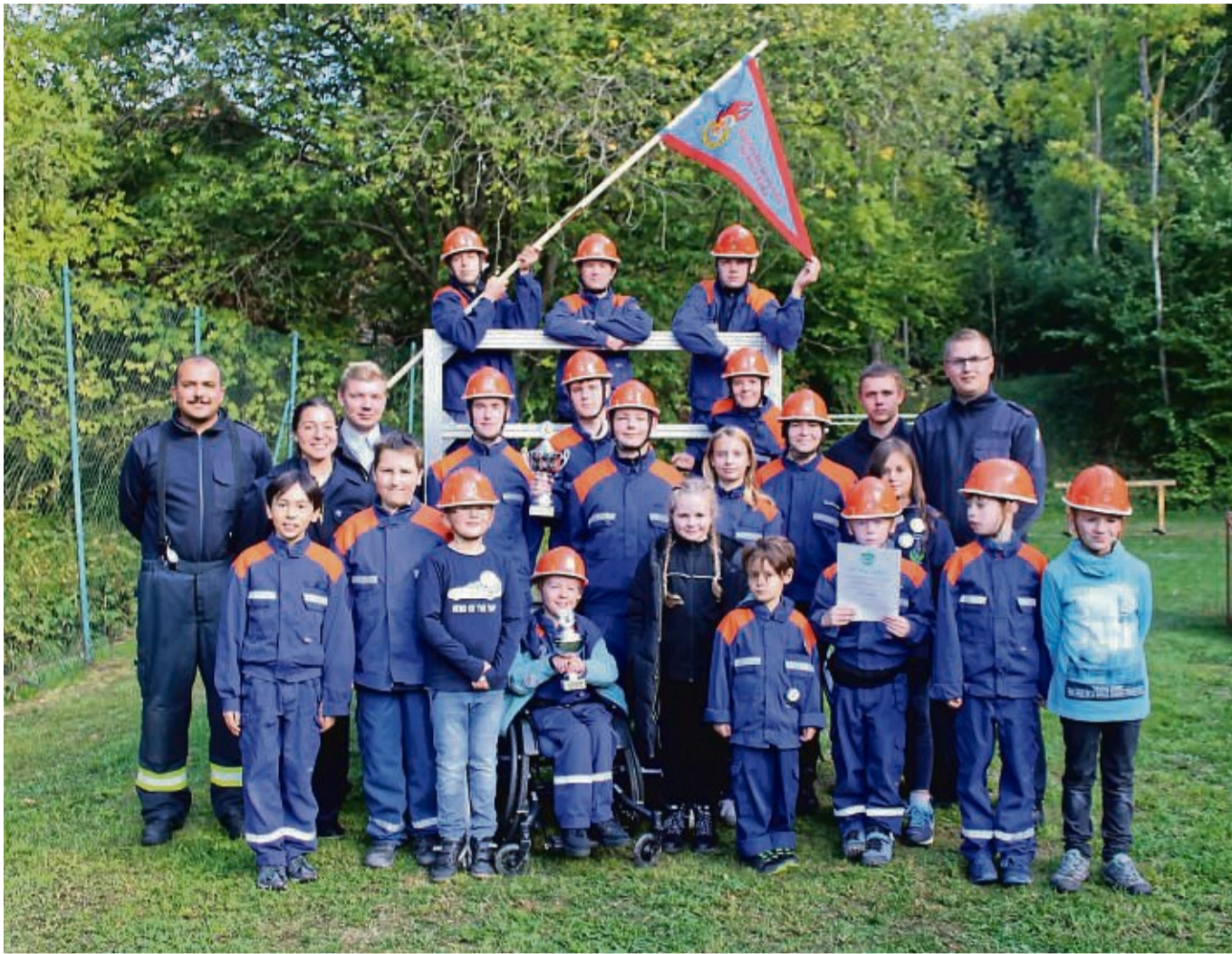
Konnten ihren Titel verteidigen: Die Kinder- und Jugendfeuerwehr Schwebda nahm in beiden Altersgruppen den Pokal mit nach Hause.