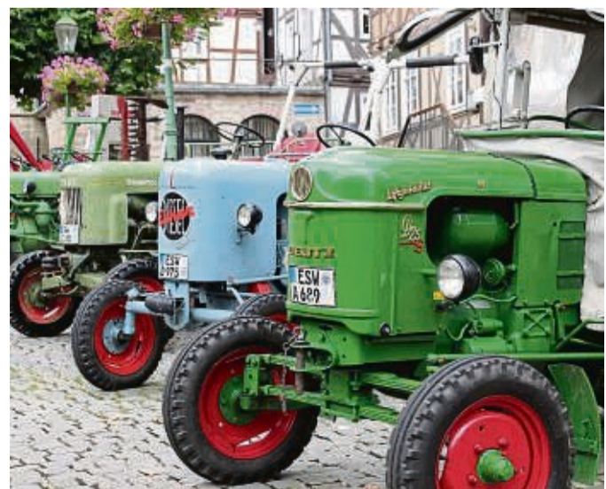
Am kommenden Sonntag findet der familienfreundliche Bauernmarkt wieder statt.