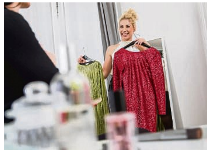
Steht mir das wirklich: Grün oder Rot?