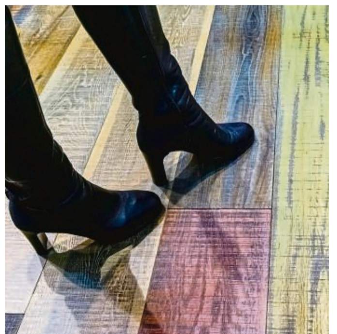
Farbige Pflegeöle bringen die Maserung eines Parkettbodens besonders zur Geltung.

Was man dabei in Kauf nimmt: Die Pflege mit Öl ist aufwendiger als bei lackiertem Parkett. Der Verband empfiehlt, bei normaler Abnutzung im Wohnraum einmal im Jahr ein Pflegeöl aufzutragen. Kommt es doch zu kleinen Schäden, zum Beispiel helle Feuchtigkeitsränder durch einen undichten Blumentopf, lassen sich diese mit farbigem Öl gut ausgleichen. tmn