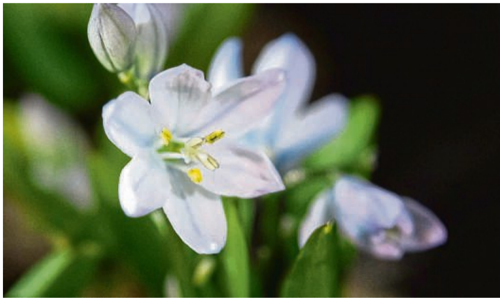
Der Schneestern wird erst kommenden Frühjahr erblühen - aber schon jetzt muss er in den Gartenboden.

Der Nickende Milchstern (Ornithogalum nutans) färbt seine Blüten nur innen weiß, außen bleibt ein grüner Rand. Die Pflanze wird rund 30 bis 40 Zentimeter hoch und erblüht von März bis April. Sie ist etwas für viele Standorte, denn der Milchstern verträgt volle Sonneneinstrahlung bis Halbschatten.