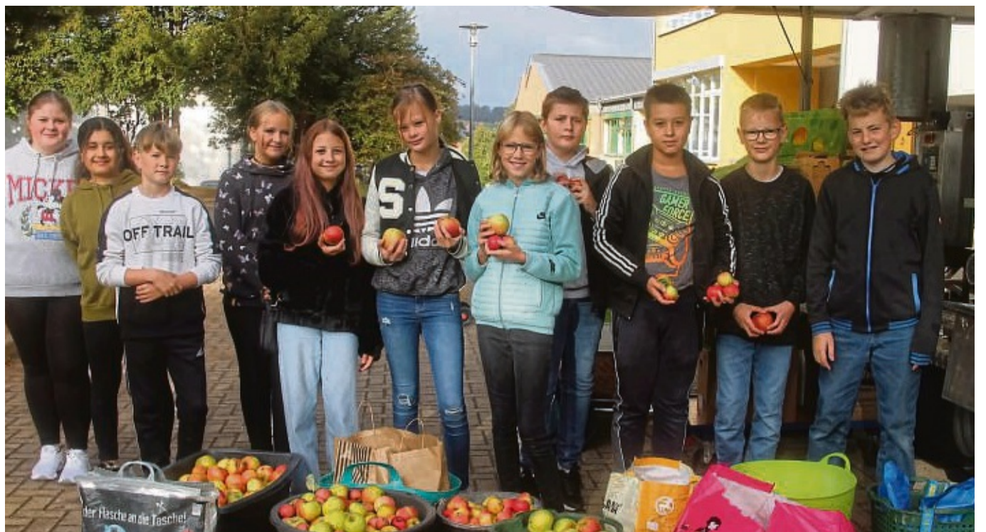
Apfeltage an der Walter-Lübcke-Schule: Mädchen und Jungen der Klasse 6F1 präsentieren ein Teil ihrer Apfelernte.

Info: Unter nussjagd-hessen.de finden Lehrer und Gruppenleiter alle Unterlagen und weitere Unterrichtsmaterialien zum Herunterladen