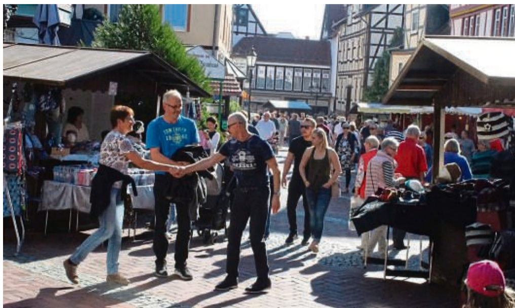
Buntes Markttrreiben: Am Sonntag haben nicht nur die Geschäfte geöffnet, an über 30 Ständen kann man in der Innenstadt nach Herzenslust stöbern, probieren und shoppen.

Der Sonntag, 16.10., beginnt mit dem Gospelgottesdienst um 11 Uhr auf dem Marktplatz. Danach findet nicht nur ein Kinderpro-