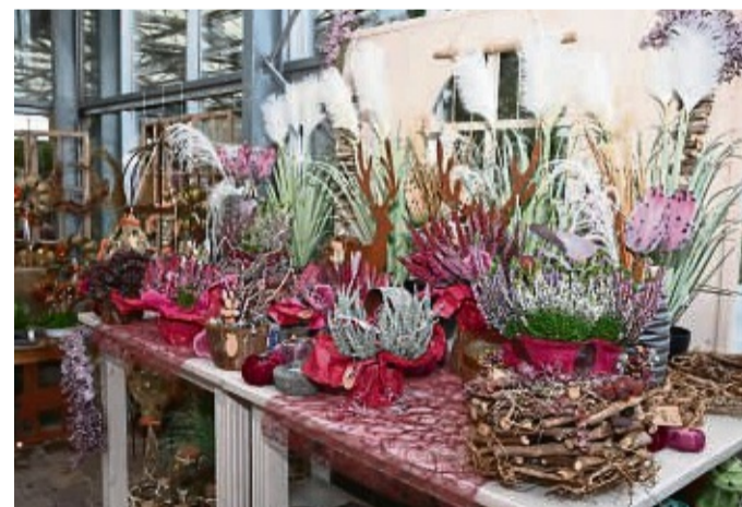
Kreativ und spannend: Im Gartencenter Meckelburg findet man eine Vielzahl an herbstlichen Accessoires für Drinnen und Draußen.