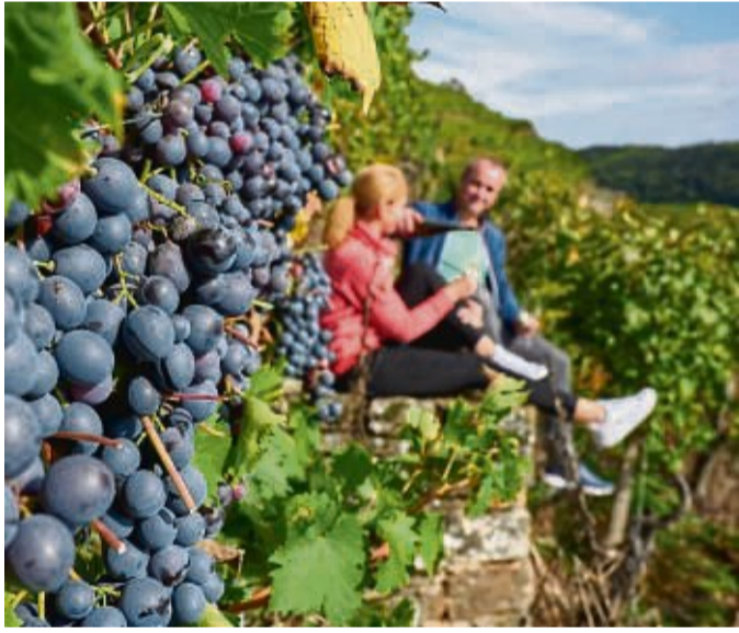
Bei einer Wanderpause in den Weinhängen können Ausflügler Wein und Aussicht genießen.