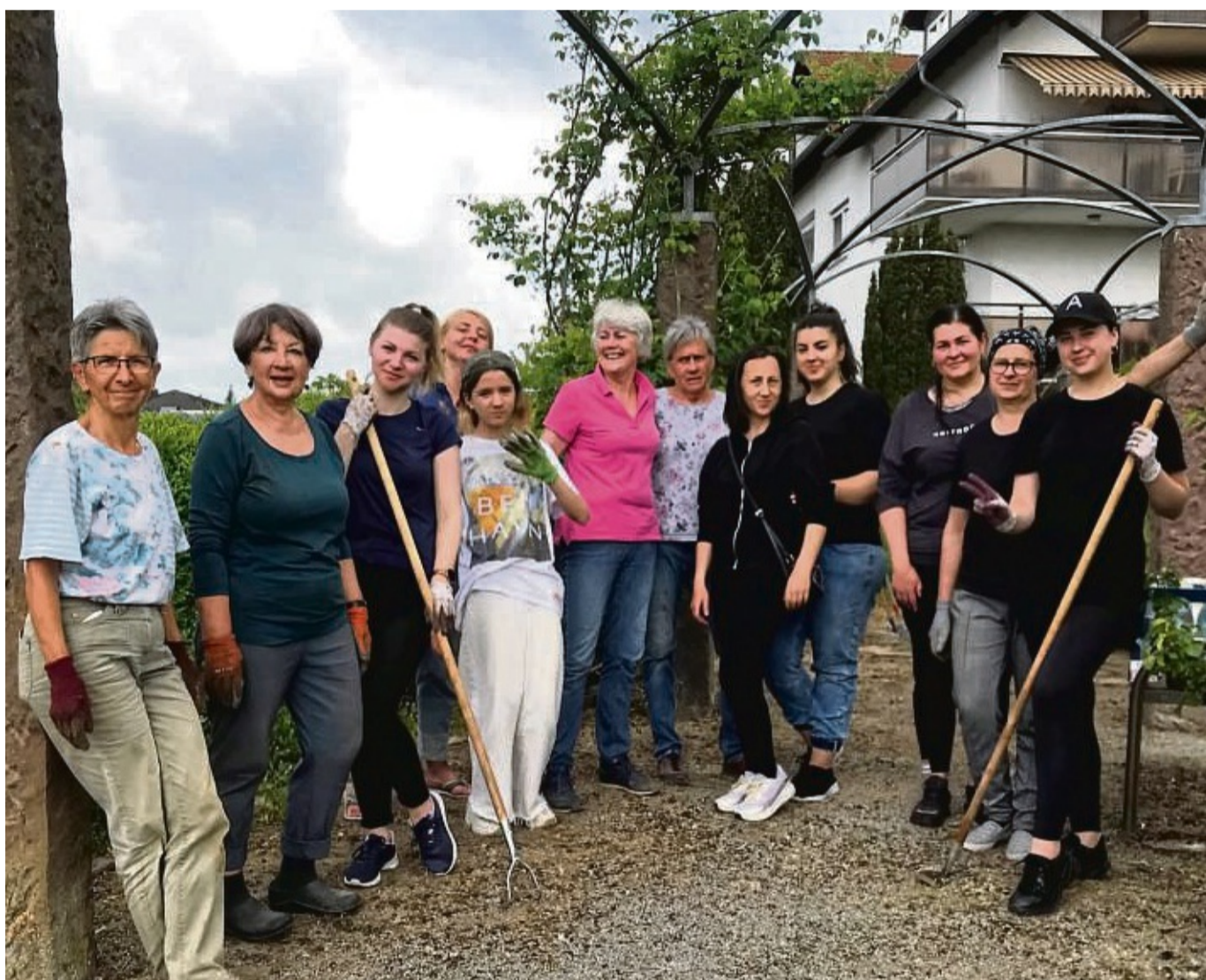
Gemeinsam viel erreicht: Mitglieder des Fördervereins mit Frauen aus der Ukraine, die bei der Arbeit im Rosenbeet unterstützt haben.

Unterstützung sei gerade auch jetzt zu den Herbstarbeiten sehr willkommen. Gerne auch jüngere Rosenbegeisterte wünscht sich die Garten- und Landschaftsarchitektin für die anfallenden Arbeiten auf der Teilfläche des insgesamt knapp neun Hektar großen Parks. Jenseits des Rosengartens kümmern sich die Mitarbeiter des Bauhofs um die Pflege der Fläche, im Spielbereich sind es die