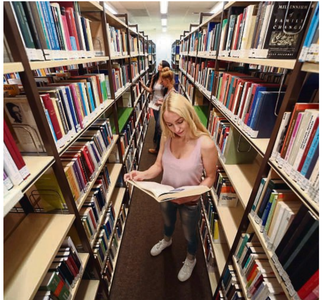
Wer sich früh genug informiert und bewirbt, kann im Studium oft von einem Stipendium profitieren.

Bei der Entscheidung für oder wider ein bestimmtes Stipendium sollten sich Interessierte dann Fragen stellen wie: Kann ich mich in der Stiftung wohlfühlen? Stimmen die vertretenen Werte mit den eigenen überein? Und wie möchte ich mich in der Stiftung einbringen? Auf solche Punkte gilt es in der Bewerbung einzugehen. „Man sollte genau wissen, mit welcher Stiftung man es