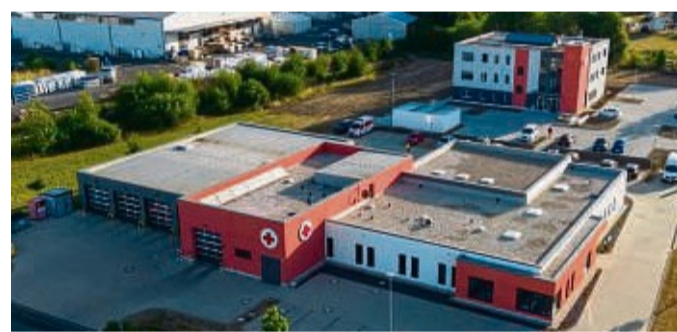
Die DRK-Rettungswache mit dem neuen Verwaltungsgebäude im Hintergrund.

Auf einem 8500 Quadratmeter großen Grundstück neben der DRK-Rettungswache ist ein hochmodernes aber zugleich schlichtes Verwaltungsgebäude mit drei Etagen von je 400 Quadratmetern sowie einem Keller-