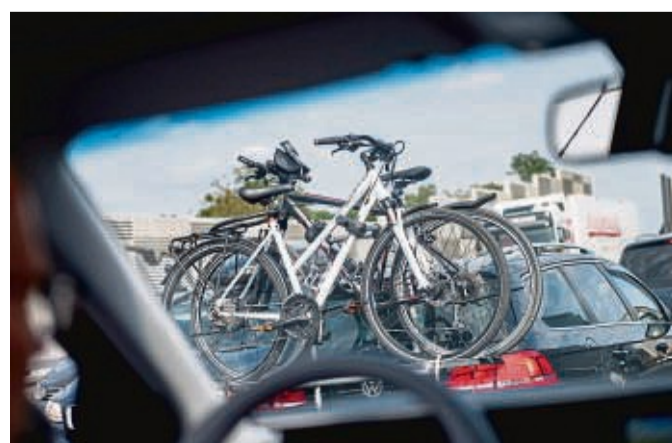
Mit Sack und Pack: Nach der Urlaubsfahrt entfernt man besser nicht mehr gebrauchte Ladung, um Sprit zu sparen.

Wer die Leuchtweitenregulierung manuell verstellt, sollte auch diese wieder an die normale Beladung anpassen, damit die Scheinwerfer nachts nicht zu tief stehen und man weit genug sehen kann. tmn