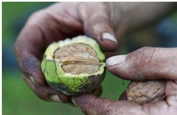
Ran an die Nuss: Erst die grüne Schale entfernen, dann die Nusschale knacken. Auch die dünne Haut um die Kerne muss abgezogen werden, denn sie schmeckt bitter.

Mit ihren ungesättigten Fettsäuren, Mineralstoffen und Vitaminen sind Walnüsse sehr gesund. In der Küche kommen sie auf vielerlei Art