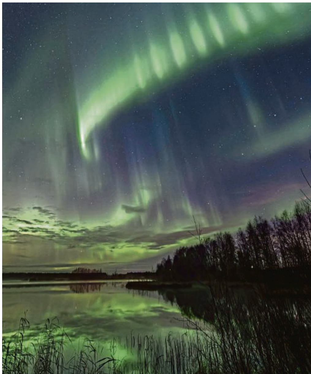
Viele, die in der kalten Jahreszeit in den hohen Norden reisen, hoffen auf so ein Naturschauspiel.

Zur Person: Thomas Kast lebt seit 22 Jahren in Finnland. Ursprünglich hat er Feinwerktechnik studiert, machte aber dann seine Leidenschaft Fotografie zum Beruf. Seit 2017 ist er als Fotograf und Anbieter von Fotoreisen im hohen Norden selbstständig. tmn