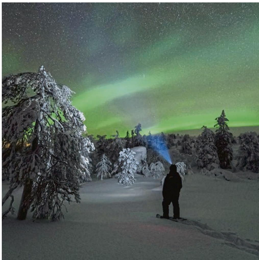
Polarlichter sind während des Winters im hohen Norden besonders gut zu sehen.