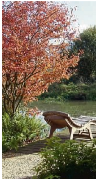
Die Kupfer-Felsenbirne bringt das herbstliche Farbspiel auch in den eigenen Garten.

vor ihrem Laubabwurf in einem warmen gelben Blätterkleid zeigt. Auch der Rotholz-Hartriegel (Cornus alba) bringt herbstliche Farbtupfer in kleinere Gärten. Seine Blätter verfärben sich im Herbst leuchtend rot. Im Winter zeigen sich die Zweige des Zierstrauchs dann ebenfalls in der feurigen Farbe. Wer etwas mehr Platz hat, kann beispielsweise Amerikanisches Gelbholz (Cladrastis lutea) pflanzen. Das wird zwischen zehn und 15 Meter hoch - in Ausnahmefällen sogar bis zu 25 Meter - und färbt sich herbstlich gelb. Gut in allen Jahreszeiten macht sich die Kupfer-Felsenbirne (Amelanchier lamarckii). Im Frühjahr beeindruckt sie mit weißen Sternblüten, im Herbst erstrahlt sie in Gelb-, Orange- und Rottönen.