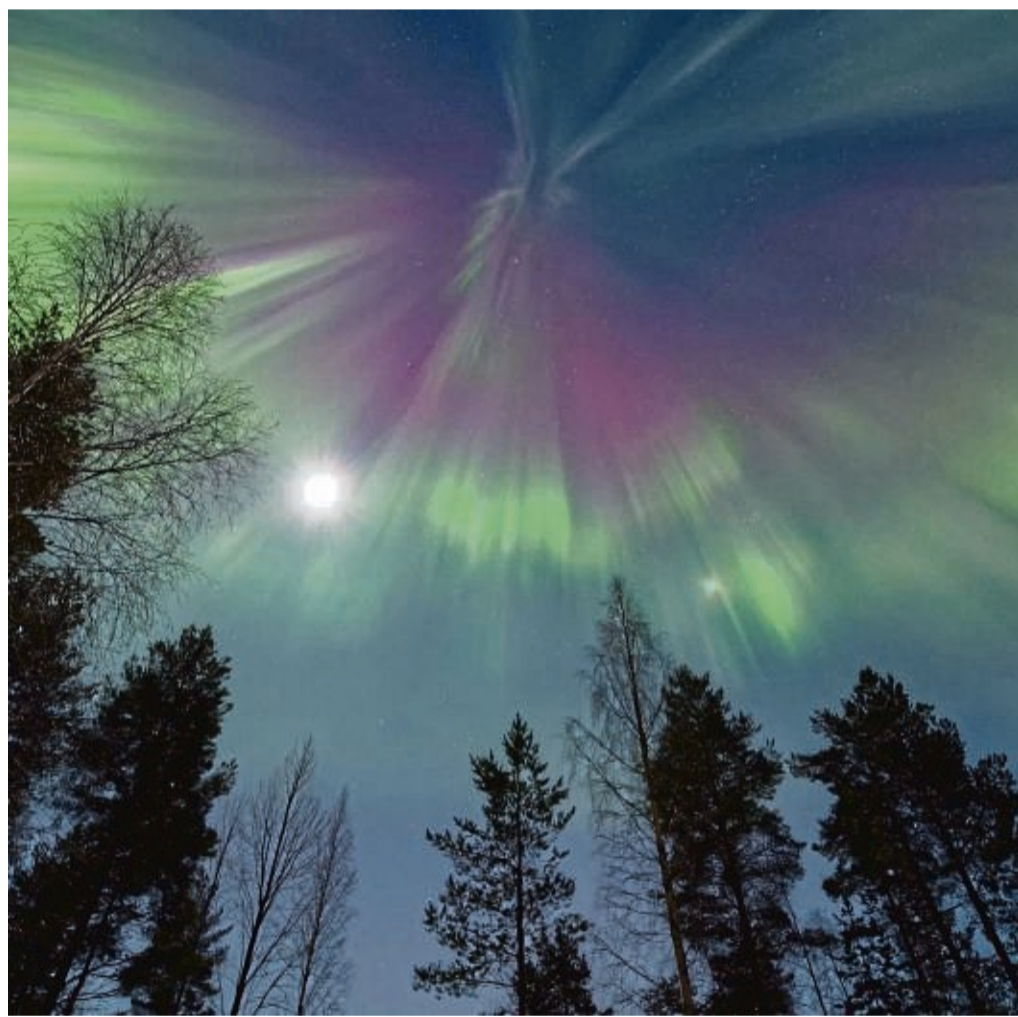
Die Voraussetzung für solche Aurora borealis sind Sonnenwinde - und für ihre Sichtung ein klarer Himmel.