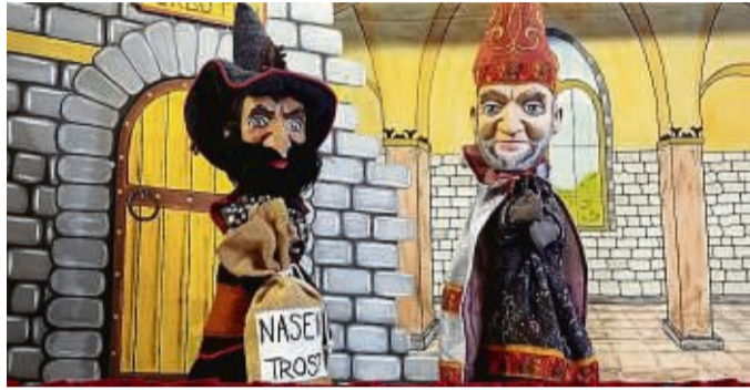
Mit dabei: Räuber Hotzenplotz und Zauberer Petrosilius Zwackelmann.