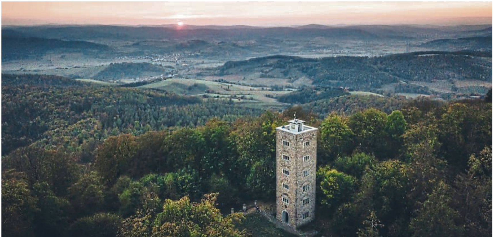
Der Alheimerturm ist ein beliebtes Ausflugsziel und ein Kulturdenkmal. Von dort könnte man bald auf Windräder blicken – das will die „Naturschutzinitiative“ verhindern.

„Die Höhenzüge des Stölzinger Gebirges sind ein Dichtezentrum des Rotmilans in Hessen und darüber hinaus ein Hotspot der Artenvielfalt. Der Bereich muss vor jeglichen negativen Veränderungen zum Nachteil der be-