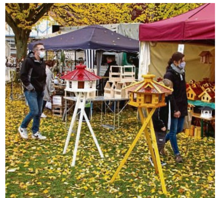
Auch Vogelhäuser werden auf dem Kuckucksmarkt in Braach angeboten.

An diesen Marktwochenende wird ein Kinderkarussell vor Ort sein. Am Sonntag können die Kinder ab 13 Uhr im DGH Laternen basteln. Das Material stellt der Kuckucksmarkt kostenfrei zur Verfügung. Die Laternen können die Kinder auf dem Lamppenzug präsentieren. Dieser startet gegen 17.15 Uhr vor dem Marktgelände. red/dag