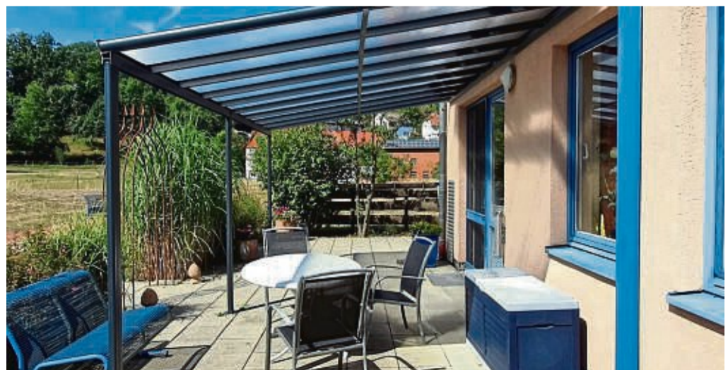
Das Altenhilfezentrum Ludwigsau freut sich über ein neues Angebot für Palliativpatienten.

stattfindenden Veranstaltungen, wie beispielsweise dem Herbstmarkt. Ferner wird weiterhin um zusätzliche Mitglieder geworben. red/dag