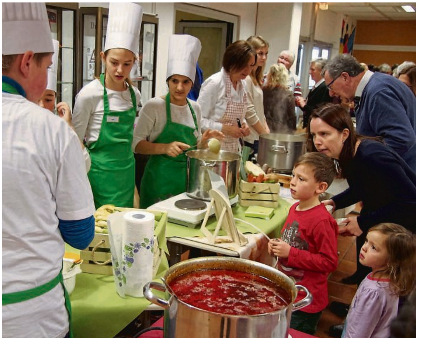
Das Suppenfest in Bebra findet nach sieben Jahren Pause wieder in Bebra statt. Unser Foto entstand bei der letzten Veranstaltung im Jahr 2015.