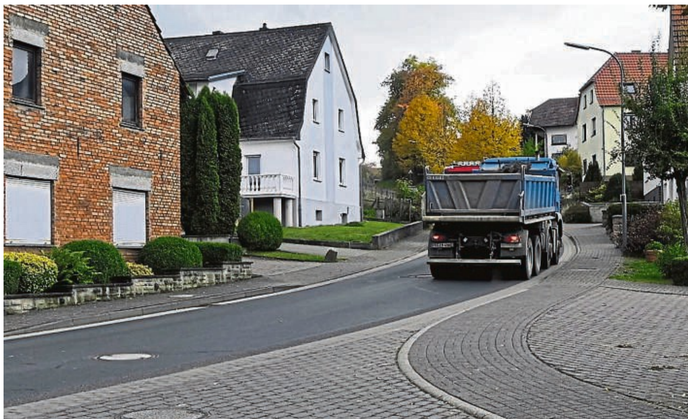
Der Schwerlastverkehr in der Ufhausener Ortsdurchfahrt ist manchen Anliegern ein Dorn im Auge.

Hohe Geschwindigkeit und abgängige Ladung sorgen für Unmut