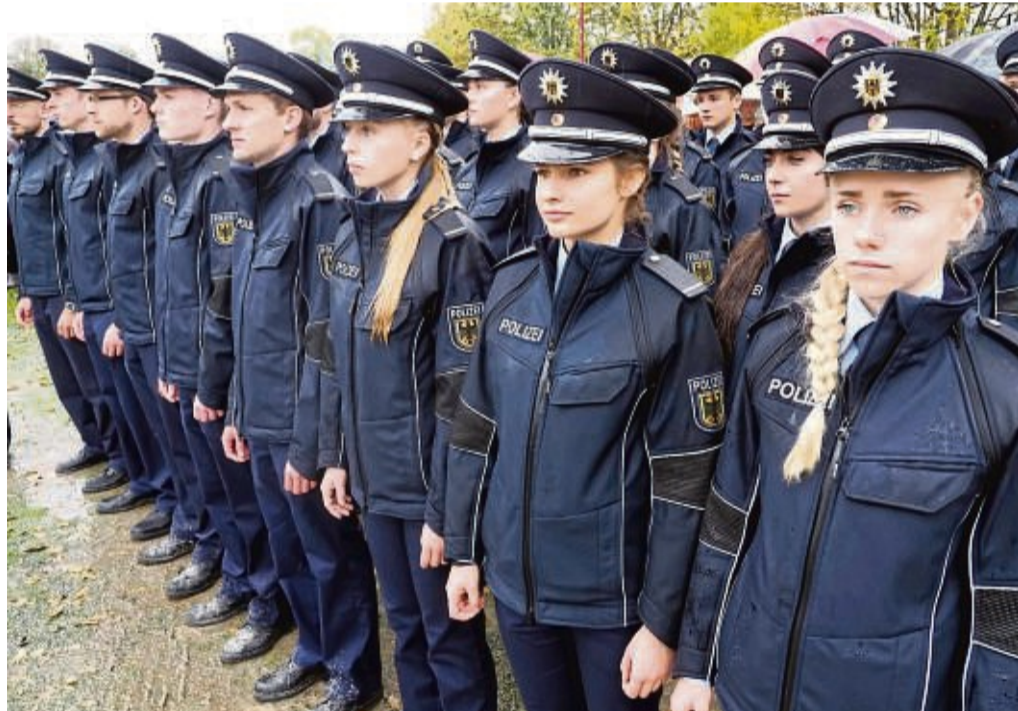
Vereidigung: Vor Familien, Freunden und Gästen legten die Dienstfänger des gehobenen Polizeivollzugsdienstes des Bundespolizeiaus- und -fortbildungszentrums in Eschwege ihren Eid ab.

tig tragen. So wie die Engel Gottes Polizeikräfte seien, die keinen Menschen allein ließen. „Haben Sie immer ihre Kameraden im Auge und seien sie einander Engel“, sagte er. Auch er wurde politisch. Immer mehr Kräfte wollten heute den Staat, das Miteinander der Gesellschaft zerstören. Dies zu verhindern sei Aufgabe der Polizei. Und POR Benjamin Liehr ergänzte: „Nach uns kommt keiner mehr.“ Die Vereidigung wurde musikalisch begleitet von der Blasmusikformation des Bundespolizeiorchesters Berlin und moderiert von Polizeihauptkommissar Ralf Germerodt. kw