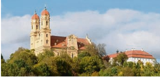
Die prächtige barocke Wallfahrtskirche in Ellwangen ist nur eines von vielen Highlights, das man bei einem Urlaub in Ellwangen entdecken kann.

F F M M P P I I I C C C F F U U K K B S S P D R R A D E S O S D O S A B F O L G E S T O G A N A R A L S E E I B A L A B E N L B U R N D I I D E N H H B E B E L Z J A H R L A U D E R E I A U S S T E L L E N B D A R I N L D E V I S E M A M A I Y A N M E O S I N D O A R S O W V M I S O U R I H H L L E A F A K I R M W I H R E I S O T B I D E T A R E R R E S E T I C I E N P G S E D I K T S K E N S K I N J O E A T A P A J A K N A D E L N Y A K E T C A R S G T H E R A P I E E R E R B I N L U R I N K R I M C T A F T F R A E E B O N G O E U E R H A L T S Z E N E I L A L A I N F B O L U S I N N E H A L T E N K N E I P E N E C K Z A Z K H H H H H H H H H H H H H H H H H N N N N N N N N N N N N N N N N P P P P P P P P P P P P P P P P D D D D D D D D D D D D D D D D I I I I I I I I I I I I I I I I G G G G G G G G G G G G G G G G H H H H H H H H H H H H H H H H O O O O O O O O O O O O O O O O A A A A A A A A A A A A A A A A B B B B B B B B B B B B B B B B S S S S S S S S S S S S S S S S T T T T T T T T T T T T T T T T U U U U U U U U U U U U U U U U V V V V V V V V V V V V V V V V W W W W W W W W W W W W W W W W X X X X X X X X X X X X X X X X Y Y Y Y Y Y Y Y Y Y Y Y Y Y Y Y Z Z Z Z Z Z Z Z Z Z Z Z Z Z Z Z