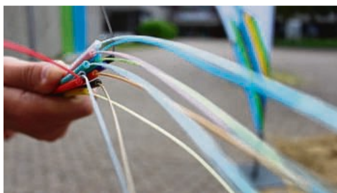
Über diese Lichtleiter können Übertragungsgeschwindigkeiten von einem Gigabit pro Sekunde erreicht werden.

Haben die Kommunen das Heft des Handelns trotzdem weiter in der Hand? Die privaten Anbieter setzen lediglich auf die Kooperationsbereitschaft der Kommunen im Werra-Meißner-Kreis. Die Kommunen haben zwar die Möglichkeit, eine Kooperationsempfehlung auszusprechen – aktiv in den Umsetzungsprozess eingreifen dürfen sie hingegen nicht. Die Kommunen des Kreises haben weiterhin keine Entscheidungsmöglichkeit, über