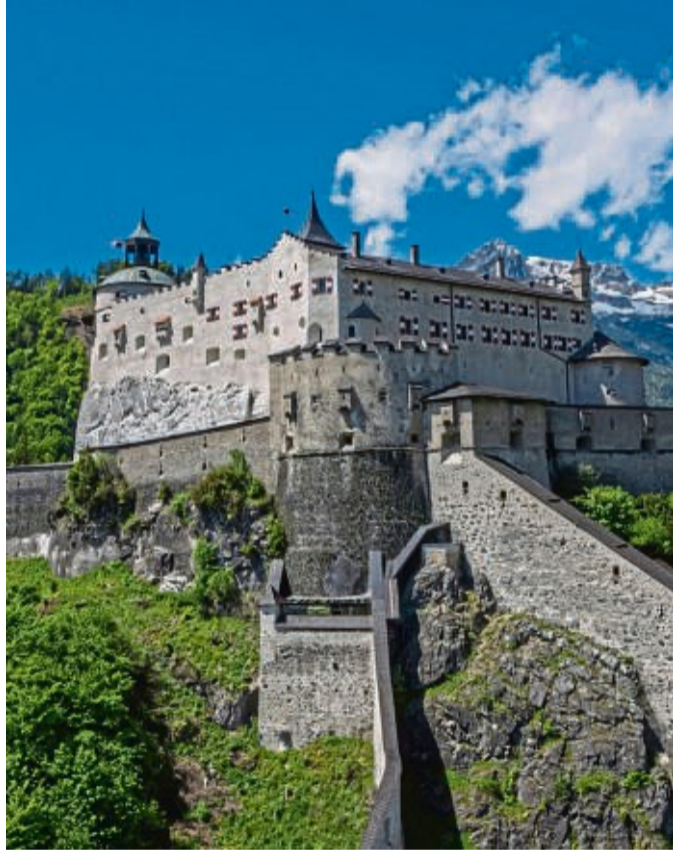
Rund um die Mozartstadt Salzburg gibt es spannende Burgen zu entdecken, die tolle Erlebnisse für die gesamte Familie versprechen.

Tourentipps und detaillierte Beschreibungen sowie Kartenmaterial gibt es unter » ellwangen-tourismus.de