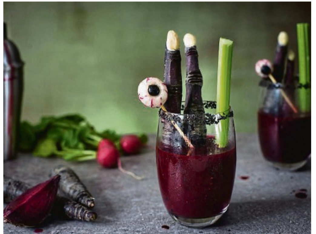
Zum Wohl: Zu Fingern geschnitzte lila Möhren und Glubschaugen aus Radieschen und Blaubeeren geben der Bloody Mary einen schaurig-schönen Touch.

Bloody Mary mit Halloween-Finger und Glubschaug