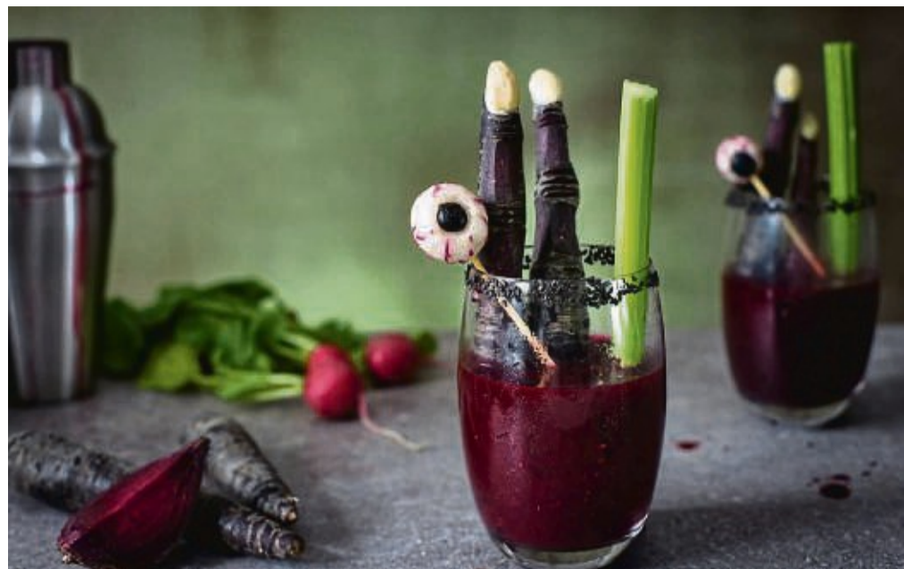
Zum Wohl: Zu Fingern geschnittene lila Möhren und Glubschauge aus Radieschen und Blaubeeren geben der Bloody Mary einen schaurig-schönen Touch.

Mit einem scharfen Messer einen Nagel herausschneiden. Für die Gelenkfalten 2 cm unter dem Nagel 3 dünne Falten herausschneiden. 5 cm unter diesen Falten weitere 4 dickere Falten herausschneiden. Zwischen Nagel und den oberen Falten die Möhren schälen, damit diese dünner werden. Das Gleiche zwischen den oberen und unteren Falten wiederholen.