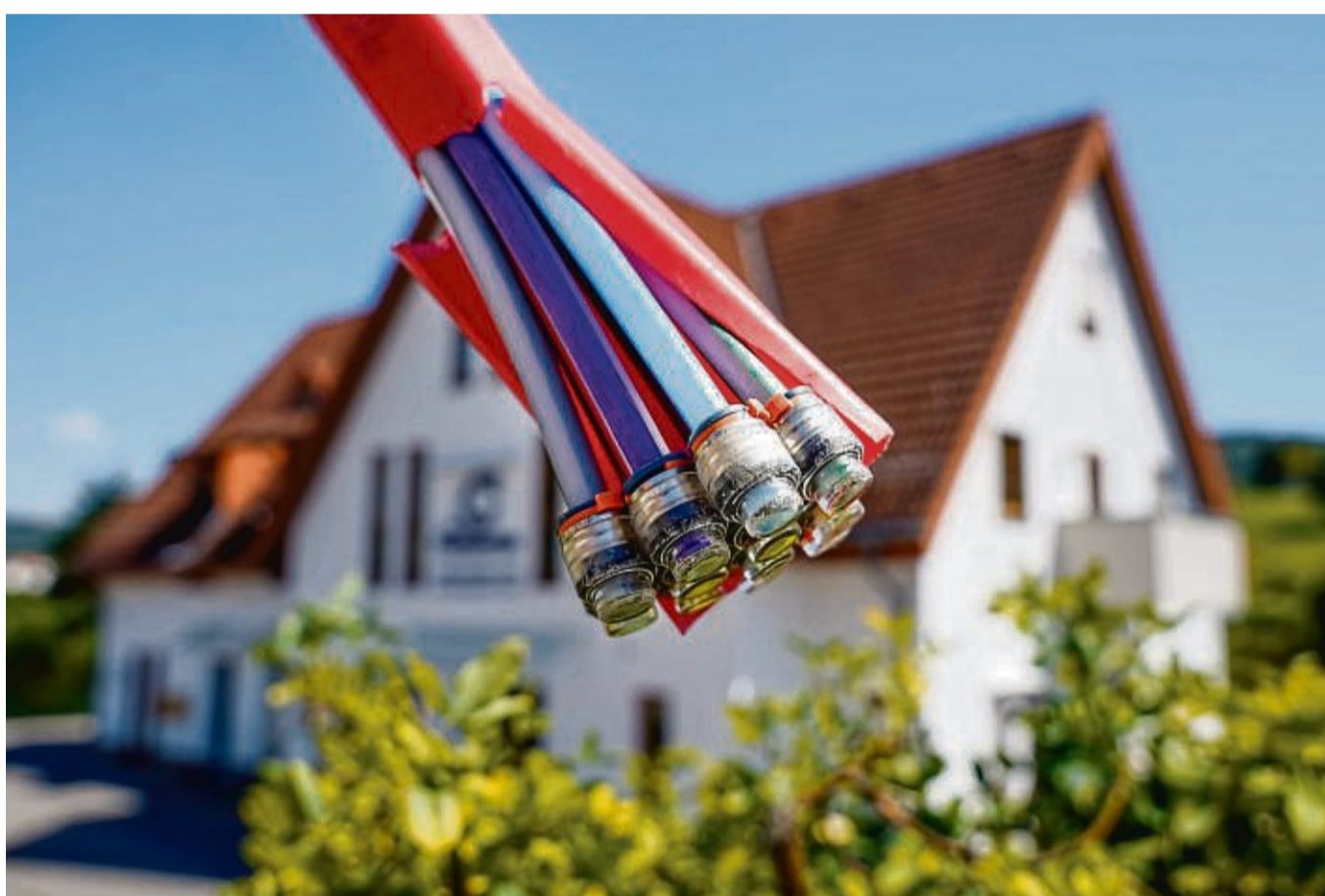
Bald schnelles Internet möglich: Die Bürger in Witzenhausen sind gefragt.

Witzenhausen – Langsames Internet könnte in Witzenhausen schon bald der Vergangenheit angehören. Dafür ist jetzt die Bereitschaft der Bürger in den Stadtteilen von Witzenhausen erforderlich. Wir erklären mit dem Kommunikationsunternehmen