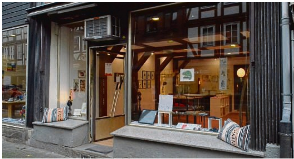
Der Laden an der Langen Straßen von außen. Noch bis zum März 2023 läuft das Projekt „Laden auf Zeit“ in Hann. Münden weiter.

Während der Testphase sind die Werkstücke von sechs weiteren Kunsthandwerkern in der Pop-up-Galerie zu finden: Schmuck von