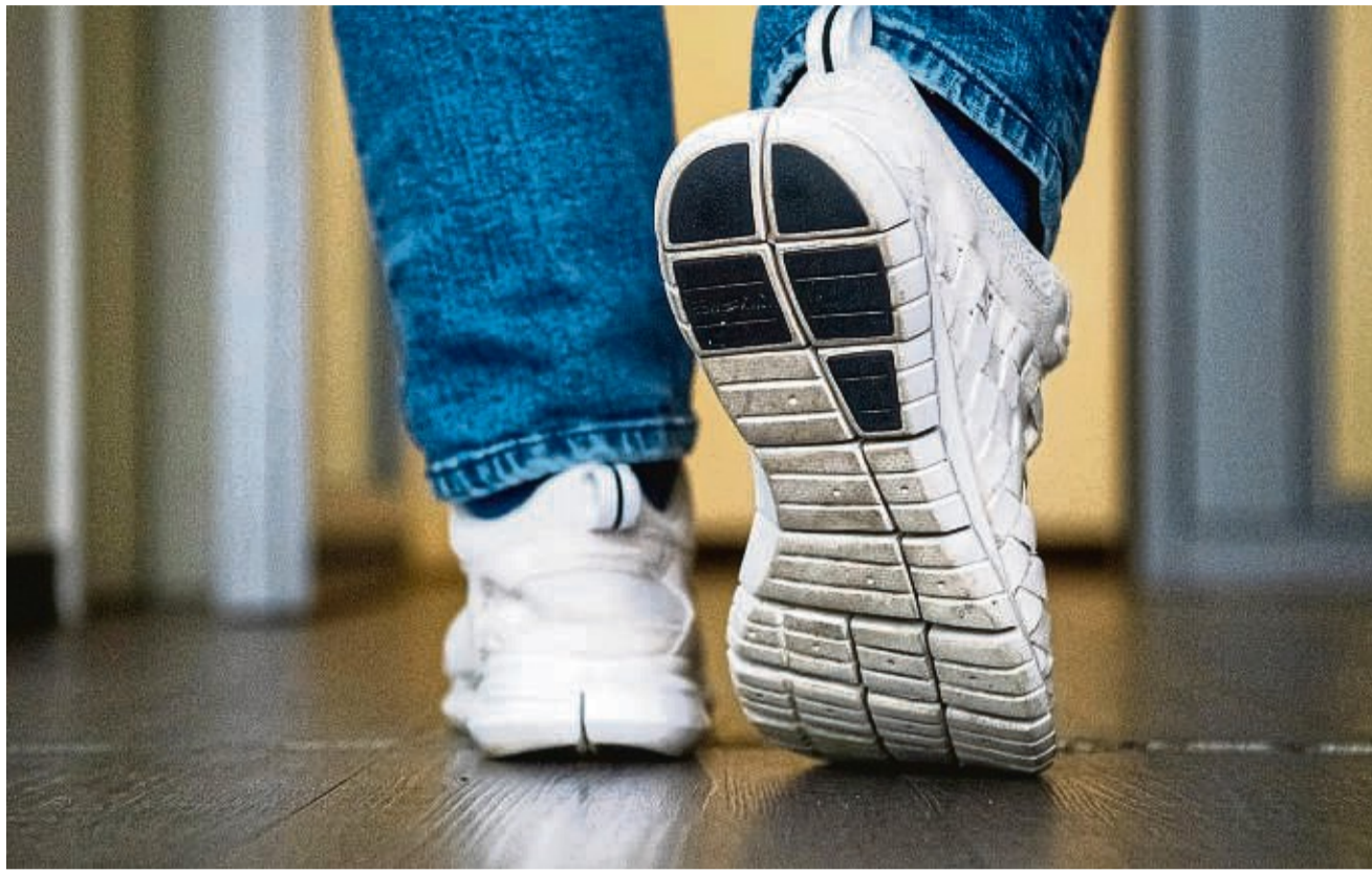
Läuft man mit einer weichen Kunststoffsohle über einen harten Boden, quietscht es ganz besonders schnell. Schuld ist die Reibung, die zwischen den beiden Materialien entsteht.