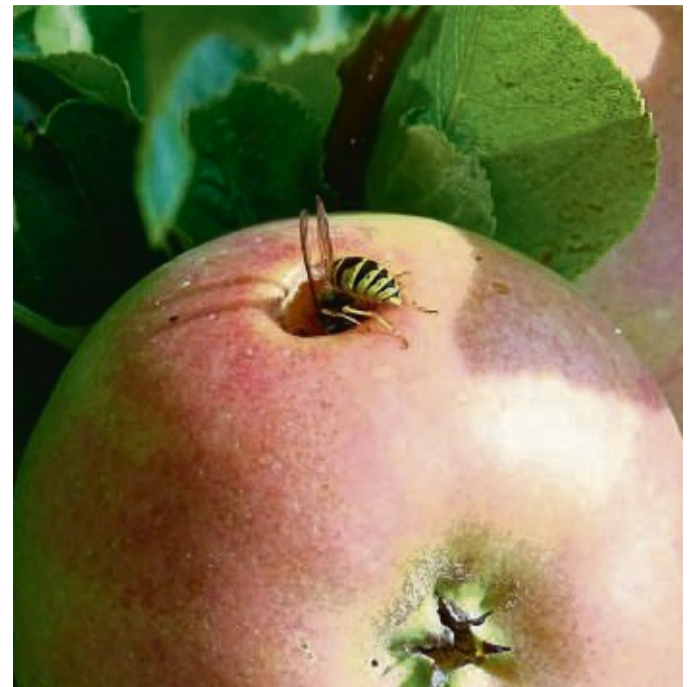
Reichlich Wespen gab es in diesem Jahr, die es auch auf die süßen Äpfel abgesehen hatten.

Antiquitäten, Kunsttrödel & Spielzeug Tel: 0561-498835 Tierliebe Person in Witzenhausen dringend gesucht für „Gassi gehen“ Tel. 0152 31777590