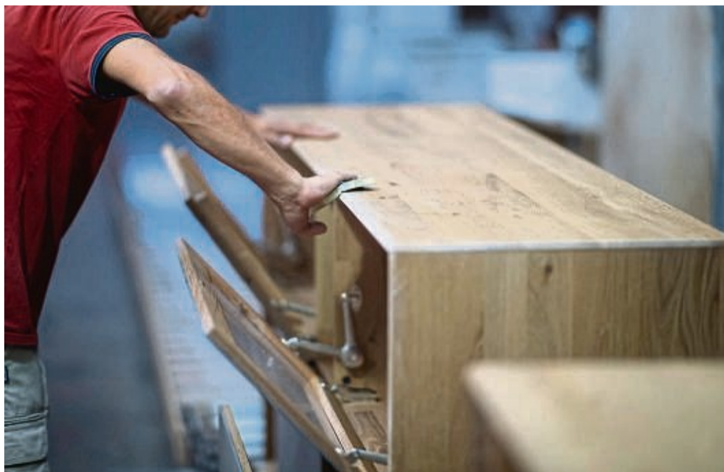
Wer Massivholzmöbel von kunststoffbeschichteten Möbelstücken unterscheiden möchte, muss oft genauer hingucken - etwa auf die Stirnholzseite. An ihr zeigen sich die Wachstumsringe des Baumes als kreisförmige Jahresringe.

Denn bei Massivholzmöbeln lässt sich an zwei von vier Kanten Stirnholz finden, so die Initiative Massivholz. Das sind die Seiten eines Holzstückes, die jeweils die natürlichen Wachstumsringe des Baumes als kreisförmige