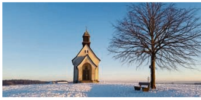
Die verschneite Landschaft rund um den Bodensee lädt zu Winterwanderungen ein.