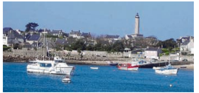
Bei Besuchen in der Partnerstadt Cléder immer ein Ziel: Die Île de Batz mit ihrem markanten Leuchtturm.