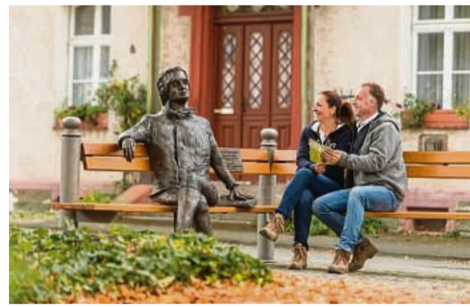
Auf dem Wetzlarer Goetheweg begegnet einem der Dichter als lebensgroße Statue.

Lange Spaziergänge mit Blick auf die Alpenkette, danach in die Kerzensauna oder zur Lebenselixier-Massage: Winterwandern und Thermenbesuche lassen sich rund um den Bodensee ganz bequem kombinieren. Neue Kraft tanken können Erholungssuchende aber auch in einem der zahlreichen Museen oder bei einem regionalen Schlemmermenü. Und während die Schiffe auf dem Bodensee das ganze Jahr Fahrt aufnehmen, können Alltagsgestresste mit Blick auf die weite Wasserfläche ihre Geschwindigkeit drosseln und entspannen. Unter www.bodenseewinter.de gibt es mehr Informationen und Inspirationen sowie eine Vielzahl an winterlichen Übernachtungsangeboten.