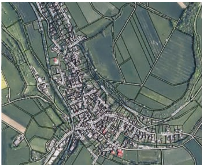
Wartungsarbeiten: Auch in Ulfen kann das Wasser am 10. November knapp werden.