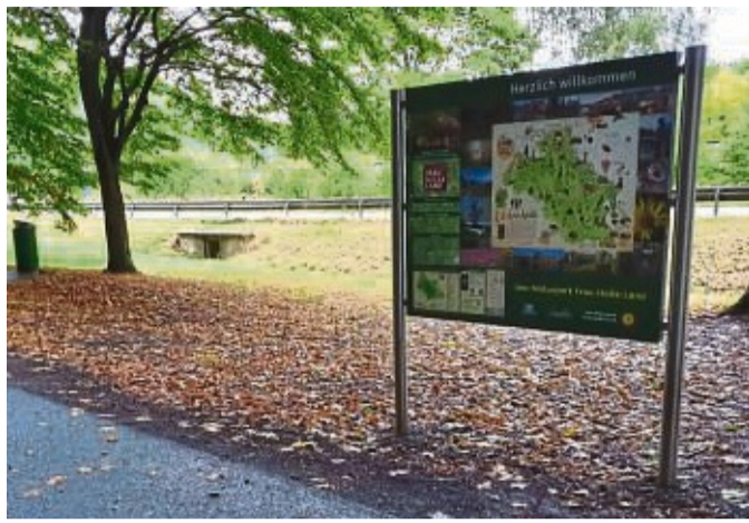
Die neue Informationstafel des Geo-Naturparks am Rastplatz bei Albugen.

An insgesamt acht Standorten im Bereich zwischen Sontra und Hebenshausen (Neu-Eichenberg) wurden nicht nur die Inhalte der Tafeln aktualisiert, sondern auch die Rahmen erneuert, vereinheitlicht und ertüchtigt. Auf den jeweiligen Rast- und