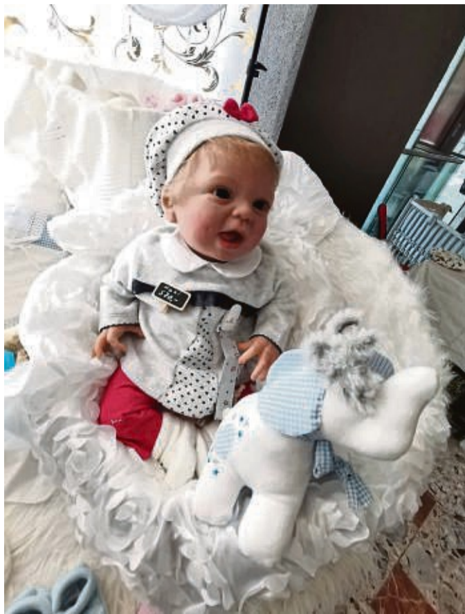
Die Puppenfesttage finden in Eschwege am 5. und 6. November statt.

Die Puppenfesttage sind international beliebt: Aussteller aus Österreich, Spanien, der Schweiz und den Niederlanden sind seit Jahren dabei. Feinste Antikreproduktionen und weltberühmte Puppen seien mit von der Partie, und wer selbst Puppen macht, findet hier alles, was dafür gebraucht wird: Puppenschuhe, Puppenaugen, Puppenmode