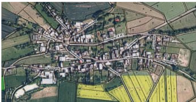
Vorrat an Trinkwasser anlegen: Am 10. November wird in Mitterode die Trinkwasserhauptleitung gewartet.