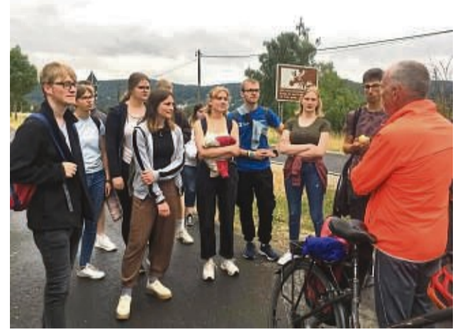
Hatten einen interessanten Tag: Schüler der Adam-von-Trott-Schule.

Angekommen in der eigentlichen Ausstellung des