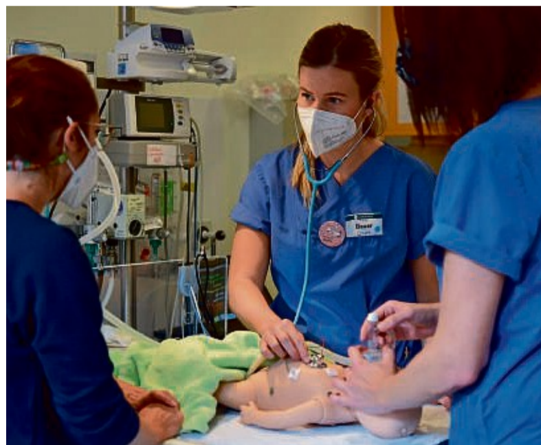
Im Teamtraining wurden alle im Kreißsaal tätigen Ärzte, Pflegekräfte und Hebammen optimal auf Notfallsituationen während der Geburt vorbereitet.

Fakt ist, um im Notfall optimal agieren zu können, müssen alle Beschäftigten im Kreißsaal in der Lage sein, eine Gefährdung von Mutter oder Kind zu erkennen und sicher zu beherrschen. Bei den inhouse durchgeführten S.A.V.E. Teamtrainings werden geburtshilfliche Notfälle wie zum Beispiel eine Blutungskomplikation oder eine Neugeborenenreanimation mit den bestehenden Teams in realer Arbeits-