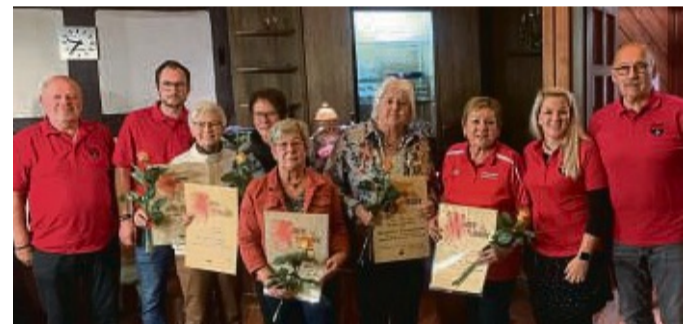
Der geschäftsführende Vorstand und die geehrten Mitglieder.