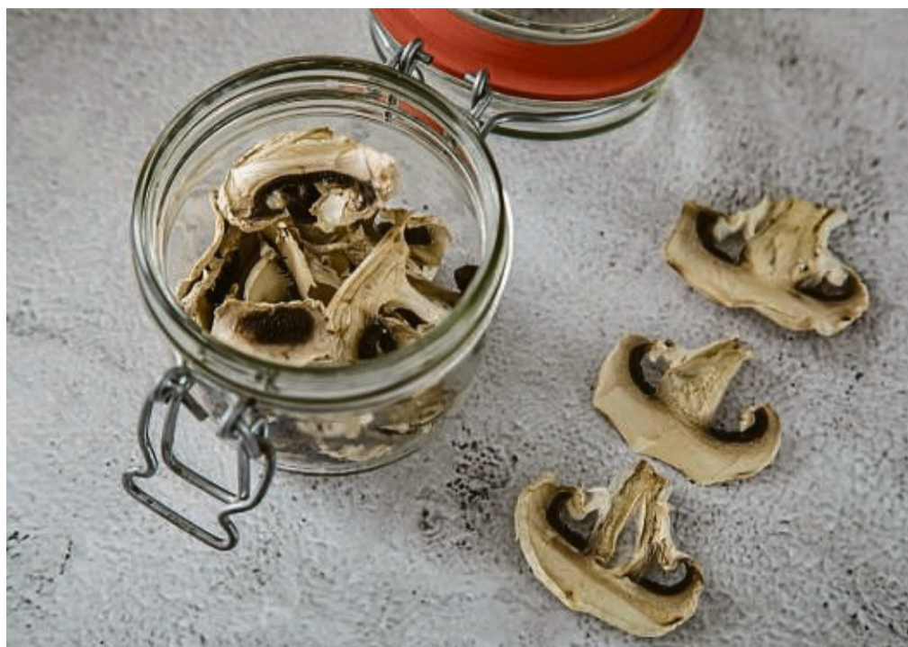
Getrocknete Pilze bewahrt man am besten in einem fest verschließbaren Glas auf.