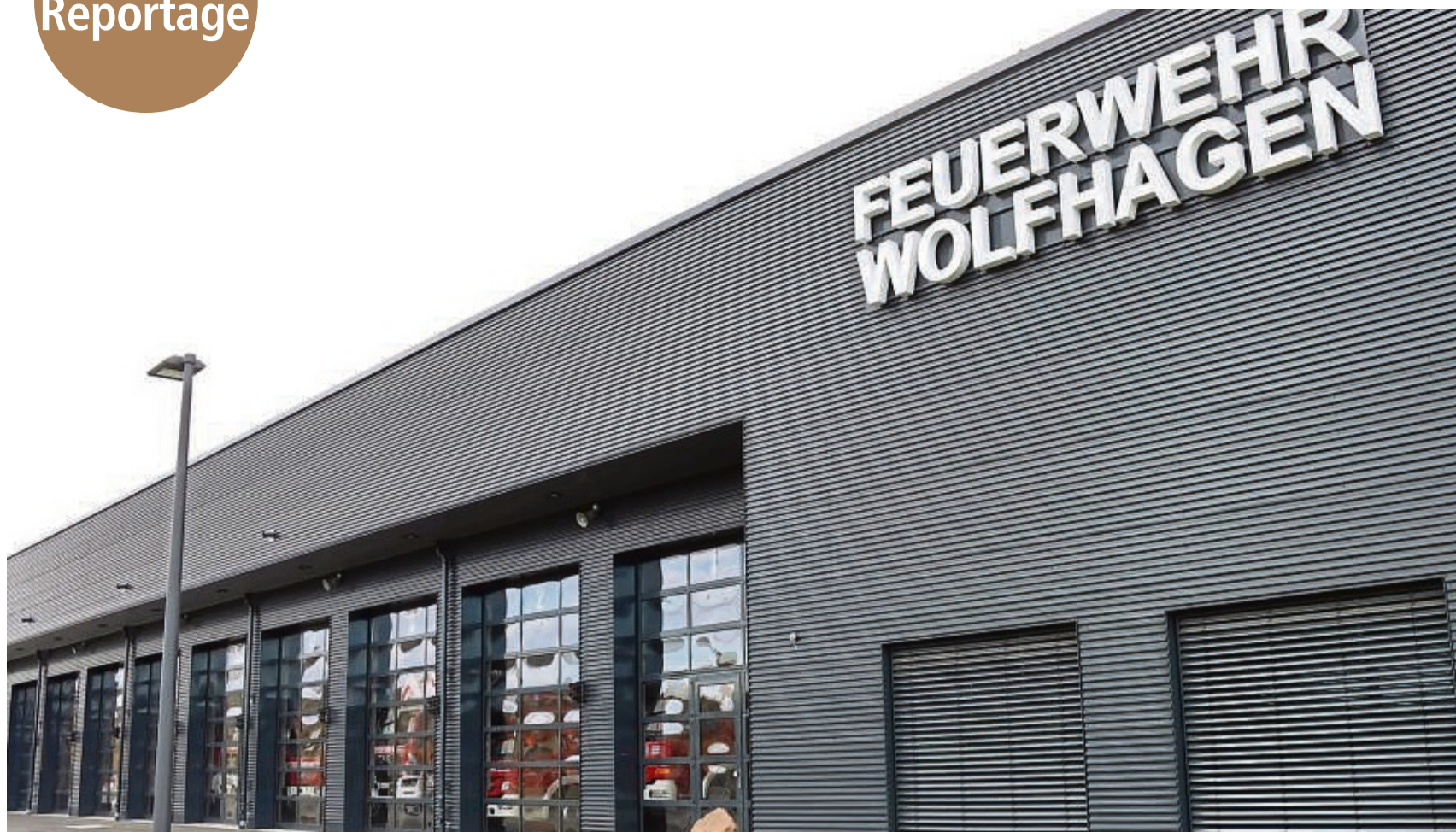
Auf modernstem Stand: Der Stützpunkt der Wolfhager Feuerwehr wurde dafür ausgelegt, dass er auch in Zukunft den Ansprüchen der Wehr entspricht.