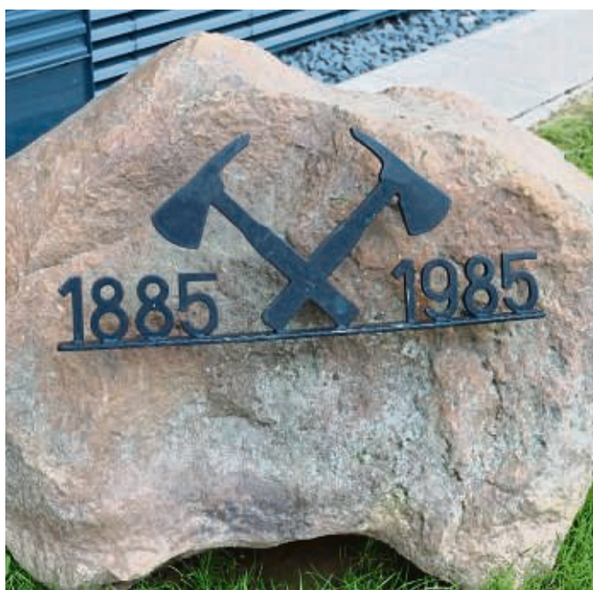
Erinnerung: Der bearbeitete Findling erinnert an das 100-jährige Jubiläum der Feuerwehr Wolfhagen im Jahr 1985. Selbstverständlich zog er mit an den neuen Standort um.