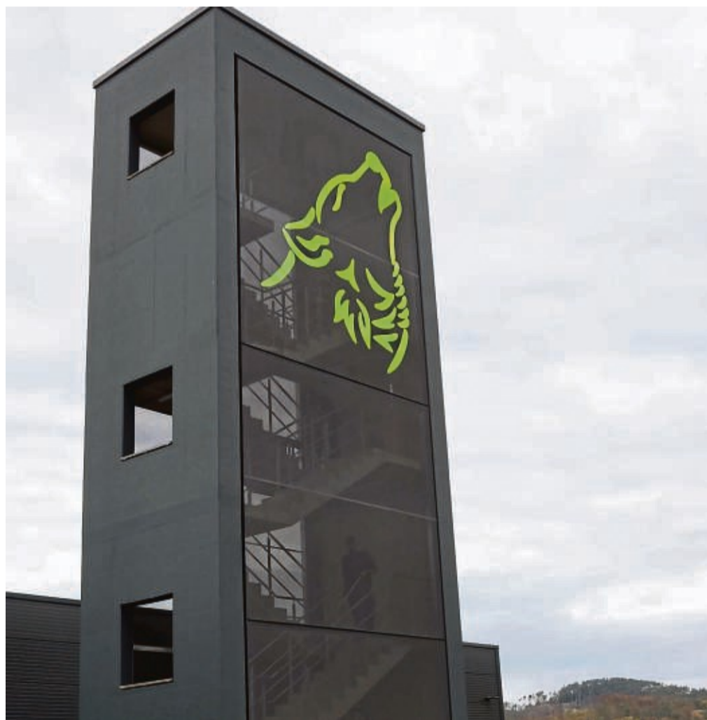
Hoch hinaus: Als Feuerwehrmann muss man fit sein. Das macht die Höhe des Übungsturms deutlich, der passend zum Standort das Wolfs-Logo trägt.