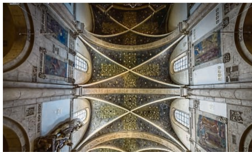
Die Weidener Pfarrkirche St. Josef ist ein sakrales Gesamtkunstwerk aus dem Jugendstil.

Auf Spaziergängen können Architektur- liebhaber nicht nur die schicke Altstadt kennenlernen, sondern auch Wohnhäuser mit prächtig ornamentierten Jugendstil-Fassaden entdecken und in der Pfarrkirche St. Josef in ein Gesamtkunstwerk der Art Nouveau eintauchen. Unter www.weiden-tourismus.info gibt es weitere Informationen zu Sehenswürdigkeiten und Themenführungen.