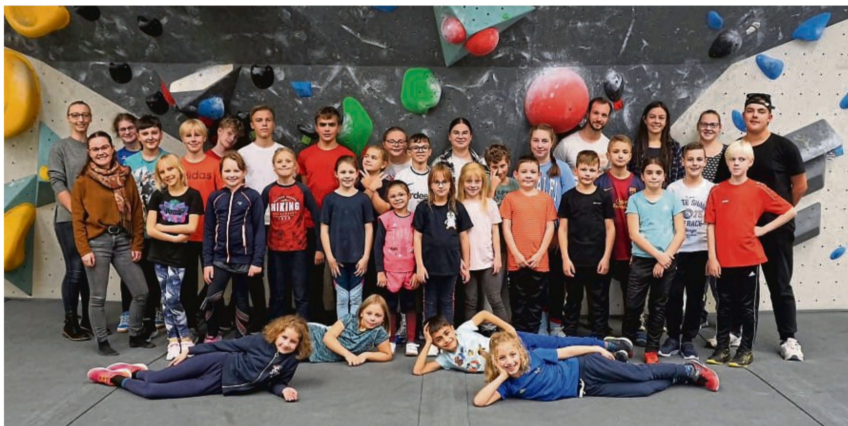
Für die Kinder und Jugendlichen ging es in den Herbstferien mit der Haspel ins Kletterzentrum Nordhessen.