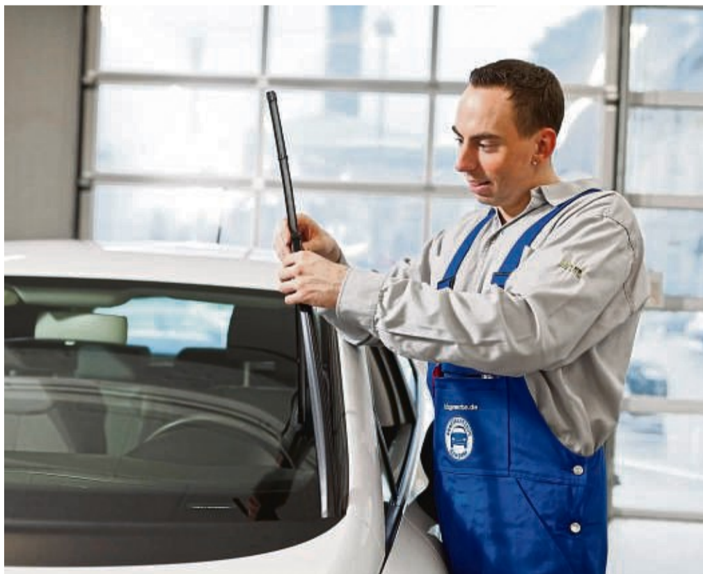
Schmieren die Wischblätter oder lassen ganze Flächen ungewischt, ist ein Austausch fällig.

Der nächste Punkt: genügend Frostschutz. Im Kühlwasser ist er das ganze Jahr obligatorisch, denn Frostschutz ist auch Rostschutz. Wer sich nicht sicher ist, wieviel Minusgrade sein Kühlmittel verträgt, sollte es jetzt in seiner Werkstatt prüfen