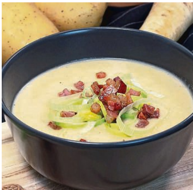
Die Kartoffelsuppe mit Spekulatiuscreme wird mit knusprigem Würfelspeck getoppt.

Wer hingegen einen Eintopf mit ganzen Stücken auf-tischen möchte, sollte zu vorwiegend festkochenden Kartoffeln greifen. Sie enthalten etwas weniger Stärke und behalten ihre festere Konsistenz, wenn sie einmal etwas länger gekocht werden, so Tepel. Was muss in eine leckere Kartoffelsuppe oder einen -