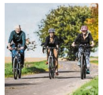
Der Werra-Eltetal-Radweg wird von den Nutzern hoch gelobt.