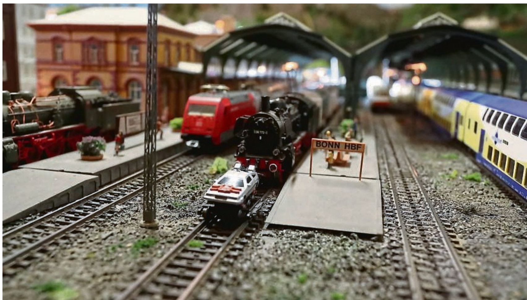
Geht an diesem Wochenende weiter: Die Ausstellung des Modelleisenbahnclubs Witzhausen im Nordbahnhof lässt kleine und große Augen strahlen.