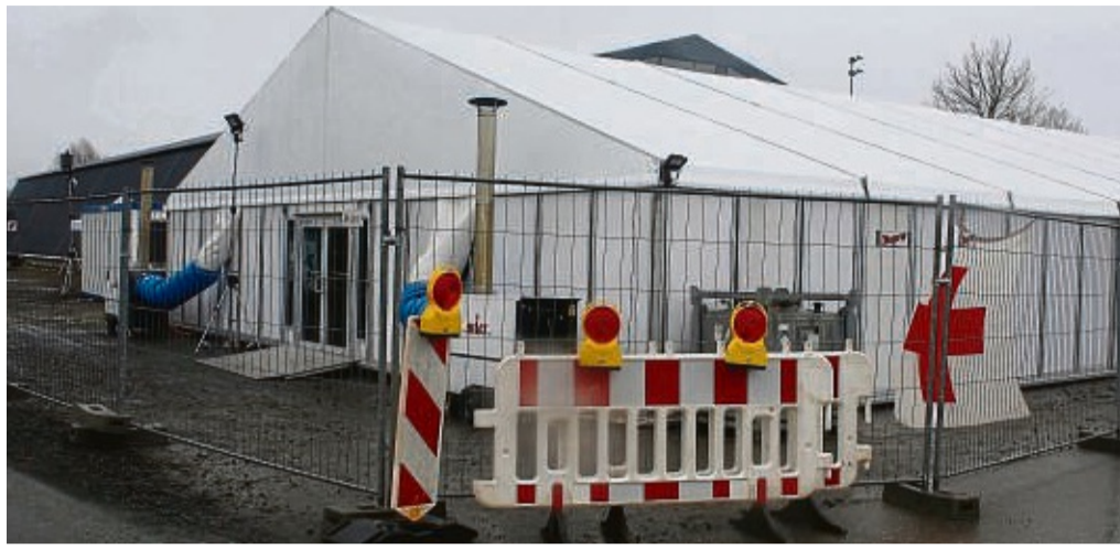
Die Mehrzweckhalle in Allendorf/Eder (im Hintergrund) ist seit Frühjahr Flüchtlingsunterkunft und durch Zelte erweitert worden.

Bis Jahresende soll Waldeck-Frankenberg zusätzlich zu den Kriegsflüchtlingen aus der Ukraine rund 420 Menschen aus Vorderasien und Nordafrika aufnehmen. An der Unterbringung beteiligt der Kreis auch die 22 Städte und Gemeinden. Der Landrat fasste in einem Pressegespräch die Probleme zusammen: „Wir sind mit Hochdruck dabei, Wohnraum zu akquirieren, aber die Kapazitäten auf dem Wohnungsmarkt sind nahezu erschöpft“, sagt der Landrat. In Gemeinschaftsunterkünften des Kreises würden auch noch Flüchtlinge wohnen, die eigentlich schon in reguläre Wohnungen umziehen sollten, doch die fehlten.