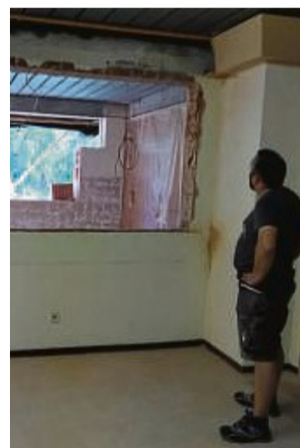
Während der Arbeiten: Theke und Küche sind ausgebaut.

che im Mauerwerk und tauschten Fehlstellen im Fliesenboden aus. Schließlich brachten sie Sockelleisten und Fußleisten in den Räumen an. Sie bauten alte Türen und die Falttüren aus, stellten neue Ständerwände in Trockenbauweise auf, bauten die Deckenabhängungen und Verkleidungen aus. Räume und Decken im Flur bekamen einen zweifachen Anstrich. Fachkundige Wirmighäuser übernahmen zudem Installationsarbeiten. Draußen gingen die Arbeiten weiter. Die Holzverschä-