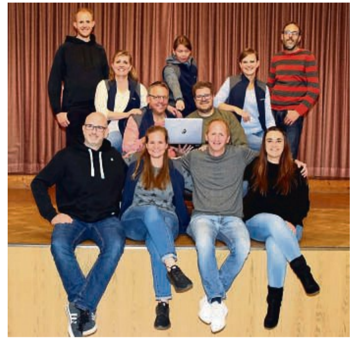
Die Kolping-Theatergruppe Medebach zeigt „Liebe, Frust und Schwiegermütter“.