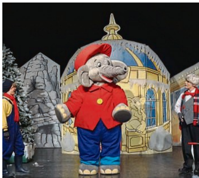
Das Geheimnis um ein neues Zootier will der Elefant Benjamin Blümchen bei seinem Gastspiel am Montag, 21. November, in der Korbacher Stadthalle lösen.

Karten gibt es in der Korbach-Info , Prof.-Bier-Straße 15, oder online unter korbach.reservix.de . Sie kosten im Vorverkauf 9 bis 13 Euro (Tageskasse 12 bis 16 Euro).