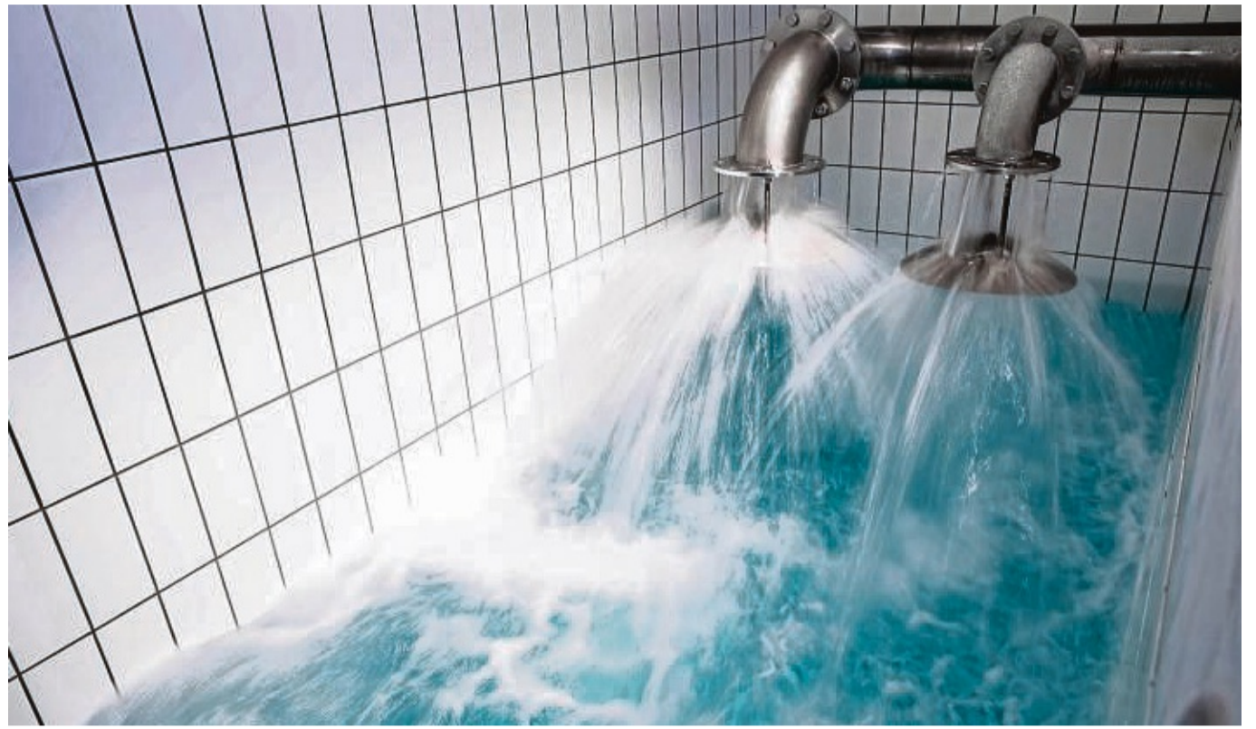
Wichtigstes Lebensmittel: Wasser in einer Wildunger Versorgungsanlage.

Der Nutzen für die Trinkwasserversorgung falle begrenzt aus, da Albertshausen an das Reinhardshäuser Netz