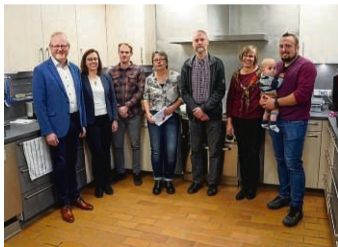
In der neuen Küche: Baubeteiligte freuten sich beim Oktoberfest über den Abschluss der Arbeiten.