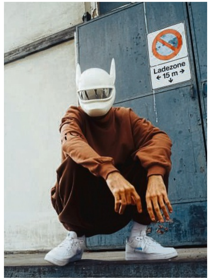
Seine neue Tour führt Cro am 4. August 2023 an den Fuß des Ettelsbergs.

Die Songs kreisen um dieses „schönste aller Gefühle“ und versuchen immer wieder, es auf den Punkt zu bringen, und in Text und Töne zu transportieren.