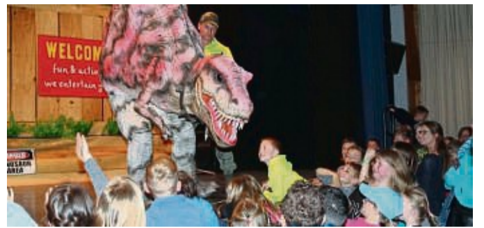
Die Dino Live Show gastiert am Sonntag, 20. November, in der Stadthalle in Korbach.

Die Besucher können die Dinosaurier hautnah erleben, von der Geburt eines Dino-Babys das live auf der Bühne aus einem gigantischen Ei schlüpft, bis hin zum größten Räuber dieser Zeit, dem T-Rex