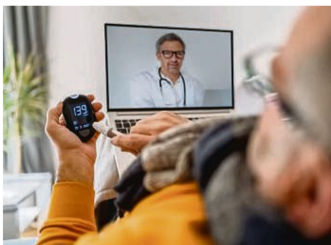
Am 13. und 14. November gibt es Fachvorträge und Webinare rund um das Leben mit Diabetes Typ1 oder Typ2.

Schmerzen, Missempfindungen wie „Kribbeln“ auf der Haut, Wadenkrämpfe, Muskelschwäche oder Taub-