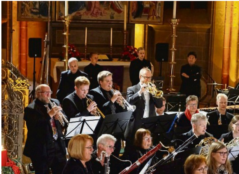
Zum vorweihnachtlichen Konzert lädt das Sinfonische Blasorchester Korbach/Lelbach am 26. November in die Nikolaikirche Korbach ein.