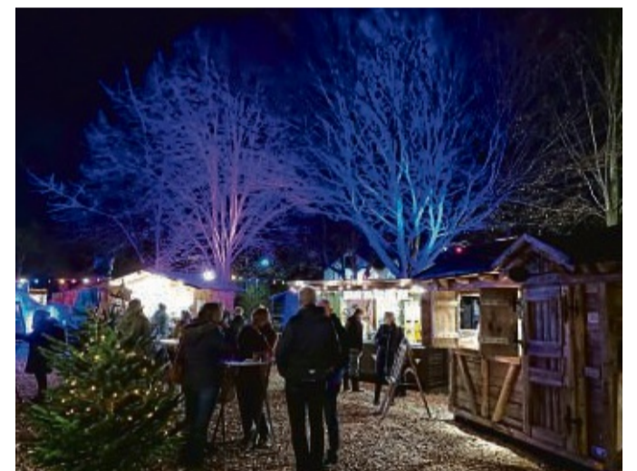
Am ersten undvierten Adventswochenende öffnet der Wintermarkt erneut seine Pforten in Braach.