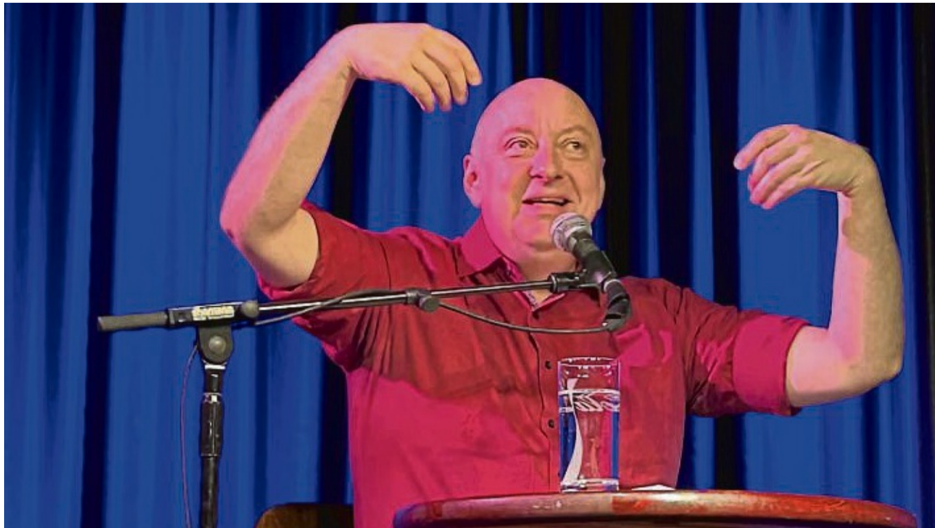
Kabarettist Horst Evers begeisterte am Donnerstagabend mit einem feinen Sinn für den Humor des Alltags. Sein Auftritt war ein Erfolg für das Buchcafé-Team.