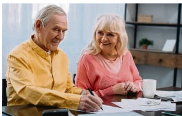
Offen und rechtzeitig zu besprechen, was im Todesfall passieren soll, ist wichtig und hilfreich.

Das Ergebnis einer Studie: Noch immer braucht das Thema Sterbefall-Vorsorge einen externen Anstoß. Wie wichtig die Regelungen im Voraus sind, erleben Menschen oft erst konkret durch die persönliche Erfahrung, etwa durch Durchleben eines Trauerfalls oder die Begleitung einer schweren Erkrankung im eigenen Umfeld. Denn dann merken sie: