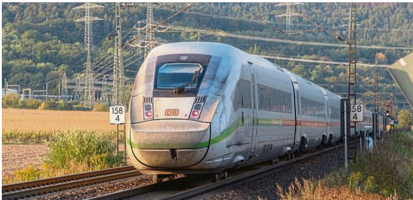
Das Beteiligungsforum im Landkreis Hersfeld-Rotenburg debattiert aktuell über den weiteren Fortgang der geplanten Bahnstrecke Fulda-Gerstungen.