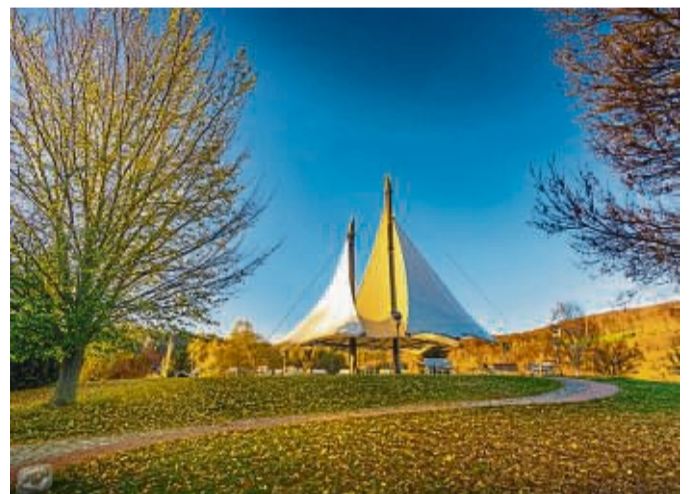
Das Sonnensegel im Kurpark: Dort, wo einst Schachttürme Uran förderten, kann heute die Aussicht auf die Erzgebirgslandschaft genossen werden.

gibt es Kartenmaterial, Bilder und Videoclips. Die App ist Teil des digitalen Projektes „Frankfurt und der Nationalsozialismus“, an dem neben dem Historischen Museum auch das Jüdische Museum und das Institut für Stadtgeschichte beteiligt sind. Die App steht bisher für iOS-Geräte zur Verfügung, eine Android-Version soll folgen.