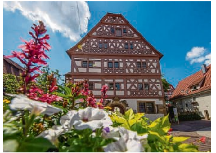
Das Stadtmuseum Hornmoldhaus beherbergt die stadthistorische Sammlung der Stadt Bietigheim-Bissingen.