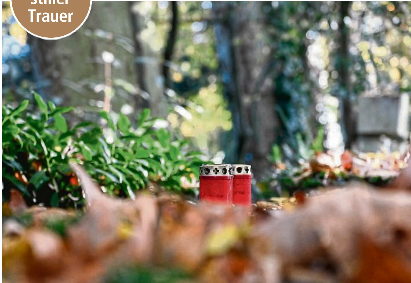
An Allerheiligen gedenken die Katholiken der Verstorbenen. Ursprünglich war der 1. November jedoch kein Tag des Totengedenkens, sondern ein österliches Fest, an dem sich die Kirche der unbekanntenen Heiligen erinnerte.