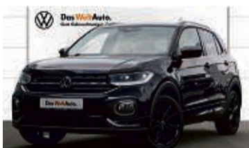
T-CROSS 1.5 TSI DSG STYLE R-LINE

10.556 km | EZ: 12/2021 | 110 kW/150 PS Farbe: Deep Black Perleffekt Designpaket „Dark Denim“, Keyless Access, virtuelles Cockpit, Navi, Klima, Rückfahrkamera, LMR 18", LED-Scheinwerfer, 300W beatsAudio-Sound, Sitzheizung uvm.