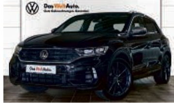
T-ROC R 2.0 TSI DSG 4MOTION

4.774 km | EZ: 06/2021 | 221 kW/300 PS Farbe: Deep Black Perleffekt Leder Nappa, Performance-Abgasanlage, Rückfahrkamera, 300W Sound, DCC, induktive Ladefunktion, elektr. Heckklappe, Panoramadach, LMR 19", LED-Scheinwerfer, virtuelles Cockpit uvm.