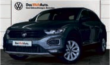
T-ROC 1.5 TSI 6-GANG SPORT

21.654 km | EZ: 05/2021 | 110 kW/150 PS Farbe: Indiumgrau Metallic Elektrische Heckklappe, Sportfahrwerk, Anhängerkupplung, LED-Scheinwerfer, Einparkhilfe vorn/hinten, virtuelles Cockpit, Navi, Sitzheizung, LMR 17", LED-Rückleuchten uvm.