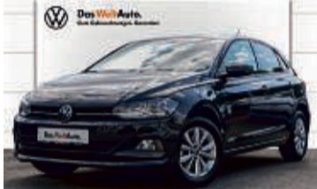
POLO 1.0 TSI 6-GANG HIGHLINE

21.549 km | EZ: 07/2021 | 81 kW/110 PS Farbe: Uranograu Ambientlicht, Berganfahrassistent, Einparkhilfe vorn/hinten, LMR 15", LED-Heckleuchten, Sitzheizung, virtuelles Cockpit, 2-Zonen-Klima, Navi, USB-C-Anschlüsse, Sportsitze uvm.