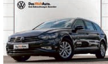
PASSAT VARIANT 1.5 TSI 6-GANG BUSINESS

10.813 km | EZ: 03/2021 | 110 kW/150 PS Farbe: Mangangrau Metallic App Connect, Rückfahrkamera, Navi, LED-Scheinwerfer, Klima, DAB+, ACC, Einparkhilfe vorn/hinten, Sitzheizung, Keyless Start, ergoActive-Sitz, induktive Ladefunktion uvm.