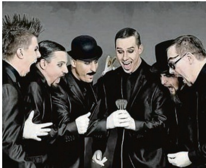
RMC Rammstein Tribute Show: Die Band spielt am 29. April in der Festhalle Battenberg.

Vorgruppe wird a Tribute to Green Day. Bereits seit En-