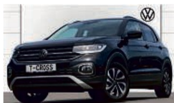
T-CROSS 1.0 TSI 6-GANG ACTIVE

2.321 km | EZ: 10/2021 | 81 kW/110 PS Farbe: Deep Black Perleffekt Anhängerkupplung schwenkbar, DAB+, Ambientlicht, Einparkhilfe vorn/hinten, Navi, virtuelles Cockpit, Sitzheizung, Klima, LED-Rückleuchten, LMR 16", induktive Ladefunktion uvm.