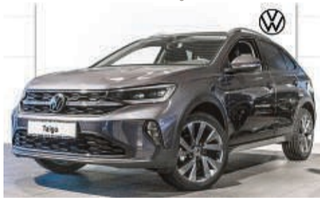
TAIGO 1.0 TSI 6-GANG STYLE

Leistung: 81 kW/ 110 PS, Benzin Farbe: Rauchgrau Metallic Kraftstoffverbrauch in l/100 km, kombiniert 4,9 l; innerorts 6,0 l; außerorts 4,2 l. CO 2 -Emissionen kombiniert 116 g/km. Effizienzklasse: B.