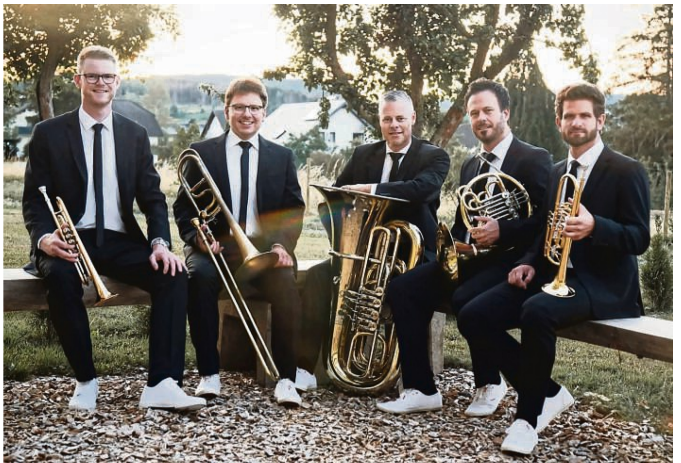
Das Quintett „BRASSination“ aus dem Sauerland ist am 1. Advent im Rittersaal von Burg Lichtenfels zu hören. Auf dem Programm stehen deutsche und internationale Adventslieder vieler Genres.