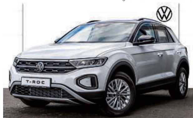
T-ROC 1.5 TSI 6-GANG LIFE

Leistung: 110 kW/ 150 PS, Benzin Farbe: Pure White Kraftstoffverbrauch in l/100 km, kombiniert 5,2 l; innerorts 6,2 l; außerorts 4,7 l. CO 2 -Emissionen kombiniert 123 g/km. Effizienzklasse: B.