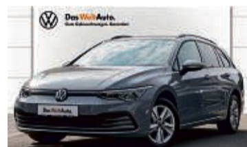
GOLF VARIANT 1.0 TSI 6-GANG LIFE

8.011 km | EZ: 08/2021 | 81 kW/110 PS Farbe: Mondsteingrau LED-Scheinwerfer, LMR 16", virtuelles Cockpit, Winter-Paket, Einparkhilfe vorn/hinten, Sitzheizung, Spurhalteassistent, Keyless Access, DAB+, Bluetooth-Freisprechanlage uvm.