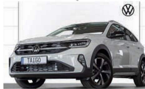
TAIGO 1.5 TSI DSG STYLE

Leistung: 110 kW/ 150 PS, Benzin Farbe: Ascotgrau / Deep Black Kraftstoffverbrauch in l/100 km, kombiniert 5,1 l; innerorts 6,4 l; außerorts 4,3 l. CO 2 -Emissionen kombiniert 121 g/km. Effizienzklasse: B.