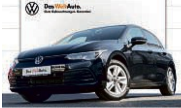
GOLF 1.5 TSI 6-GANG LIFE

6.371 km | EZ: 09/2020 | 110 kW/150 PS Farbe: Deep Black Perleffekt App Connect, Panoramadach, Navi, Einparkhilfe vorn/hinten, Keyless Access, Standheizung, Sitzheizung vorn/hinten, LED-Scheinwerfer, LMR 16", ACC, DAB+, Sprachsteuerung uvm.