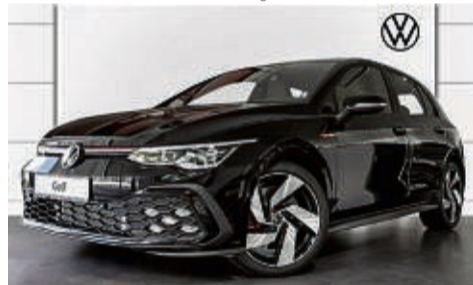
GOLF GTI 2.0 TSI DSG

Leistung: 180 kW/ 245 PS, Benzin Farbe: Deep Black Perleffekt Kraftstoffverbrauch in l/100 km, kombiniert 6,5 l; innerorts 8,6 l; außerorts 5,3 l. CO 2 -Emissionen kombiniert 154 g/km. Effizienzklasse: C.