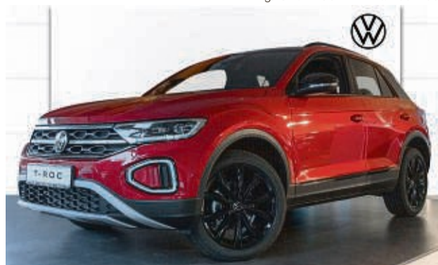
T-ROC 1.5 TSI DSG BLACK STYLE

Leistung: 110 kW/ 150 PS, Benzin, Farbe: Kings Red Met. Kraftstoffverbrauch nach WLTP in l/100 km, kombiniert 6,4 l; innerstädtisch 8,0 l; Stadtrand 6,1 l. Landstraße 5,6 l; Autobahn 6,7 l. CO 2 -Emissionen kombiniert 144 g/km. Effizienzklasse: B.