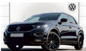
T-ROC 2.0 TDI DSG SPORT

26.260 km | EZ: 06/2020 | 110 kW/150 PS Farbe: Kings Deep Black Perleffekt Anhängerkupplung, App Connect, DCC, elektr. Heckklappe, Navi, Klima, Rückfahrkamera, Panoramadach, LED-Scheinwerfer, LMR 19", induktive Ladefunktion, DAB+ uvm.