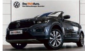
T-ROC CABRIO 1.5 TSI DSG STYLE

23.115 km | EZ: 11/2020 | 110 kW/150 PS Farbe: Rauchgrau Metallic Keyless Access, virtuelles Cockpit, Rückfahrkamera, Einparkhilfe vorn/hinten, induktive Ladefunktion, LMR 17", LED-Scheinwerfer, Sitzheizung, 400W beatsAudio-Soundsystem uvm.