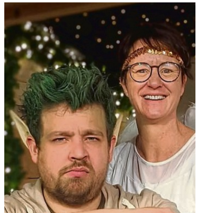
Das Statt-Theater Mengeringhausen präsentiert ab 26. November „Als der Weihnachtsmann vom Himmel fiel“, einen Klassiker von Cornelia Funke.

füllen. Das sieht der fiese Waldemar Wichtelod ganz anders. Er ist nur darauf aus, Eltern das Geld aus der Tasche zu ziehen und versucht mit allen Mitteln, gegen Julebukk ein. Der Theaterfassung liegt das Buch von Cornelia Funke zugrunde. Es sind vier Vorstellungen am ersten und zweiten Adventswochenende sowie zwei weitere zwischen den Jahren geplant. Spielort ist der Theaterladen im Ritterort 1, nicht die Mengeringhäuser Stadthalle. Die Geschichte spielt kurz vor Weihnachten: Bei einem heftigen Gewitter stürzt ein Wohnwagen samt Insassen vom Himmel. Die Kinder Ben und Charlotte inspizieren das Gefährte und merken schnell: Es gehört zu Julebukk, dem letzten echten Weihnachtsmann. Der steht für das wahre Weihnachten, mag all den Trubel nicht, sondern will Kindern Herzenswünsche er-