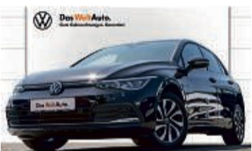
GOLF 1.0 TSI 6-GANG ACTIVE

10.367 km | EZ: 08/2021 | 81 kW/110 PS Farbe: Deep Black Perleffekt Keyless Access, Telefonschnittstelle Comfort, induktive Ladefunktion, Navi, virtuelles Cockpit, Sitzheizung, Sprachsteuerung, Rückfahrkamera, Einparkhilfe vorn/hinten uvm.