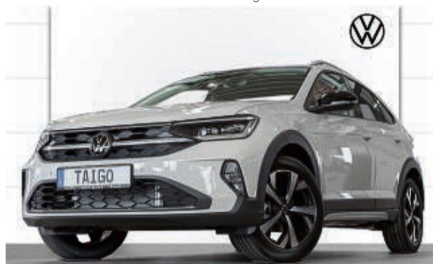
TAIGO 1.5 TSI DSG STYLE

Leistung: 110 kW/ 150 PS, Benzin Farbe: Ascotgrau / Deep Black Perleffekt Kraftstoffverbrauch in l/100 km, kombiniert 5,1 l; innerorts 6,4 l; außerorts 4,3 l. CO 2 -Emissionen kombiniert 121 g/km. Effizienzklasse: B.