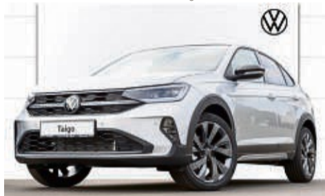
TAIGO 1.5 TSI DSG STYLE

Leistung: 110 kW/ 150 PS, Benzin Farbe: Reflexsilber Metallic Kraftstoffverbrauch in l/100 km, kombiniert 5,1 l; innerorts 6,4 l; außerorts 4,3 l. CO 2 -Emissionen kombiniert 121 g/km. Effizienzklasse: B.