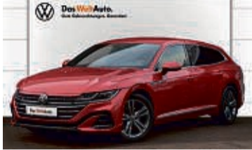
ARTEON SHOOTING BRAKE 2.0 TDI DSG R-LINE

25.650 km | EZ: 04/2021 | 147 kW/200 PS Farbe: Kings Red Metallic Sitzheizung vorn/hinten, AHK, DAB+, Navi, LED-Scheinwerfer, LED-Rückleuchten, dyn. Blinklicht, Rückfahrkamera, LMR 18", elektr. Heckklappe, Dachhimmel schwarz, ACC uvm.