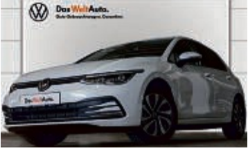
GOLF 2.0 TDI DSG ACTIVE

6.603 km | EZ: 07/2021 | 110 kW/150 PS Farbe: Orxyweiss Perlmuttereffekt Virtuelles Cockpit, App Connect, Einparkhilfe vorn/hinten, induktives Lade Smartphones, 3-Zonen-Klima, Sitzheizung, Sprachsteuerung, Navi, LED-Plus-Scheinwerfer uvm.