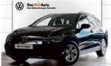
GOLF VARIANT 1.5 eTSI DSG IQ.LIGHT

4.859 km | EZ: 04/2021 | 110 kW/150 PS Farbe: Deep Black Perleffekt Panoramadach, Keyless Access, App Connect, LMR 16", Navi, Klima DAB+, elektr. Heckklappe, Einparkhilfe vorn/hinten, Sitzheizung, Sprachsteuerung, induktive Ladefunktion uvm.