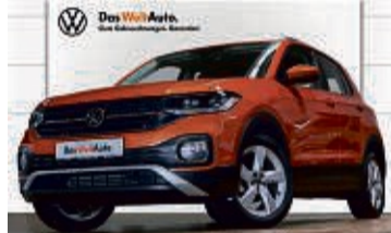
T-CROSS 1.0 TSI 6-GANG STYLE

9.442 km | EZ: 09/2020 | 81 kW/110 PS Farbe: Energetic Orange Metallic Rückfahrkamera, Einparkhilfe vorn/hinten, Navi, App Connect, induktive Ladefunktion, LED-Scheinwerfer, ACC, LMR 17", Sitzheizung, Spurhalteassistent, LED-Heckleuchten uvm.