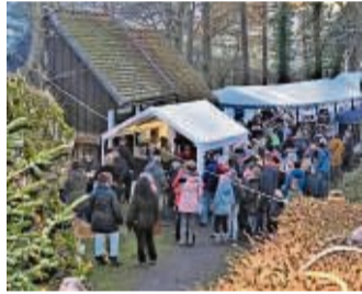
Besonders: Der Weihnachtsmarkt auf der Burgruine.

Hatzfeld – Ein Weihnachtsmarkt mit mittelalterlichem Ambiente findet am Samstag, 26. November, ab 15 Uhr auf der Hatzfelder Burgruine statt.