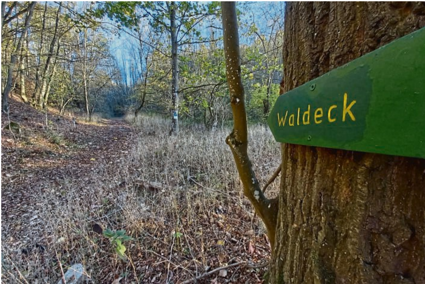
Dieser Weg führt von der Seestraße, gegenüber der Kläranlage, hinauf nach Waldeck. Er könnte für Radfahrer offiziell ausgewiesen werden. Eine Querungshilfe über die Seestraße würde helfen, ihn auf der anderen Straßenseite an den Weg zum See anzubinden.