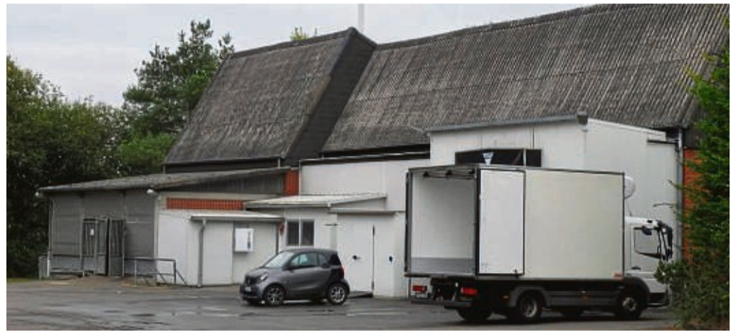
Das Schlachthaus der Landwirtschaftlichen Vieh- und Fleischvermarktung Nordhessen in Mengerhausen: Es soll für drei Millionen Euro vom Landkreis modernisiert und wieder unter einer Betreibergesellschaft für Schlachtungen eröffnet werden.

Ziel ist es, die Ökomodellregion mit Inhalten und Angeboten zu erfüllen, eine Schlachtstätte nahe bei den landwirtschaftlichen Betrie-