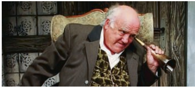
Lustspielklassiker: Das Stück „Das Hörrohr“ wird am 5. Dezember aufgeführt.

Doch nicht jeder meint es gut mit ihm. Vor allem