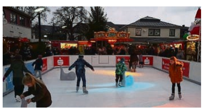
Die Sparkassen Eis-Arena lädt Groß und Klein dazu ein, auf dem Eis Runden zu drehen.

Der Medebacher Weihnachtszauber ist am Samstag von 12 bis 22 Uhr und am Sonntag von 11 bis 20 Uhr geöffnet. Die Sparkassen Eis-