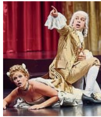
Gastspiel: Amadeus in Bad Arolsen.

Bad Arolsen – Die Schauspielbühnen Stuttgart bringen auf Einladung des Volksbildungsringes am Samstag, 3. Dezember, um 19.30 Uhr ein faszinierendes Theaterduell auf die Bühne der Fürstlichen Reitbahn. Das Schauspiel über den berühmten Komponisten Wolfgang Amadeus Mozart zählt zu den erfolgreichsten Theaterstücken des 20. Jahrhunderts. Es verbindet es Fiktion und Realität. Mozarts Genie und seine Musik im Wien des Jahres 1781 stehen im Mittelpunkt. Schon als Kind wollte Antonio Salieri ein berühmter Komponist werden. Er weicht