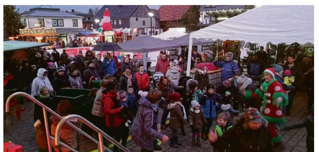
Beim Medebacher Weihnachtszauber gibt es Kunsthandwerk, Live-Musik und vieles mehr.

tränke sowie leckere Cocktails runden die Auswahl ab. An den Kunsthandwerk-, Textil- oder auch Spielwarenständen ist sicherlich das ein oder andere Weihnachtsgeschenk zu finden.