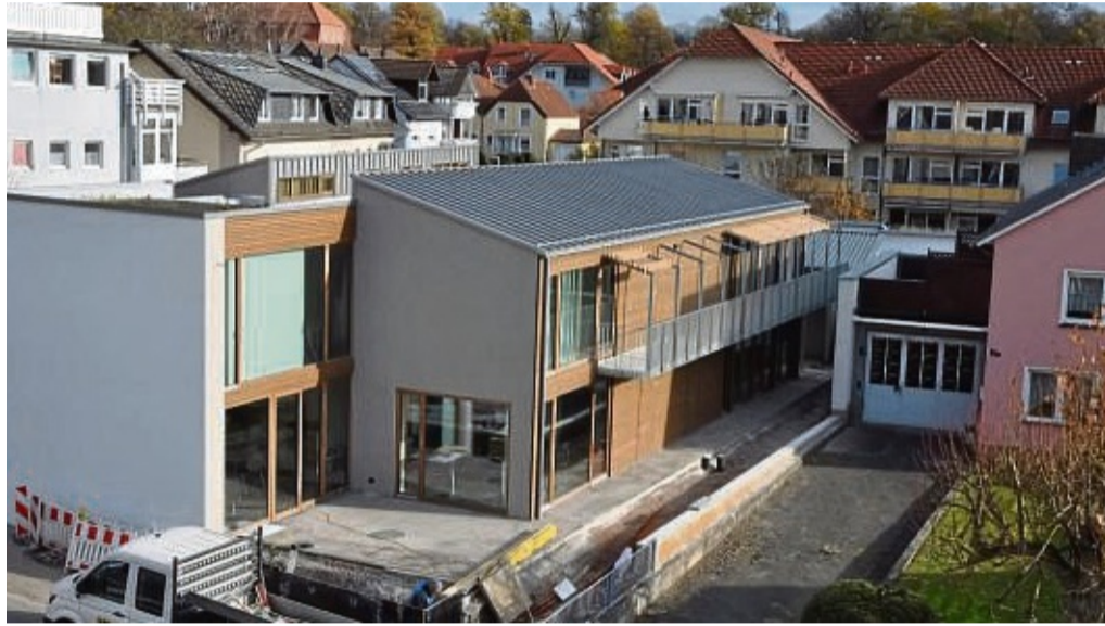
Das neue Jugendzentrum am Birkenweg in Bad Arolsen ist nach fast zwei Jahren Bauzeit seiner Bestimmung übergeben worden.

erfüllen. 60 bis 80 Besucher am Tag seien das Ziel. Auch die beliebten Ferienfreizeiten würden weiterhin angeboten. Gemeinsam wolle man das neue Haus mit Leben erfüllen und darauf achten, dass auch die nächste Generation vom tollen Angebot profitiere. Die Baukosten sind gegenüber der ursprünglichen Planung um zehn Prozent auf 2,37 Millionen Euro gestiegen. es