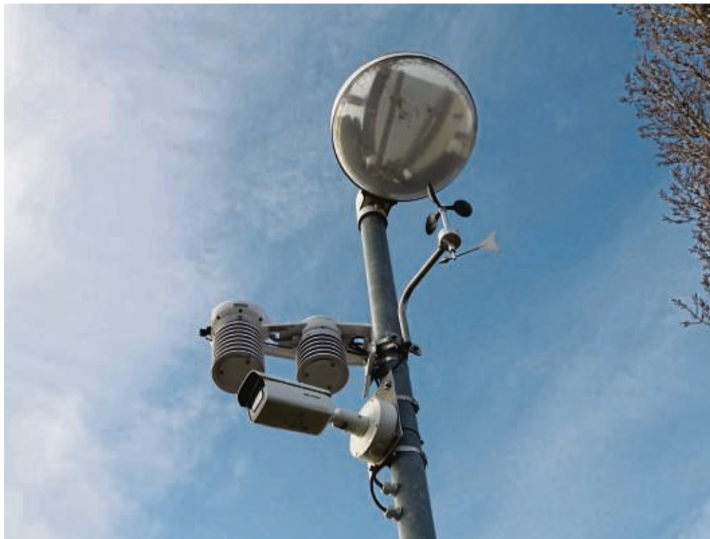
Seit einer Woche verfügt die Kreisstadt über Glatteismeldeanlagen an neuralgischen Punkten.

Nachdem die „Glatteismeldeanlagen“ aufgestellt wurden, hatten sich bereits Passanten verwundert bei der Stadt gemeldet, weil diese Anlagen in der Region noch nicht so verbreitet sind, wie anderswo.