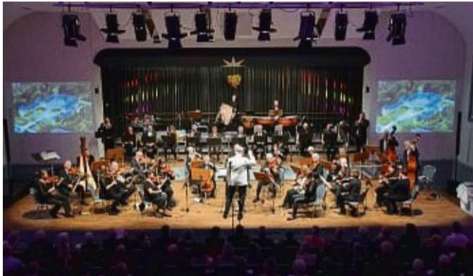
Das Waldeckische Kammerorchester ist wieder beim traditionellen Neujahrskonzert zu hören.

Das Konzert in Bad Arolsen (15. Januar) ist bereits ausverkauft ist. Für das Konzert in Korbach sind noch Karten im Bürgerbüro, Stehbahn 1, Tel. 05631/53336, oder über www.reservix.de erhältlich.