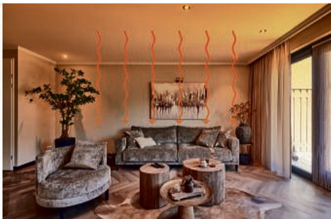
unabhängig heizen mit Infrarot Heizung unter der Decke

Infrarotheizungen können elegant unter Spanndecken „versteckt“ werden. Plameco bietet Dir eine neue, glatte Decke