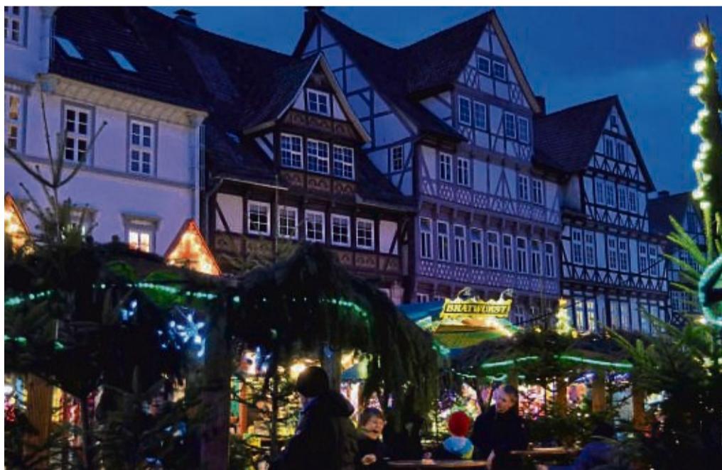
Starten soll der Mündener Weihnachtsmarkt am Freitag, 25. November mit einem bunten Eröffnungsprogramm.