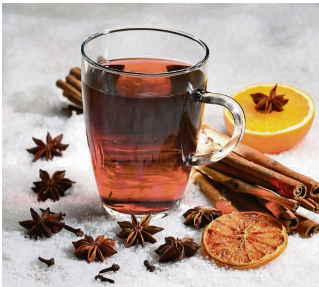
Beim Rosé-Glühwein paart sich fruchtiger Weinduft, der an Himbeeren oder Erdbeeren erinnert, mit den typischen Glühweingewürzen.

Büscher: Ja, nach dem Weingesetz handelt es sich bei Glühwein um ein „aromati-