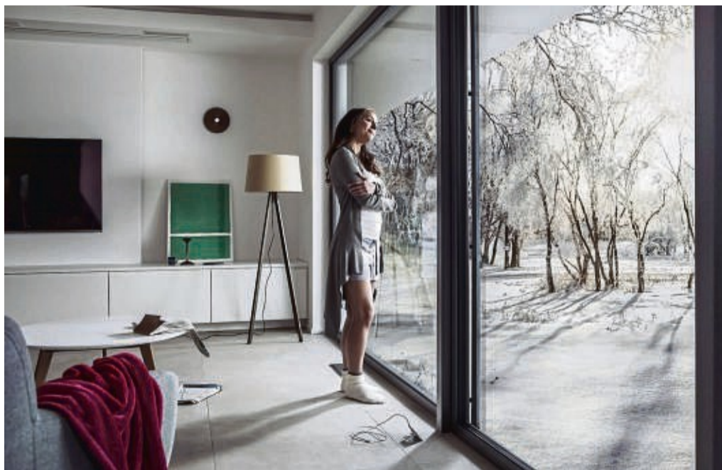
Neue Fenster steigern den Komfort zu Hause, etwa durch einen verbesserten Schallschutz. Dadurch wird auch der Wert der Immobilie erhöht.

Neue Fenster sparen Energie und erhöhen den Wohnkomfort.