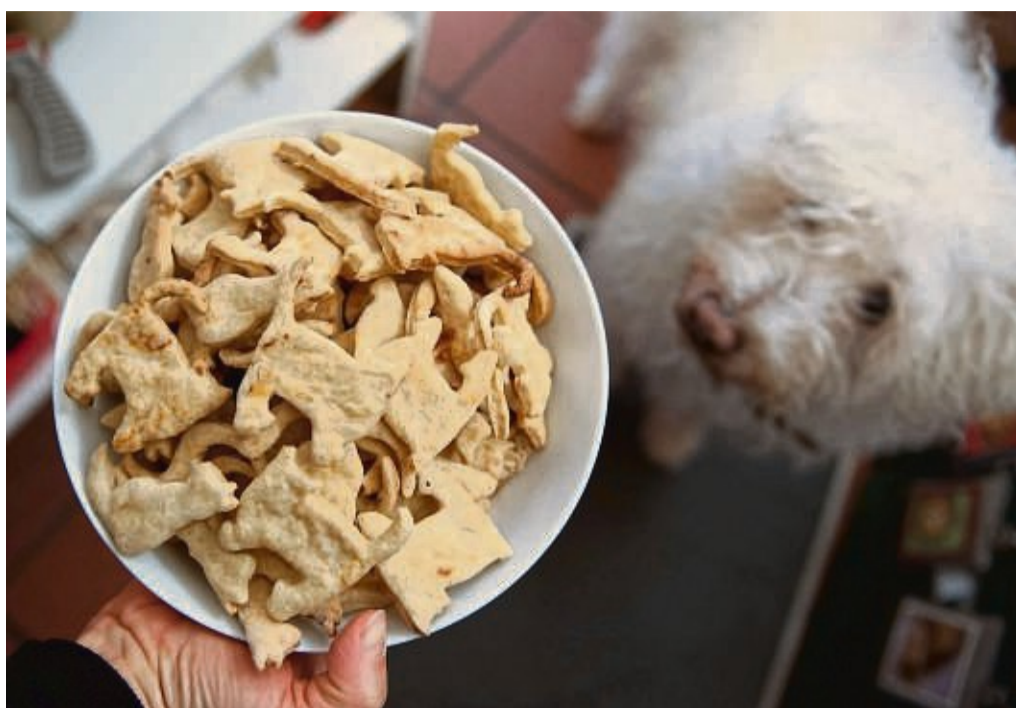
Zum Futtern gern hat das Hündchen Kekse in Katzenform. Man kann natürlich auch ein anderes Motiv wählen.

Die richtige Konsistenz hat der Teig, wenn er sich gut kneten und auf eine Dicke von ungefähr fünf Millimeter ausrollen lässt. Als Deko kön-