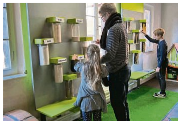
Bei diesem Rätsel müssen Kinder und Erwachsene einzelne Getreidesorten erkennen. Die Mitmachstation befindet sich in einer historischen Roggenmühle.