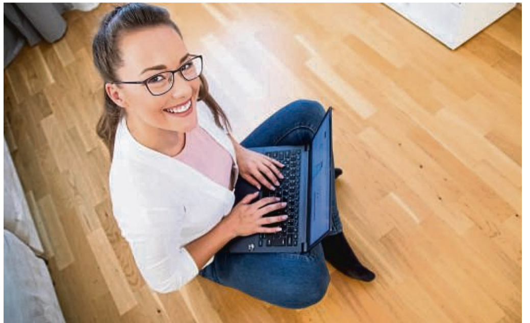
Schnell aufs Knöpfchen gedrückt: Bewerbungen im One-Click-Verfahren können manchmal hilfreich sein.