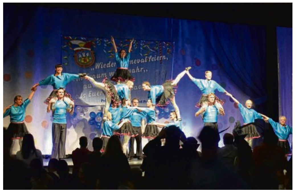
Artistentes Können bewiesen die Mauerblümchen bei ihrem Auftritt.

pen sichtlich erfreut, endlich wieder auf der Bühne stehen zu können und wurden vom Publikum singend, klatschend und tanzend – teilweise auf den Stühlen stehend – unterstützt. Für die Schunkelrunden und laut Programm Party „bis zum bitteren Ende“ sorgten DJ Steven und DJ Niko.