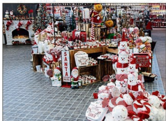
Das Weihnachtsshoppen ist eröffnet. Die Fachgeschäfte im Kaufpark haben Umfangreiches zu bieten.

Der Kaufpark Wehrda liegt nördlich von Marburg direkt an der Bundesstraße 3 und ist somit verkehrsgünstig und schnell erreichbar. Mehr als 2.500 kostenfreie Parkplätze sorgen für stressfreien und bequemen Einkauf.