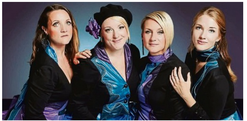
Die „Medlz“ aus Dresden kommen am 11. Dezember mit ihrem Programm „Weihnachts- leuchten“ in die Evangelische Kirche in Willingen.