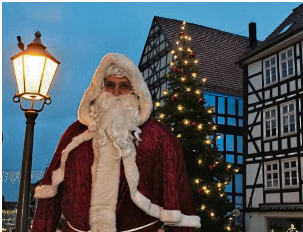
Nach zwei Jahren im Corona-Modus kehrt der Weihnachtsmann am dritten Adventswo- chende zum Weihnachtsmarkt zurück in die Wildunger Altstadt.