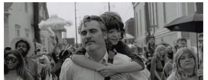
Das Cine K in Korbach zeigt wieder einen Film in der Reihe „Kirchen und Kino“: Joaquin Phoenix und Woody Norman in „Come on, Come on“.

Die Vertreterinnen und Vertreter der Filmreihe wollen mit den Kinobesuchern ins Gespräch kommen. Daher gibt es nach jedem Film der Reihe die Möglichkeit, im Anschluss an die Vorführung im Kino zu diskutieren.