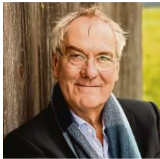
Jörg Maurer Kabarettist, Krimiautor

In eher humorvoller Stimmung verfolgen Wladimir Kaminer und Jörg Maurer das Zeitgeschehen. Kaminer fragt sich, wie er seiner Mutter die Gender-Sternchen und die Bio-Siegel erklären soll – und sicher hat er auch ein Wort