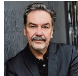
Jurij Andruchowytsh Autor aus der Ukraine