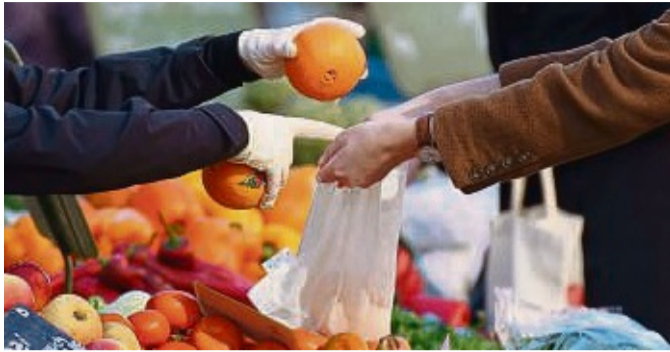
Lecker und vitaminreich: Orangen sind insbesondere im Winter beliebt.

Der Tipp: Nur wenige der Schalen auf den Kompost geben. Und am besten vorher zerkleinern. Das beschleunigt den Zersetzungsprozess. Ein Kompost ist nicht nur