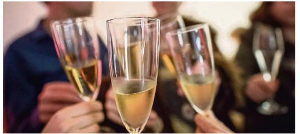
Zeit der Weihnachtsfeiern: Gesellige Runden fördern das Verbundenheitsgefühl im Team.

Fühlen sich alle im Betrieb oder Unternehmen wohl, ist nicht nur die gegenseitige Unterstützung im Job größer. Ein freundliches kollegiales Arbeitsklima führt dazu auch, dass Menschen Freude statt Bauchschmerzen emp-