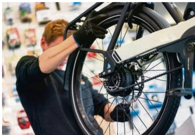
Mit Biss: Meist verzögern Pedelecs mit gut zupackenden Scheibenbremsen - Anfänger müssen das erst üben, speziell wenn sie auf rutschigem Untergrund bremsen.

dem, mittels Kontaktspray Feuchtigkeit von elektrischen Verbindungen wie den Kontakten des Akkus fernzuhalten.