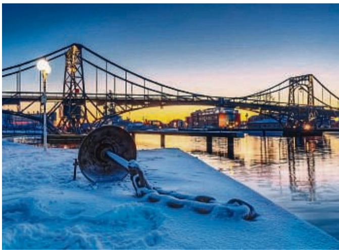
Die Kaiser-Wilhelm-Brücke ist das Wahrzeichen der Stadt und noch heute Deutschlands größte stählerne Drehbrücke.

Ein erlebnisreicher Städtetrip nach Wilhelmshaven an der Nordsee