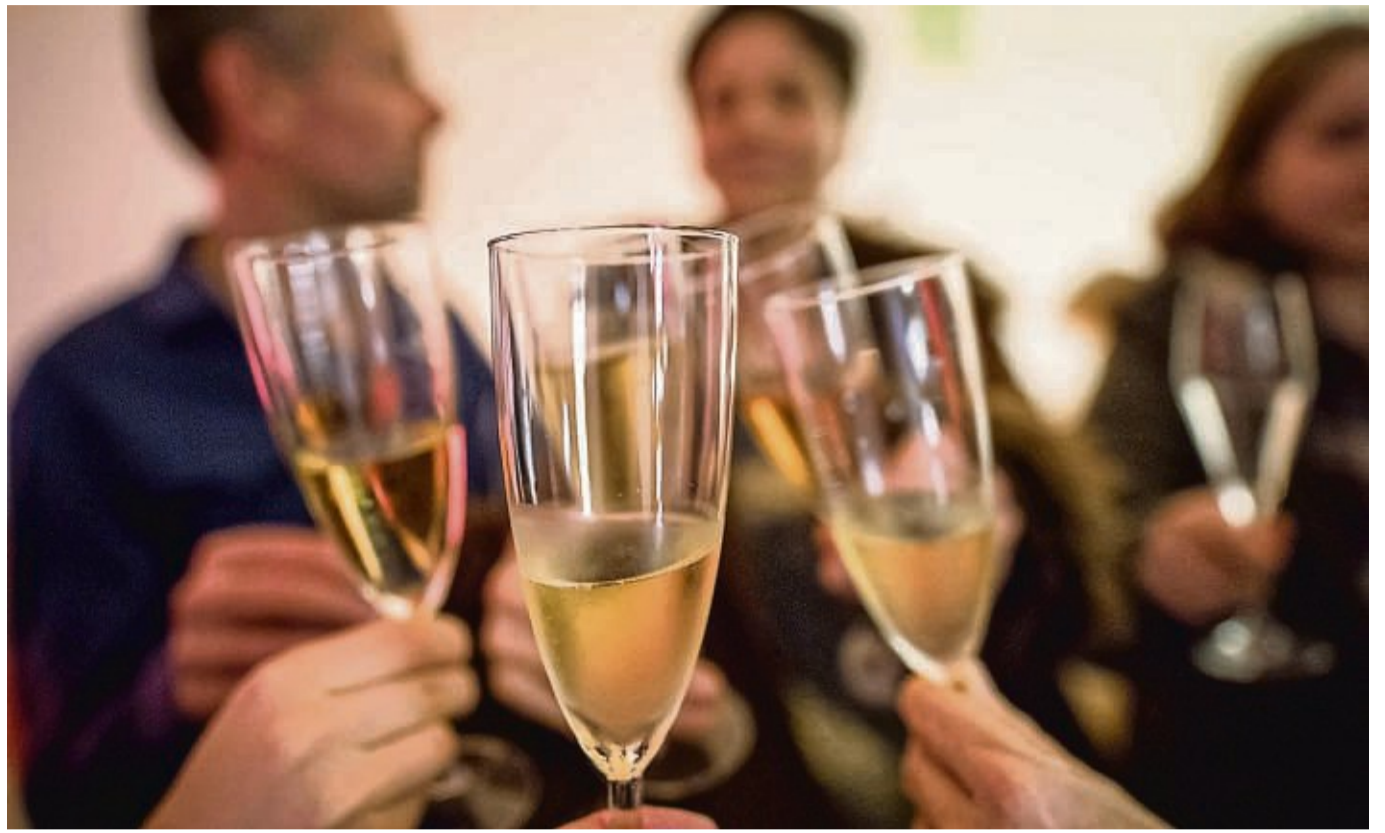
Zeit der Weihnachtsfeiern: Gesellige Runden fördern das Verbundenheitsgefühl im Team.