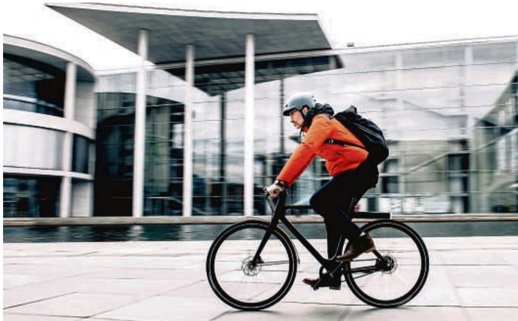
Nix für Warmduscher? Doch, richtig ausgestattet lässt sich das Pedelec auch bequem das ganze Jahr über nutzen.

Der Akku ist neben dem Motor das wichtigste elektronische Teil am E-Bike, das nach guter Behandlung verlangt. Grundsätzlich verringert sich bei Kälte die Reichweite, da sich der elektrische Widerstand im Akku erhöht. „Das Ladegerät gehört also auch