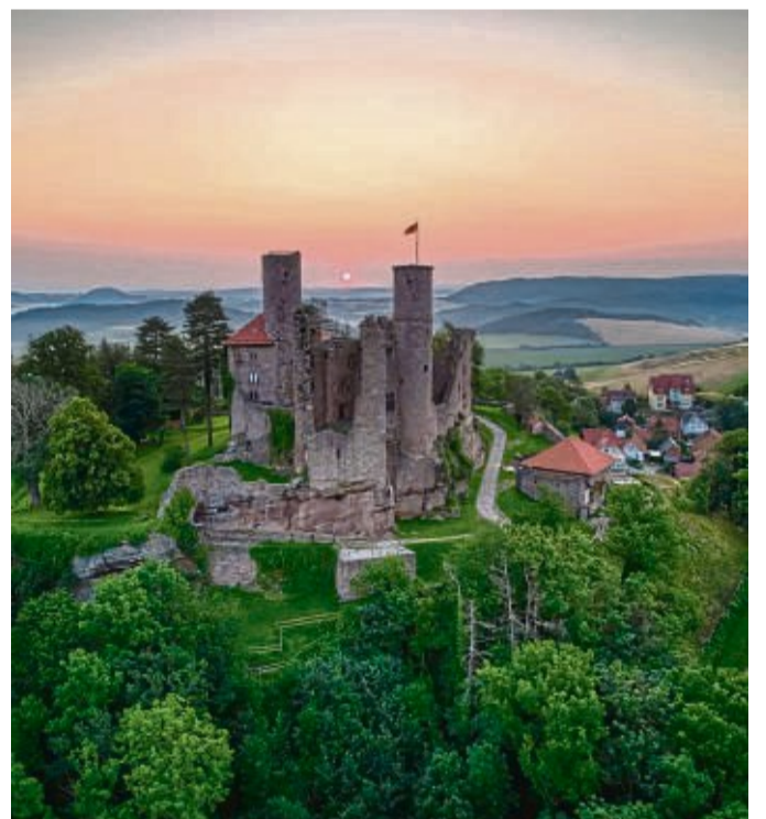
Blick auf Burg Hanstein bei Sonnenaufgang: Sie gilt als eine der größten Burgruinen Mitteldeutschlands.