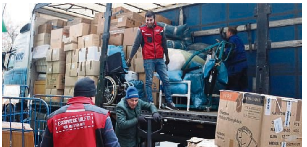
Mehrere Hundert Kartons, Säcke, Rollstühle, Betten und mehr verladen die Helfer: die Hilfspüter gehen in die Ukraine...

Wellingeroode – Die Wellingeroöder hatten einiges vor am heutigen Samstag: Nach einer pandemiebedingten Pause sollte der 23. Wellingeroöder Weihnachtsmarkt endlich wieder stattfinden und für tolle Stimmung sorgen. Nun muss der Weihnachtsmarkt allerdings leider ausfallen. Ein Mitglied des Organisations-Teams ist verstorben, wie die Veranstalter des Marktes in Wellingeroode mitteilen.