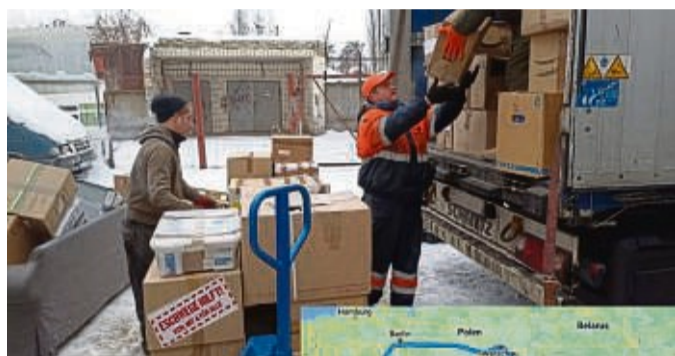
...und kommen hier gut an: Rund 30 Stunden später können die Kartons hier abgeladen und verteilt werden.

Eschwege/Kiew – 20 400 Kilo Hilfsgüter hat „Eschwege hilft“ für die Menschen in der Ukraine gesammelt. Beim bisher größten Transport des Vereins wurden die Spendengrüter nun teilweise in einen Vorort von Kiew gebracht. Kartons mit Medizin, Lebensmitteln, Babynahrung, Schlafsäcken, Spielzeug und mehr hatten Mitglieder des Vereins und der Freiwilligen Feuerwehr Eschwege sowie weitere Helfer am Dienstag, 6. Dezember, auf den Lkw geladen. Hinzu kamen von Seniorenheimen aussortierte