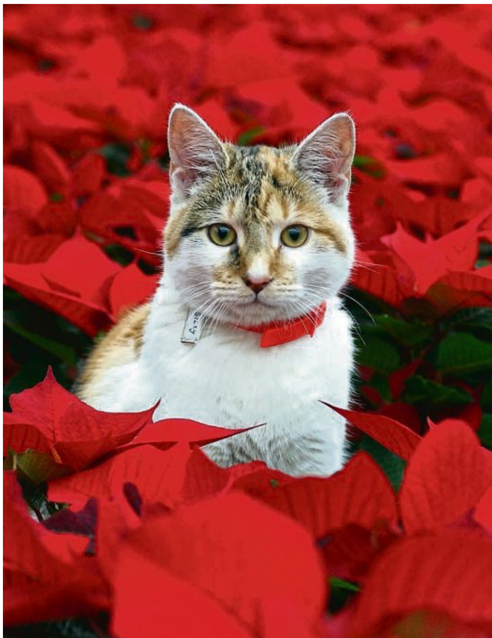
Fehlt ihnen Katzengras, können Katzen schon mal an anderen Zimmerpflanzen knabbern - etwa am Weihnachtsstern. Aber das ist ungesund.

Tierärzte können Medikamente geben, die die Katze schnell zum Übergeben bringen.