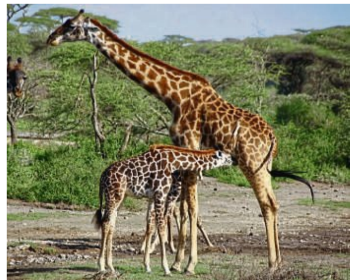
In den fruchtbaren Waldgebieten Tansanias begegnen die Abenteurer umherstreifenden Giraffen.

St. Petri Dom mit Brügge-mann-Altar. 3. Schloss Got-torf als Symbol deutsch-däni-scher Geschichte. 4. Domkon-zerte, Theater und Ausstel-lungen. Ein Highlight ist der „Schwahlmarkt“ im St. Petri Dom. djd-k