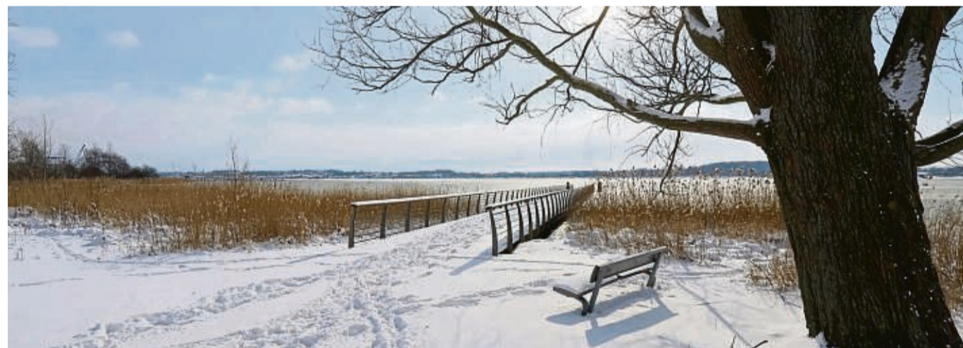
Purer Winterzauber: Von den Königswiesen in Schleswig geht der Blick auf die Schlei, mit 42 Kilometern Schleswig-Holsteins längster Ostsee-arm.

Nähere Informationen gibt es unter www.klueger-reisen.com . Hier kann auch ein unverbindliches Angebot angefordert werden. djd-k