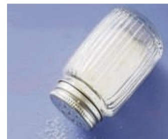
Jedem Alltags-Salz sollte Jod zugesetzt sein.

Untersucht wurden sowohl jodierte Salze als auch solche ohne zugesetztes Jod. Das Urteil der Experten jedoch: Jedem Alltags-Salz sollte Jod zugesetzt sein. Immerhin nehmen in Deutschland viele Menschen zu wenig Jod zu sich. Auch Fluorid als Zusatz sei sinnvoll, Extra-Folsäure schade nicht. Fehlte bei gewöhnlichem Salz die Bedarfsdeckung, wurde daher abgewertet. tmn