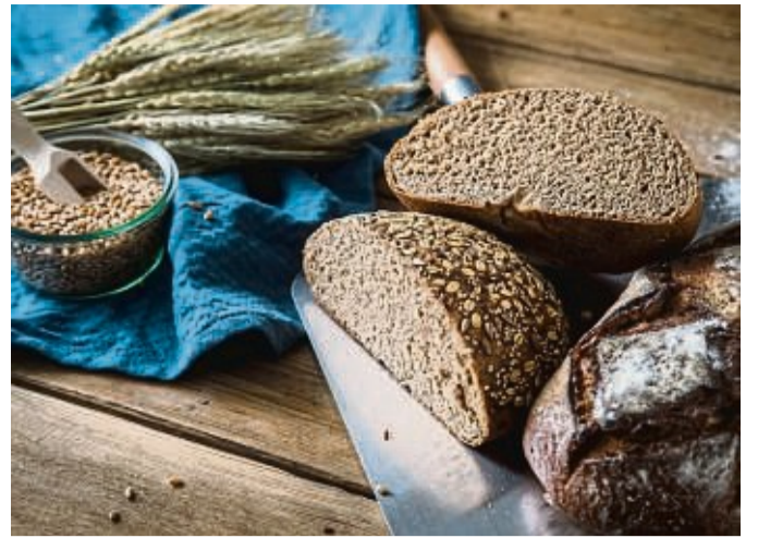
Nicht jedes dunkle Brot mit Körnern ist direkt ein Vollkornbrot. Es könnte auch ein Mehrkornbrot sein, in dem allerdings nicht das ganze Korn verarbeitet wurde.