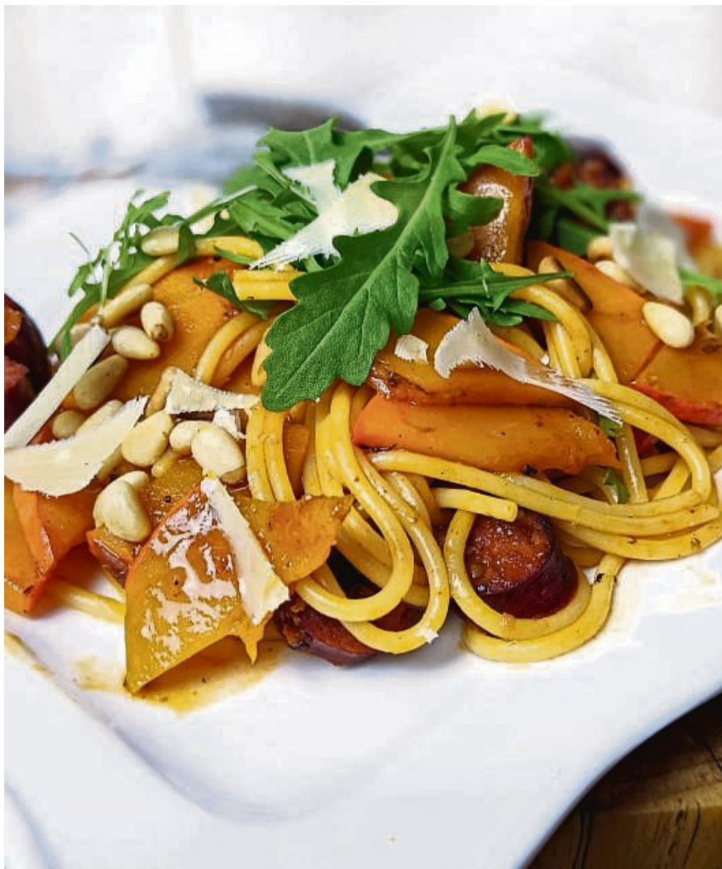
Orangeleuchtende Kürbistreifen verpassen der Pasta nicht nur Farbe, sondern auch Geschmack.

Inzwischen den Kürbis putzen und in mundgerechte ca.