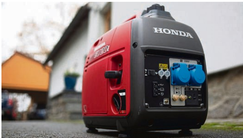
Einen ganzen Haushalt kann so ein mobiler Generator im Falle eines Stromausfalls nicht versorgen.

Nächster Knackpunkt: Wo steht solch ein Gerät? Niemals in der Wohnung selbst, warnt der Tüv-Experte für