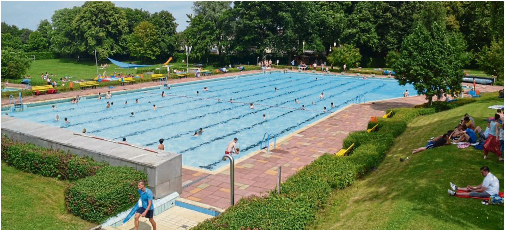
Rund 60 Jahre alt: Das Korbacher Freibad kann nach mehreren Anläufen endlich saniert werden. Möglich macht das eine Förderung des Bundes über 4,275 Millionen Euro.