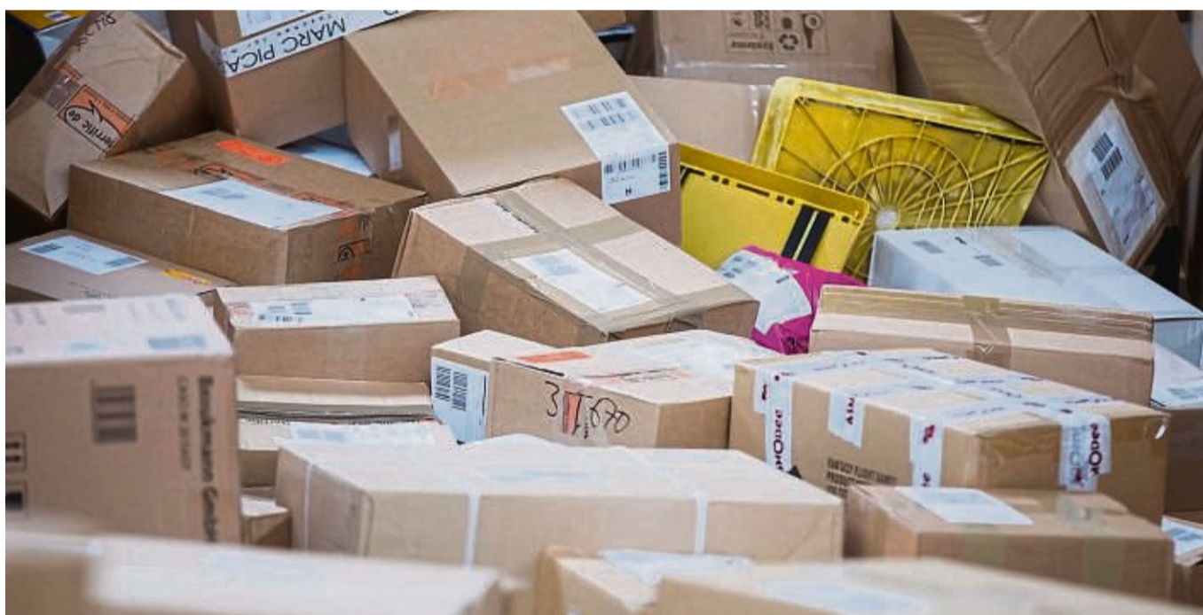
Viele Pakete sind derzeit unterwegs: Wenn etwas schiefliegt, haben Kunden einiges zu beachten.

„Jeder Mensch macht Fehler“, sagt die Korbacherin – aber jetzt gehe es ihr ums Prinzip. Der Teamleiter sei