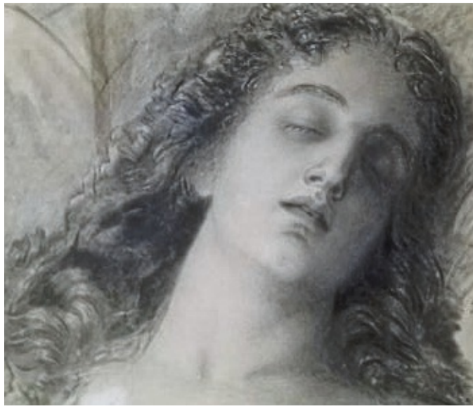
Die schlafende Capuletti: Kohlezeichnung von Friedrich Kaulbach.