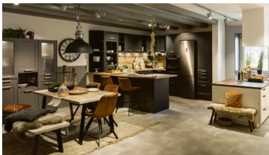
Top aktuelle Möbel- und Küchentrends zum Anfassen!

Das Küchenstudio der Extraklasse: Neueste Material- und Farbtrends kombiniert mit innovativer Küchentechnik lassen die Herzen der Küchenprofis und Kochfreunde höherschlagen. Dabei präsentiert das Unternehmen eine große Auswahl namhafter Küchenhersteller wie Schüller, next125 oder nobilia.