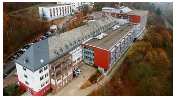
Kreiskrankenhaus in Frankenberg: Ein Systemwechsel bei der Klinikfinanzierung soll mehr Transparenz schaffen. Gleichzeitig wird laut Landrat „für das Krankenhaus ein Anreiz geschaffen, besser zu sein als der Plan“.

Stammkapitalerhöhungen, Ausleihungen und Investitionszuschüsse sollen der Vergangenheit angehören – an deren Stelle treten im Ergebnishaushalt beispielsweise Abschreibungen, wenn es um Investitionen in die Kreisklinik geht. „Wir bewegen uns insgesamt aber weiter auf gleichem Niveau“, fügte der Landrat hinzu und machte deutlich, dass der Landkreis das Kreiskrankenhaus auch 2023 mit einem Betrag in Höhe von rund drei Millionen Euro ausstatte. Damit liege man in etwa bei dem Betrag, der in den vergangenen Jahren für das Kreiskrankenhaus jährlich ausgegeben