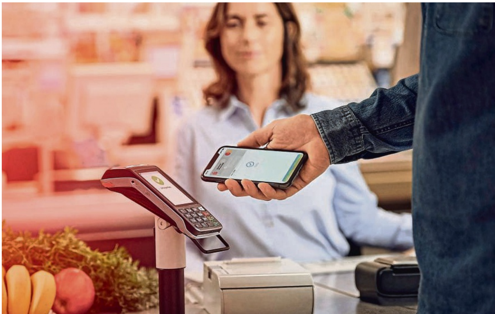
Bezahlen mit dem Handy oder der Smartwatch erfreut sich auch in Deutschland wachsender Beliebtheit. Betrüger nutzen das für neue Maschen und erzielten in Nordhessen Erfolge, warnt die Polizei.

Im Anschluss sollen Benutzernamen und Passwort des Online-Banking-Accounts sowie die Rufnummer des Smartphones in eine Maske