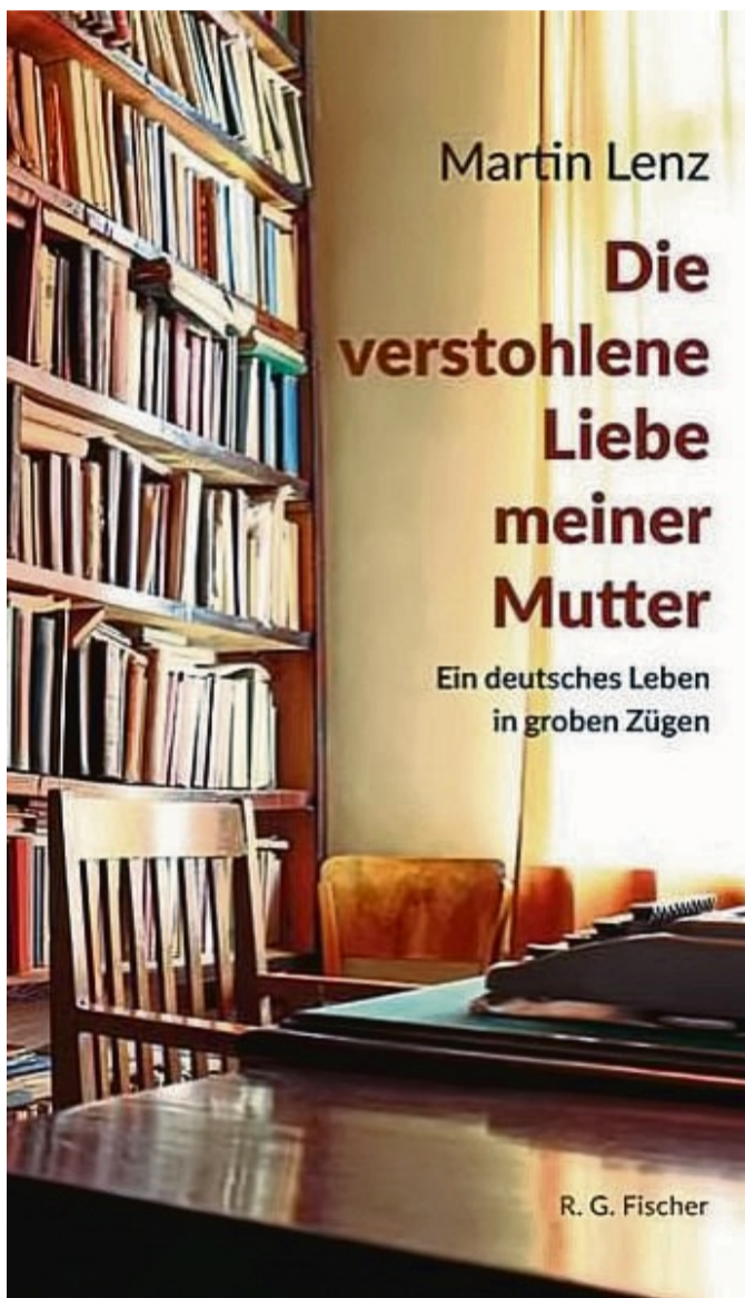
Das Cover des Romans: Die verstohlene Liebe meiner Mutter. Ein deutsches Leben in groben Zügen. 2022. 732 Seiten. ISBN 978-3-8301-9500-9.

„Ich habe den Aufstand in Halle so erlebt, wie ich ihn schildere. In den 1950er Jahren und besonders nach Stalins Tod herrschte in der DDR die Überzeugung vor, dass es in irgendeiner Form zu einer Vereinigung der Teile Deutschlands kommen werde. Es wurde sogar die naive Hoffnung geschürt, dass die Westmächte den Aufständischen zu Hilfe kommen würden. Diese Hilfe blieb aus. Von da an war uns allen klar, dass man sich entweder mit der Staatsmacht arrangieren oder in den Westen flüchten musste, wenn man überleben wollte. Ich kenne aus eigenem Erleben nur die DDR vor dem Mauerbau, als Klassenkampf und Indoktrinierung wegen der noch relativ offenen Grenzen sehr viel aggressiver betrieben wurden als später.“