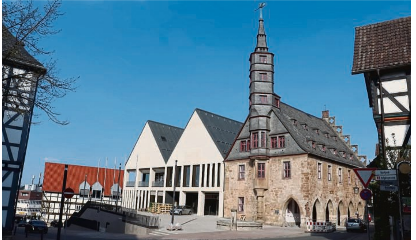
Nach rund drei Jahren Bauzeit eröffnet die Stadt Korbach im Mai ihr neues Rathaus.

In Bad Wildungen macht im Juli der Entwurf fürs neue Heloponte Schlagzeilen. Geplant ist eine Wasser-Erlebnis-Landschaft, die im weiten Umkreis ihresgleichen sucht mit einem 500 Quadratmeter großem Natur-Schwimmbe-