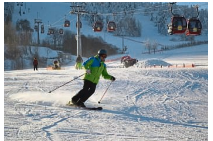
Die Skisaison in Willingen feiert Mitte Dezember beachtenswert früh ihren Auftakt, dieser währt allerdings nur kurz.