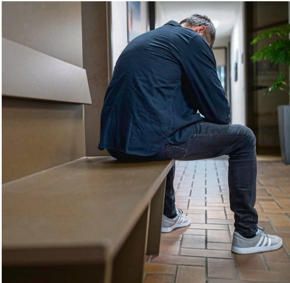
Knapp 20 Prozent der Opfer von häuslicher Gewalt sind Männer: Unser Symbolbild zeigt einen Mann in einer Caritas-Schutzwohnung.

Da selbst bei Totschlag, Mord und schwerer Körperverletzung in Ehe und Partnerschaft in 20 Prozent der Fälle die Männer die Opfer sind, gebe es bei Polizei und Justiz bereits ein ernsthaftes Bemühen, die männlichen Opfer von häuslicher Gewalt