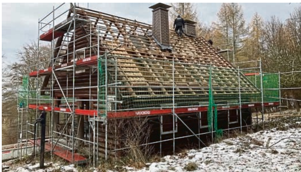
Eingerüstet für den Abbau: die Charlottenhütte.

Ideen für eine neue Nutzung gebe es. Die Prüfung dazu laufe. Es wäre nicht das erste Gebäude aus dem heutigen Nationalpark, dem frühe-