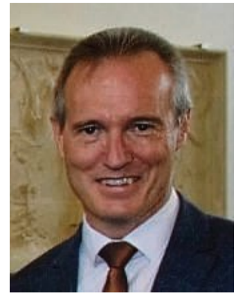
Landrat Jürgen van der Horst.

Waldeck-Frankenberg - „2022 hat uns sehr gefordert - und tut dies noch immer“, blickt Landrat Jürgen van der Horst in einer Pressemitteilung auf die vergangenen ereignisreichen 365 Tage zurück. Gleichzeitig richtet er den Blick auf neue Aufgaben und Herausforderungen, die 2023 mit sich bringen wird: