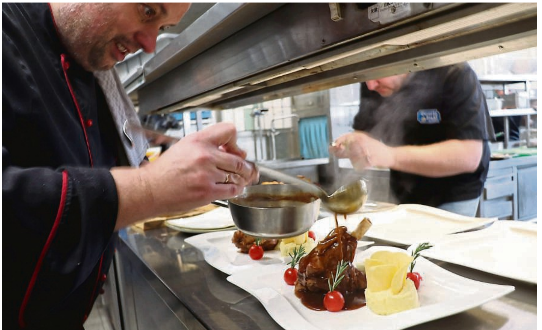
Aus regionalem Lammfleisch lässt sich einiges auf die Teller zaubern, wie die Köche in Göbel's Landhotel in Willingen zeigen.