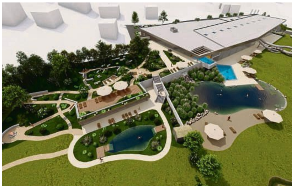
Bad Wildungen braucht ein neues Bad, zu welchen Konditionen bleibt fraglich.