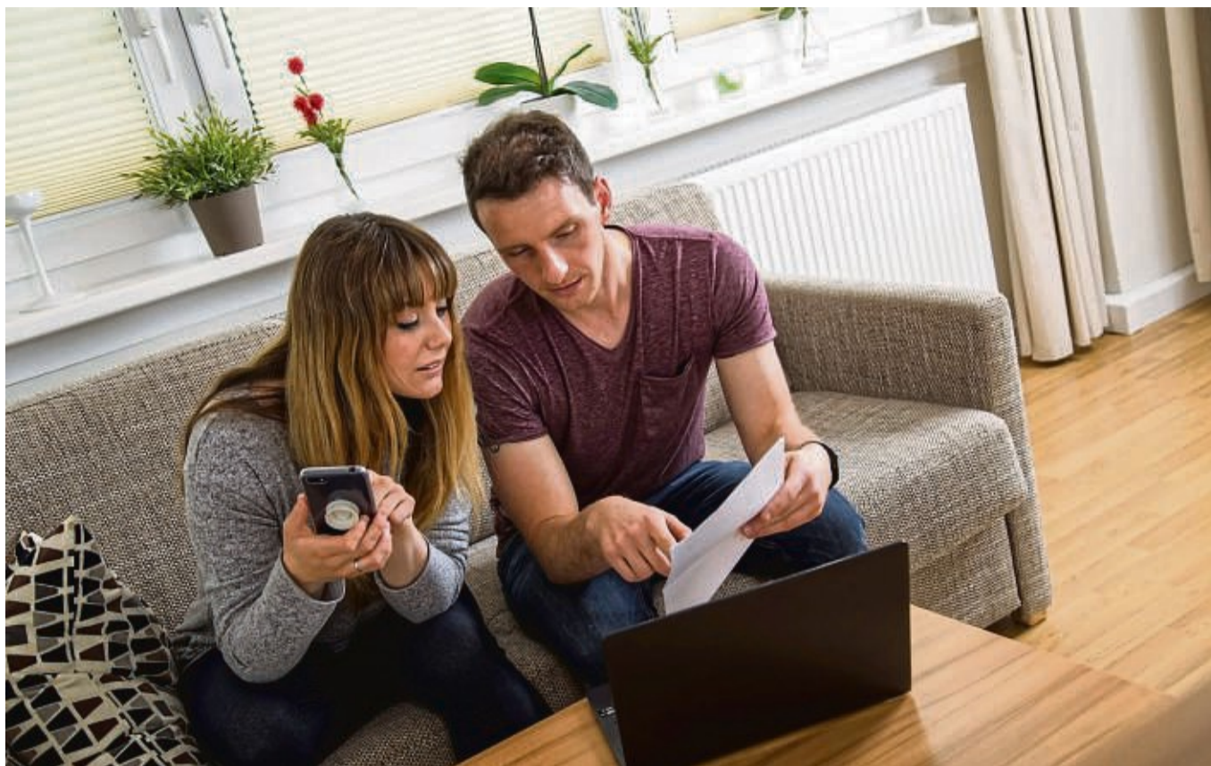
Gemeinsam den Überblick behalten: Zusammenlebende Paare tun in der Regel gut daran, ein gemeinsames Konto zu führen.

Ihr persönliches Konto sollten die Partner deswegen aber nicht auflösen, sagt die