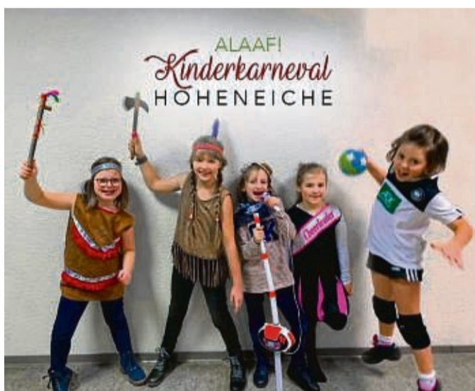
Kinderkarneval: Am 11. Februar gibt es wieder die beliebte Kinderfeier. Um 14.11 Uhr geht es los.

Das Konzert beginnt um 20 Uhr und endet um 22 Uhr. Bewusst endet dies früh, so dass man am nächsten Tag nicht zwingend Urlaub nehmen muss. Wir hoffen das wir mit diesem Konzert auch Bewohner aus den umliegenden Alten- und Pflegeheimen an-