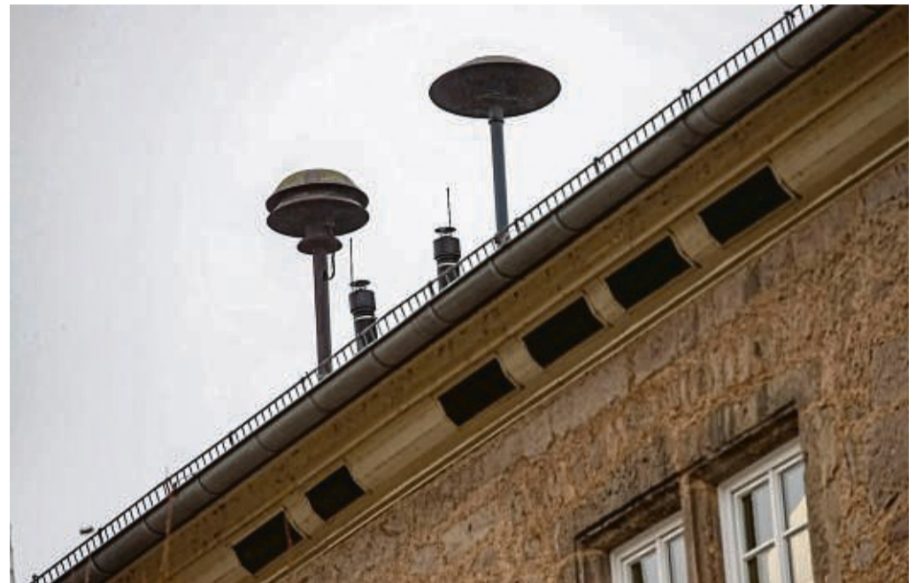
Sollen 2023 weiter umgestellt werden: Die Sirenen im Kreis bekommen neue, digitale Steuerungsempfänger. Sie ermöglichen dann auch alle gängigen Sirenensignale.

Idealerweise hätten die Kommunen ihre Sirenen schon umgerüstet. „Aktuell bestehen bei Motorola als Zu-