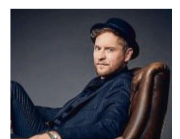
Johannes Oerding ist aus der deutschen Musik-Szene nicht wegzudenken.