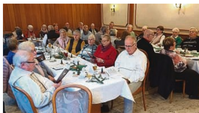
Nach zwei Jahren Pause lud der Awo-Ortsverein Sontra zur Weihnachtsfeier ein.

Bei Kaffee und Kuchen und guten Gesprächen verging die Zeit schnell. Mit einigen vorgetragenen Gedichten und Gedanken aus der Mitte der Teilnehmer endete ein schöner Nachmittag. red/esp