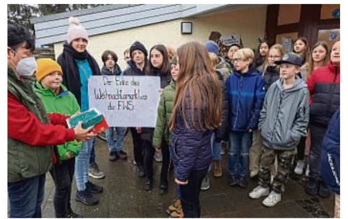
Fast 4000 Euro spendeten Schüler der Friedrich-Wilhelm-Schule Eschwege an das Tierheim und die Tafel in Eschwege.