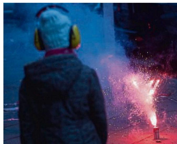
Wenn Eltern dem Kind versprechen , es Silvester für das Mitternachts-Feuerwerk zu wecken, dann sollten sie das auch tun.

Für silvesterfeiernde Eltern hat der Experte noch einen Ratschlag parat: „Man sollte