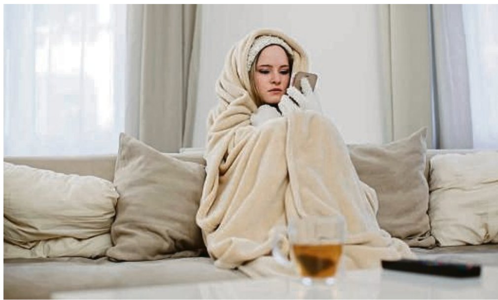
Die Heizung fällt oft an den kältesten Tagen aus. Und nun?