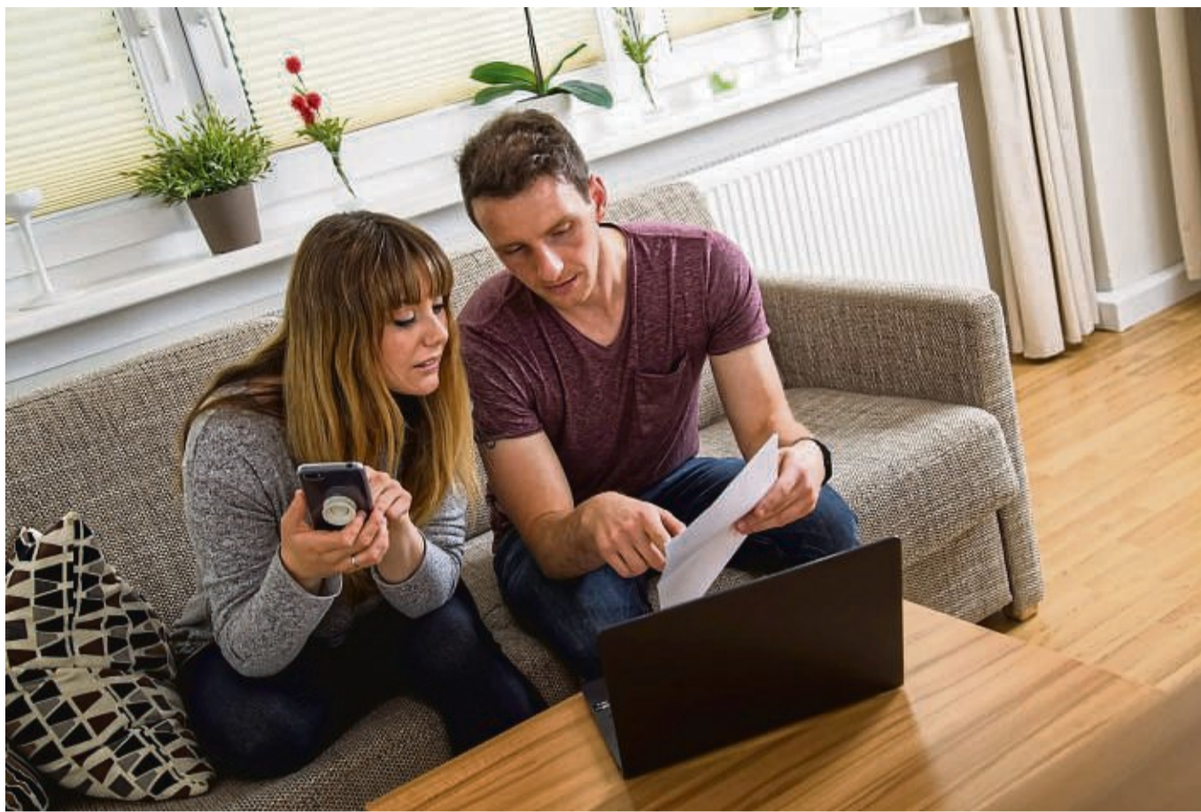
Gemeinsam den Überblick behalten: Zusammenlebende Paare tun in der Regel gut daran, ein gemeinsames Konto zu führen.

Wie das Konto gefüttert wird, kann jedes Paar für sich entscheiden. Häufig ist es so, dass beide Partner einen Teil ihres Gehalts auf das Gemeinschaftskonto einzahlen. Je nach Absprache und Gehaltsgefüge kann das entweder für beide derselbe Betrag sein. Oder die Zahlung wird anteil-