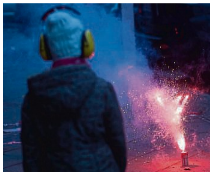
Wenn Eltern dem Kind versprechen , es Silvester für das Mitternachts-Feuerwerk zu wecken, dann sollten sie das auch tun.

Für silvesterfeiernde Eltern hat der Experte noch einen Ratschlag parat: „Man sollte