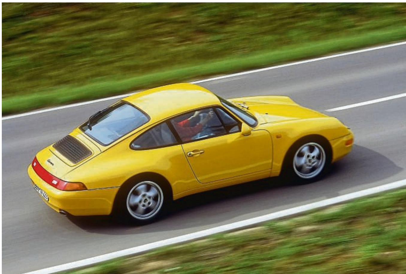
Bestimmte Modelle des 911 Carrera Coupé (Typ 993) können ab 2023 ein H-Kennzeichen bekommen.

Man sollte genau nachrechnen, ob ein H-Kennzeichen lohnt, rät Vincenzo Lucà vom TÜV Süd. Erfüllt ein Benzinmotor mit 1,2 Litern Hubraum zum Beispiel die Abgas-