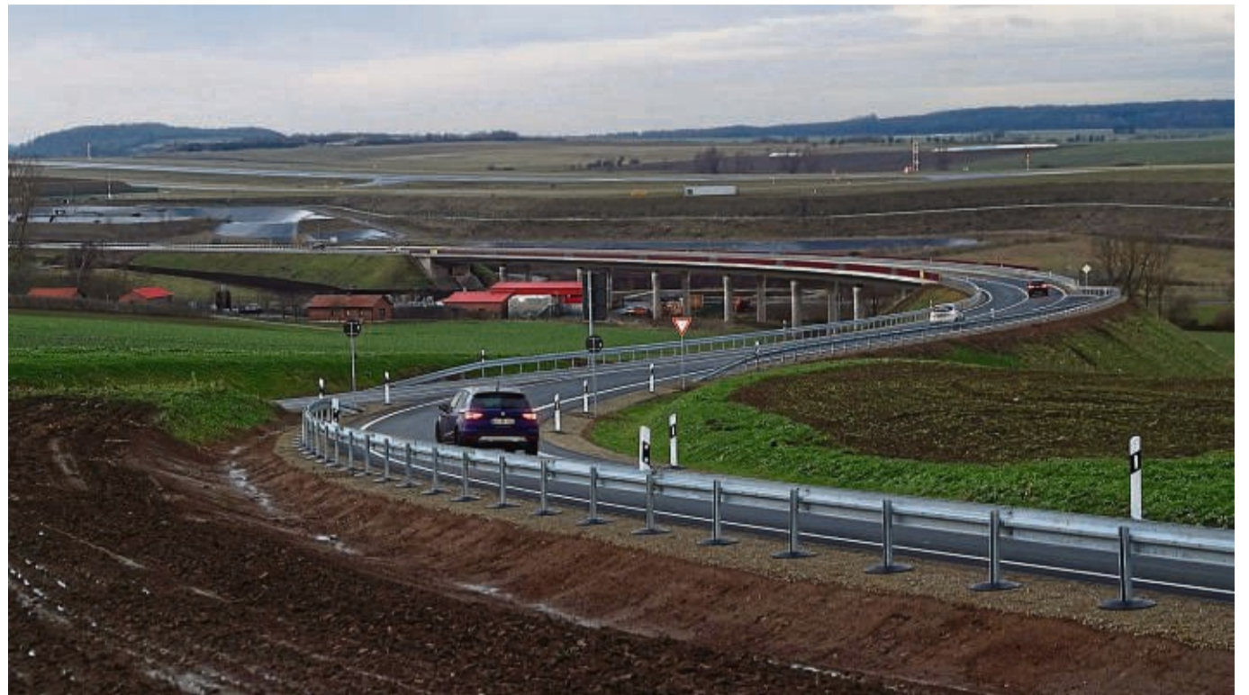
(CALDEN) Blicke aus neuen Perspektiven auf den Kassel Airport (hinten) und den Ort Calden haben seit gestern Autofahrer auf der neuerbauten B 7-Ortsumgehung Calden. In der Bildmitte ist die Caldebachtalbrücke zu sehen, eine von sechs Brücken, die für das Projekt errichtet wurden.

Grebensteins Bürgermeister Danny Sutor lobte das Ergebnis ebenfalls, das aber erst