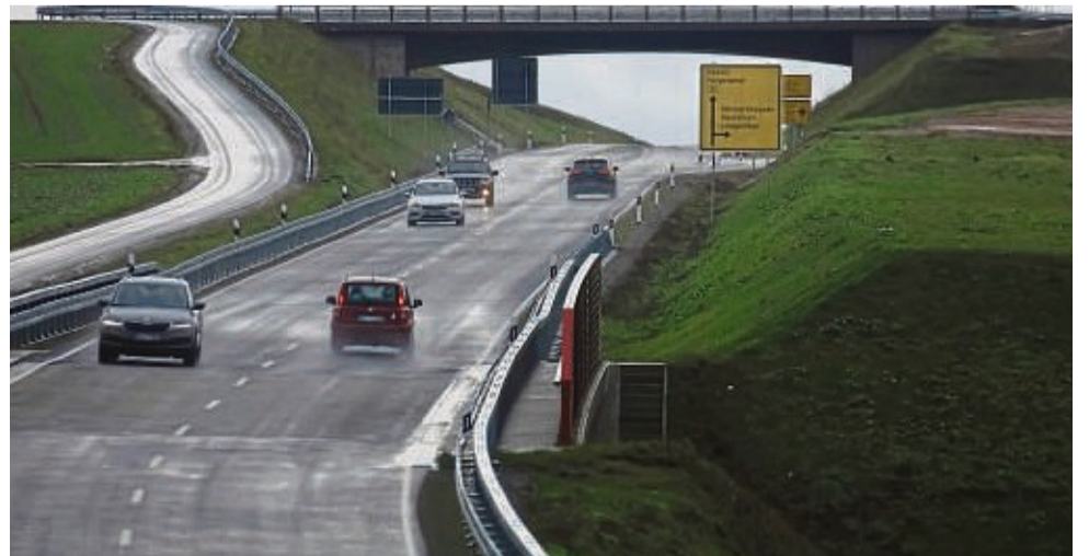
(BAD KARLSHAFFEN) Seit dem 22. Dezember rollt der Verkehr auf der Ortsumgehung Bad Karlshafen. Das Foto zeigt die Abfahrt Langenthal.