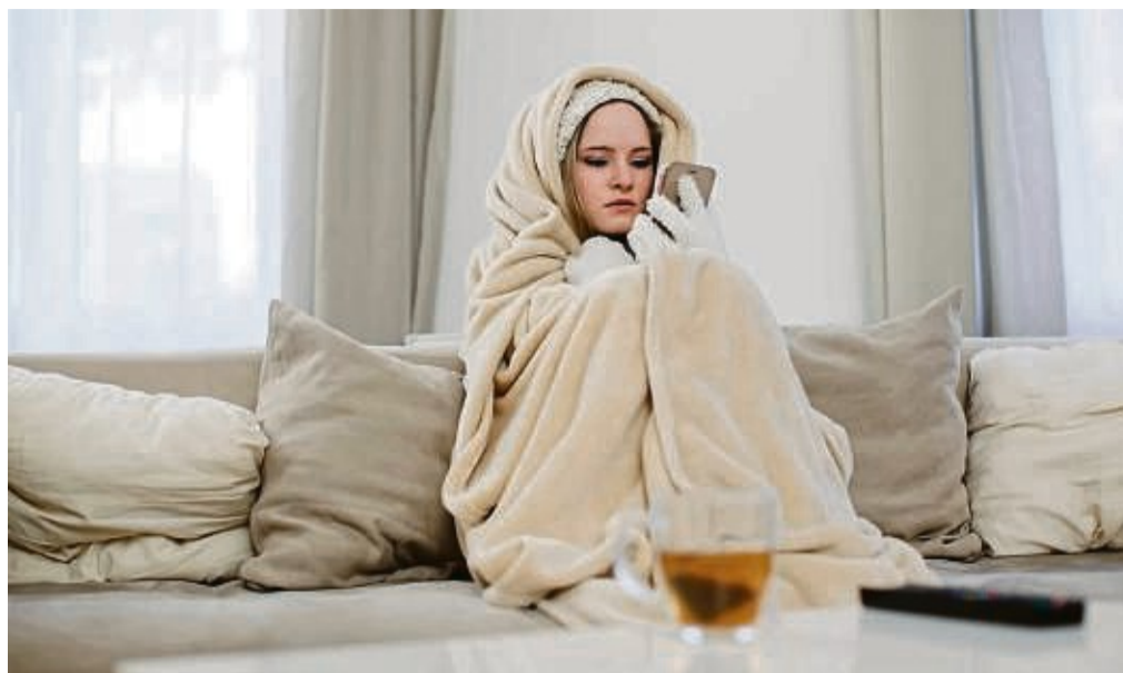
Die Heizung fällt oft an den kältesten Tagen aus. Und nun?