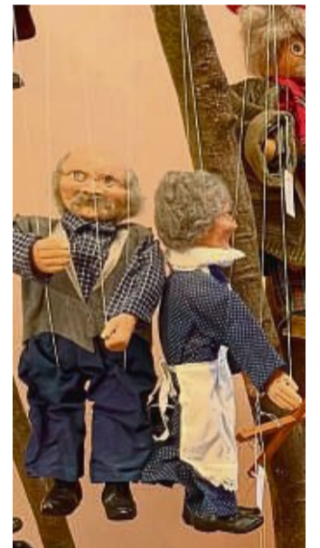
Eine große Auswahl an Puppen gibt es an der Langen Straße 22 in Hann. Münden bei Pole Poppenspüler.

Geöffnet hat Pole Poppenspüler bis Weihnachten freitags ab 13 bis 18 Uhr, samstags von 10 bis 16 Uhr geöffnet. Im nächsten Jahr dienstags bis freitags von 10 bis 18 und samstags von 10 bis 14 Uhr.