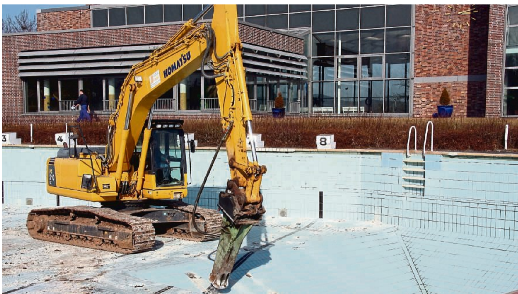
2019 war Schluss: Das alte Freibad wurde vor vier Jahren abgebaut. An seiner Stelle entstand unter anderem ein Kinder-Wasserspielplatz.

Das Becken des Eschweger Naturfreibades soll eine Fläche von mehr als 1000 Qua-