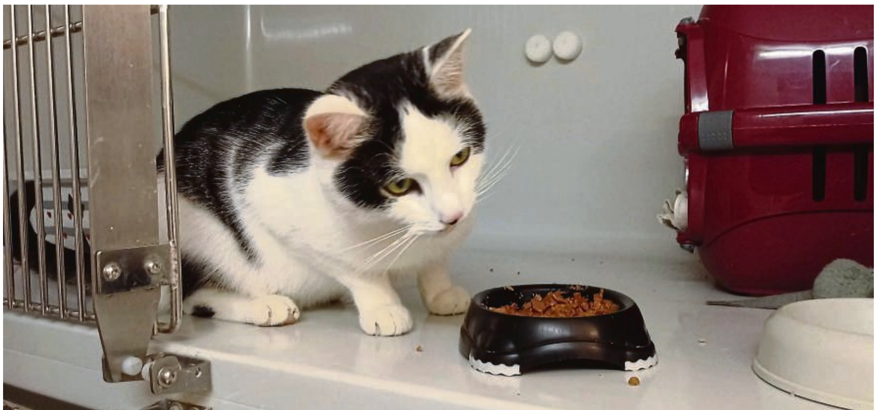
Tiere wie Katze Billy aus dem Eschweger Tierheim sollten laut Gudrun Schmidt nicht kurz vor Silvester einen Umgebungswechsel erleben.

Gudrun Schmidt geht davon aus, dass es die Rückgaben von zu Weihnachten verschenkten Haustieren im ländlichen Raum weniger als in größeren Städten gebe. Direkt vor Weihnachten und auch vor Silvester gibt das Tierheim Eschwege keine Tiere mehr ab. Ein Umgebungswechsel vor Silvester bedeute für die Tiere zusätzlichen Stress. Die lauten Geräusche des Feuerwerks würden Tiere ohnehin stark verängstigen. „Die sind alle einsichtig“, sagt sie über die Re-