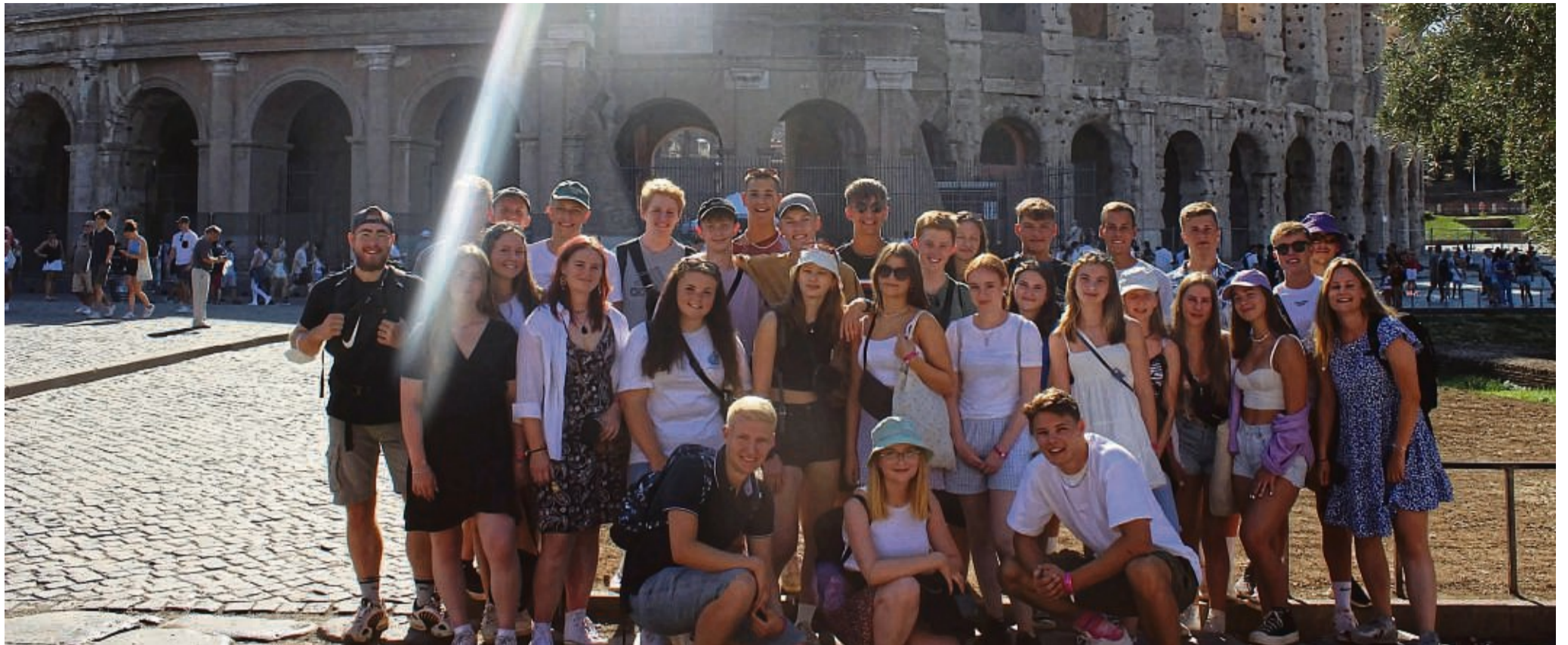
Unvergessliche Eindrücke wie hier in Rom ermöglicht der Kreisjugendring auch in diesem Jahr wieder - Anmeldungen sind noch möglich.