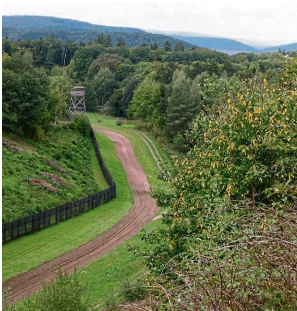
So sah es mal aus: Das Grenzmuseum Schifflersgrund betreibt eine Dauerausstellung, in der noch Wachtürme, Grenzpfähle und Scheinwerfer zu sehen sind. Auch das Grüne Band verläuft hier.