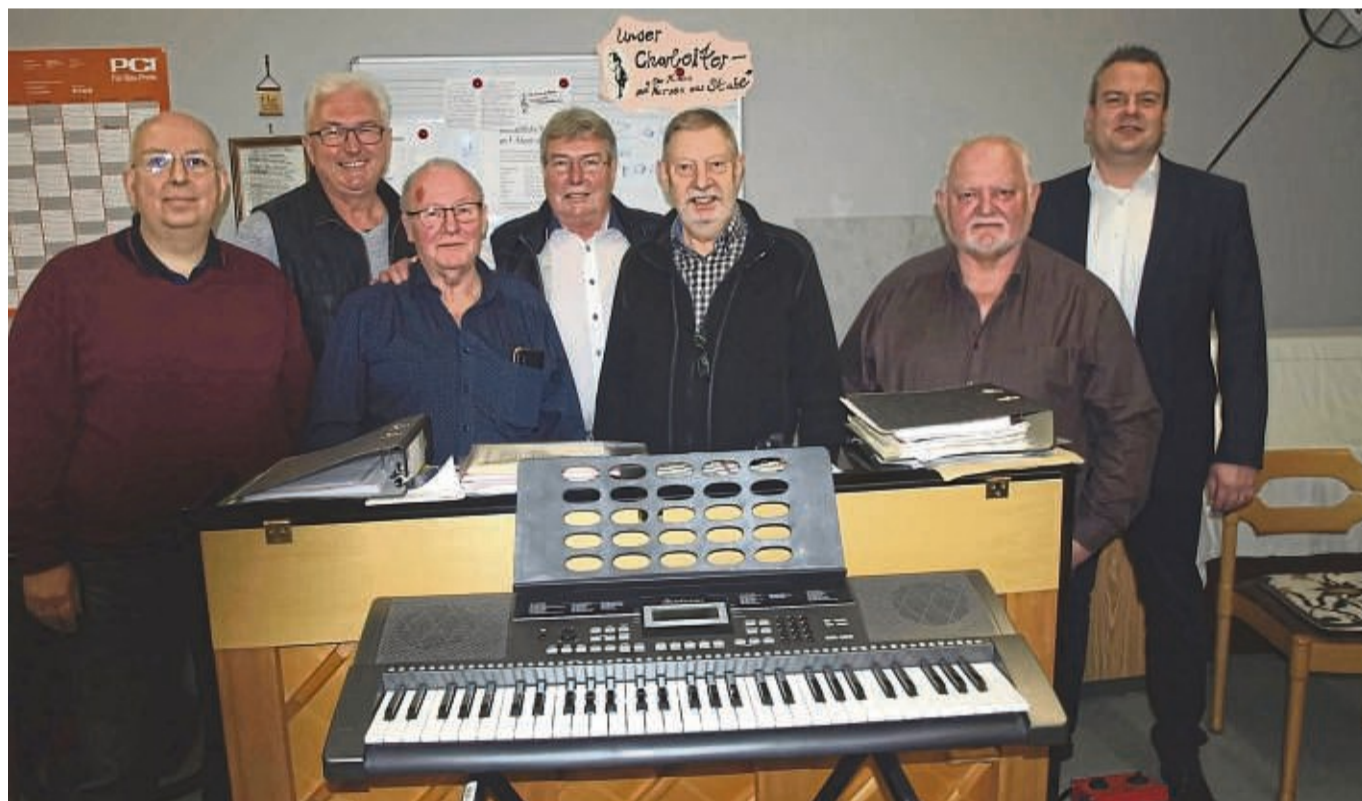
Der neue „Männer-Chor“ sucht noch Gleichgesinnte. Die nächste Singstunde findet am 14. Januar statt.