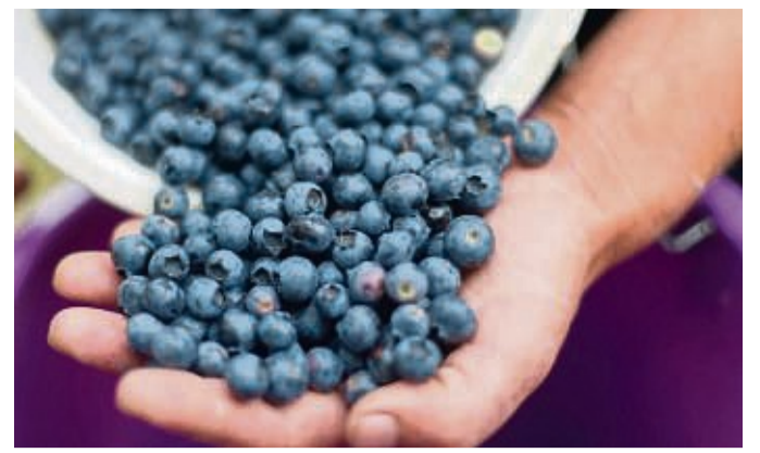
Die Hand als Maßeinheit: Um eine Portion Obst zu definieren, braucht es gar keine Küchenwaage.