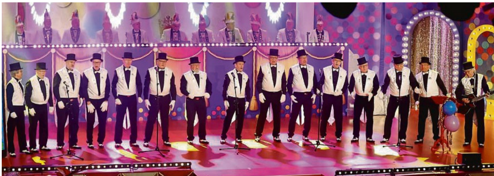
Begeistern ihr Publikum: Die Ladyknacker feiern in diesem Jahr ihre „Volljährigkeit“.

Einige Lieder und damit einen musikalischen Vorgesmack auf das Volljährigkeitskonzert können Interessierte am Sonntag, 15. Januar,