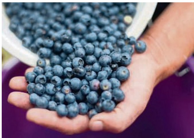
Die Hand als Maßeinheit: Um eine Portion Obst zu definieren, braucht es gar keine Küchenwaage.