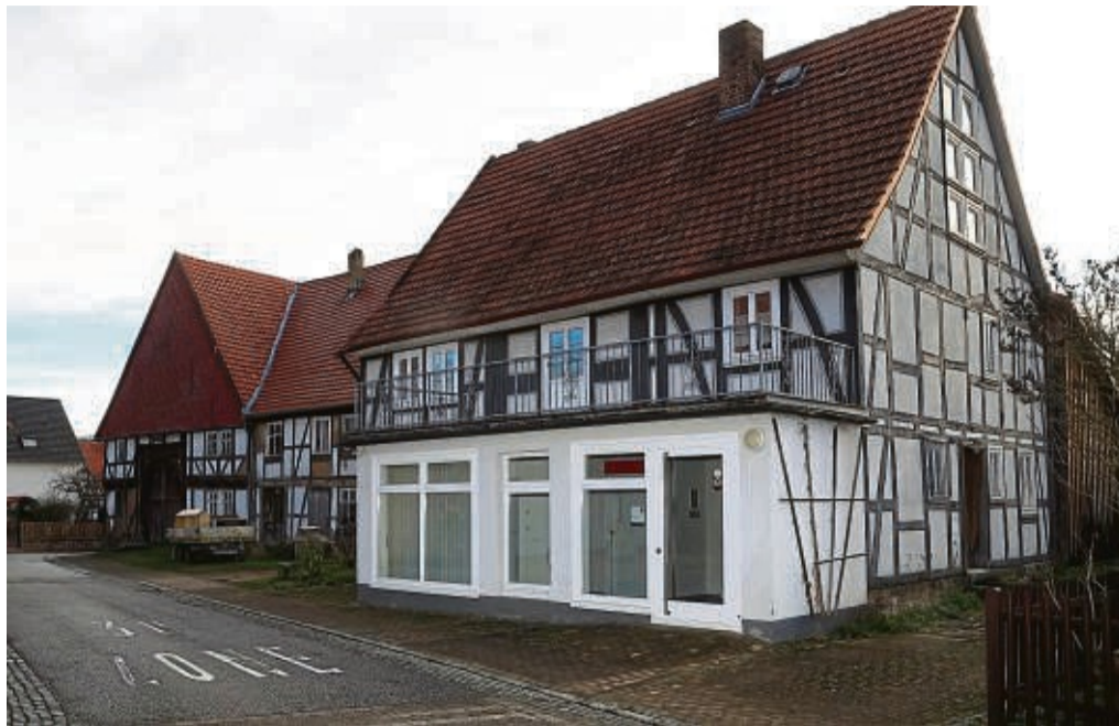
Erste Idee: In der ehemaligen Sparkasse in Hümme könnten Ausstellungsräume zur Ortsgeschichte entstehen. Doch das Geld ist knapp.

Der aus etwa 40 Mitgliedern bestehende Verein bereitet die vielen kulturhistorischen Bilder, Geräte und Dokumente zu Themen wie Landwirtschaft, Natur und Naherholung bis hin zu Flucht, Ver-