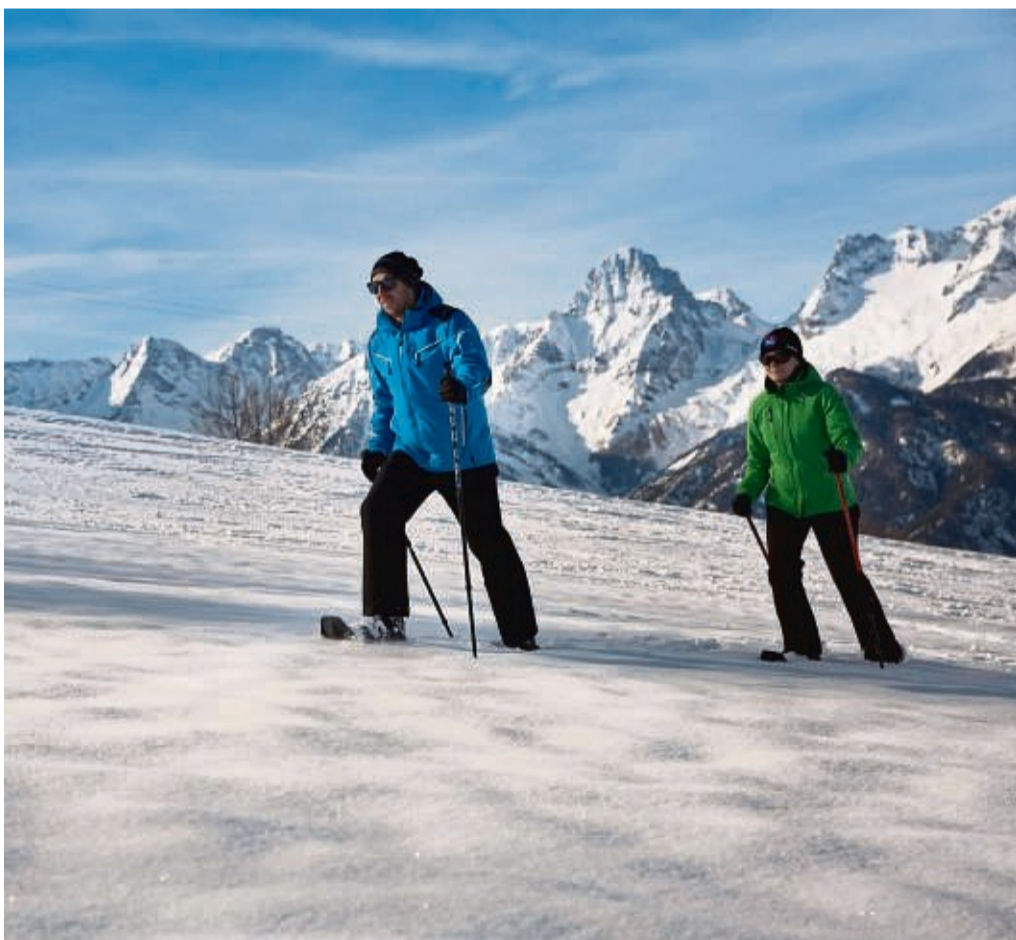
Von vielen österreichischen Urlaubsbauernhöfen aus kann man direkt zu einer Schneeschuhtour starten.