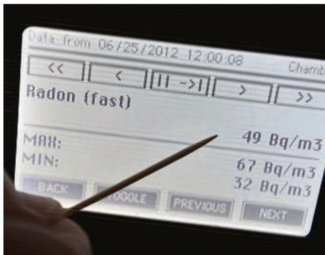
Die Radon-Konzentration im Boden ist regional unterschiedlich.