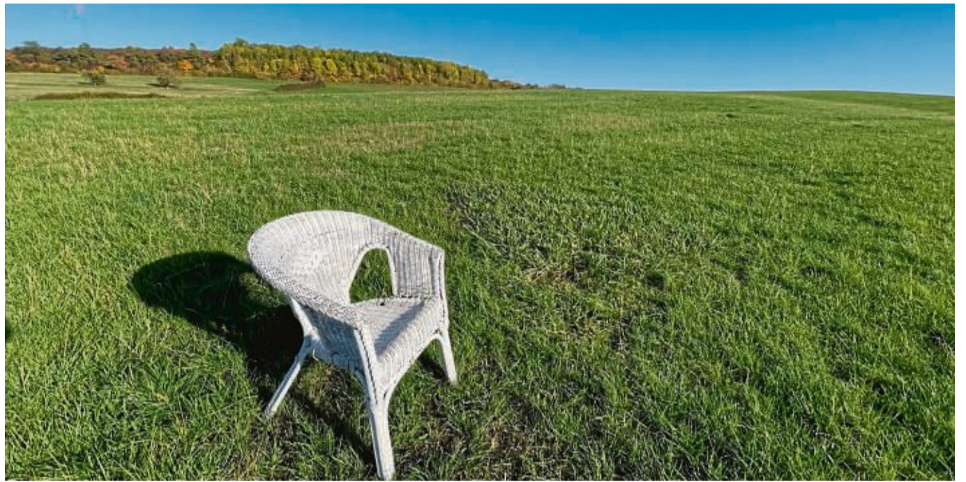
Im Oktober stand der weiße Korbstuhl auf einer Wiese oberhalb des Baugebietes Herderstraße.

Wer Hinweise auf den Eigentümer des Stuhls oder die Hintergründe der Aktion geben kann, soll sich bei der Redaktion in Wolfhagen melden.