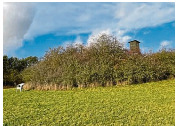
Im Dezember thront er auf dem sogenannten Katzenbuckel am Graner Berg.