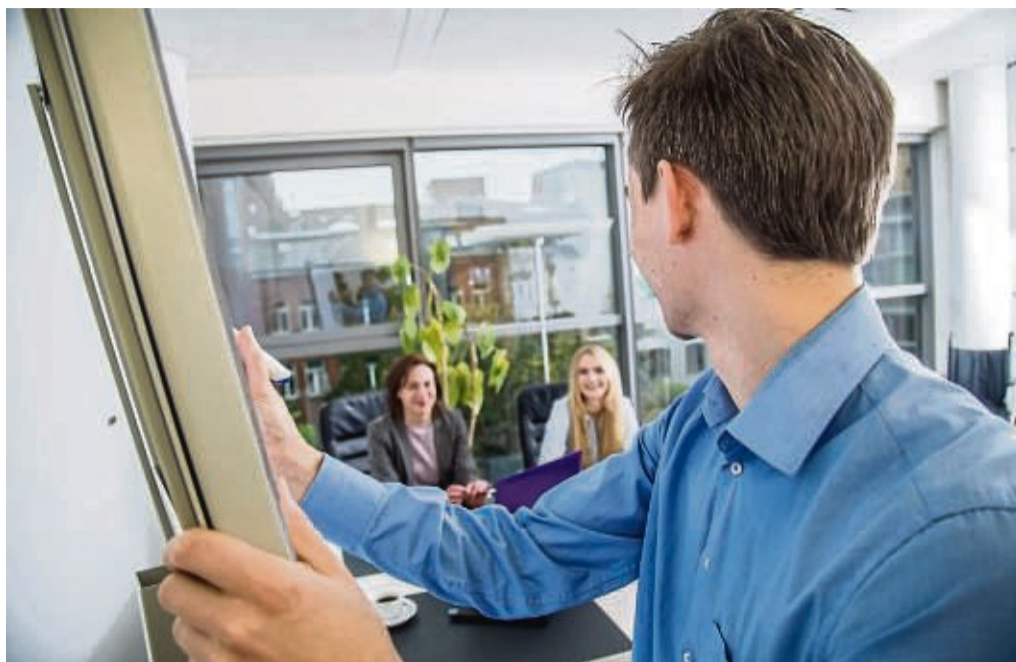
Wer einen Abschluss nachholt, kann anschließend mit besseren Berufschancen rechnen.

Die erste Kontaktaufnahme erfolgt in aller Regel eher formlos. „Man geht zu einem potenziellen Arbeitgeber und spricht vor“, erklärt Craney. Ansprechpartner sind in der Gastronomie etwa die Restaurantbesitzerin oder im Baube-