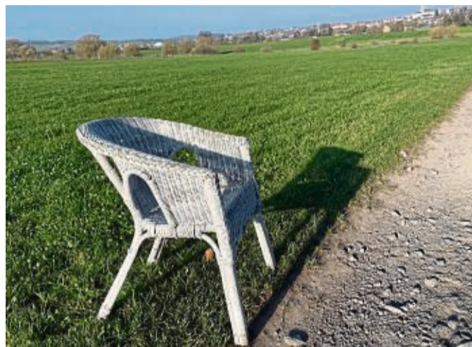
Im November überraschte der Sessel Spaziergänger entlang der Apfelbaumallee.