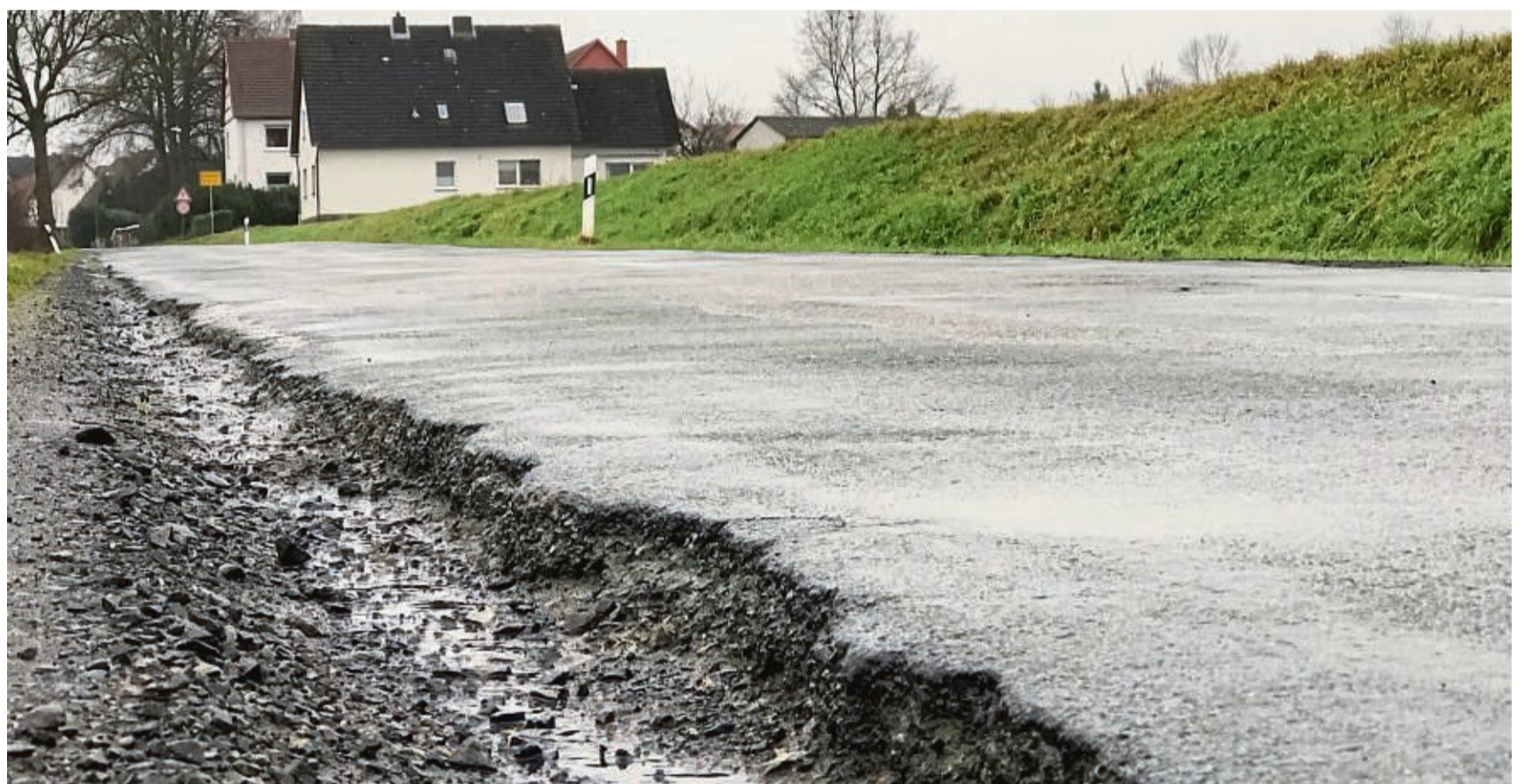
Bröselige Bankette: Die Kreisstraße K100 zwischen Wenigenhasungen und Altenhasungen wird im Sommer saniert. Danach wird sie zur Gemeindestraße.