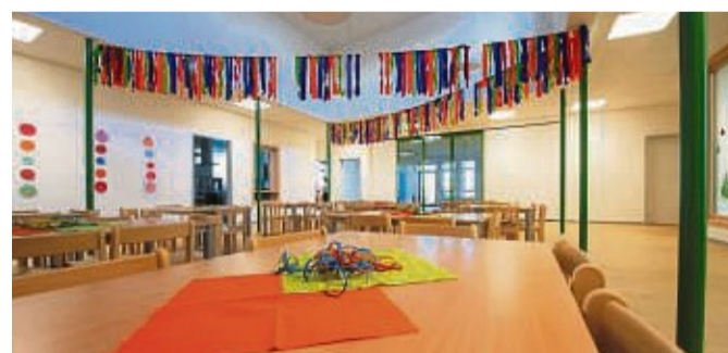
Großzügiger Speisebereich: Im Kita-Café in der Mitte des Gebäudes essen die Kinder künftig zu Mittag.

Kisten abgeholt. Mit dem Einrichten seien sie noch am Montag beschäftigt gewesen. „Jetzt muss man sich erstmal neu orientieren. Es ist jetzt viel mehr Platz da, besonders in den Gruppenräumen“, sagt die Erzieherin. Ihre Kollegin Julia Schäfer: „Das ist ein großer Unterschied. Es ist von vornherein für vier