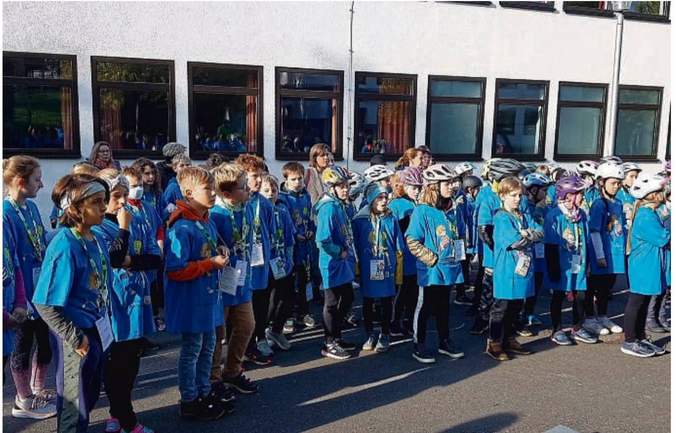
Aktiv und clever: Die Klasse fünf der Adam-von-Trott-Schule Sontra nahm an den „Hessischen Gesundheitsspielen“ in Fulda teil.