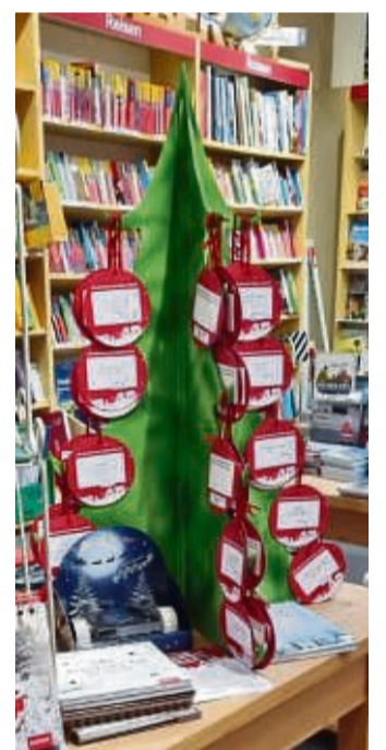
Wunschbaum: Die Freude der Kinder, die über die Aktion Wunschbaum beschenkt wurden, war groß.

Der Weihnachtszauber sei anhand der Reaktionen der Kinder und deren Eltern zu spüren gewesen, von allen Beschenkten wurde ein sehr herzliches und ebenso emotionales Dankeschön ausgesprochen.