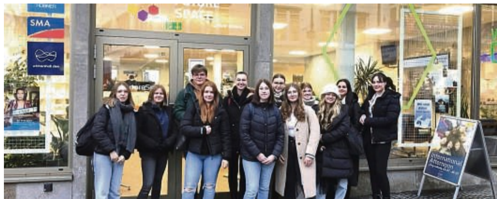
Die Schüler des Bio-Leistungskurses des Beruflichen Gymnasiums Eschwege vor dem Future Space Kassel.