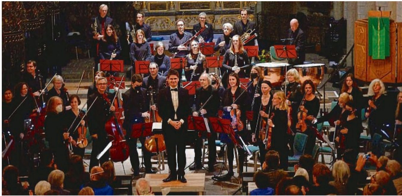
Kommt nach Frankenberg: Die Marburger Philharmonie.

Infos zum Vorverkauf folgen in Kürze. nh/mab