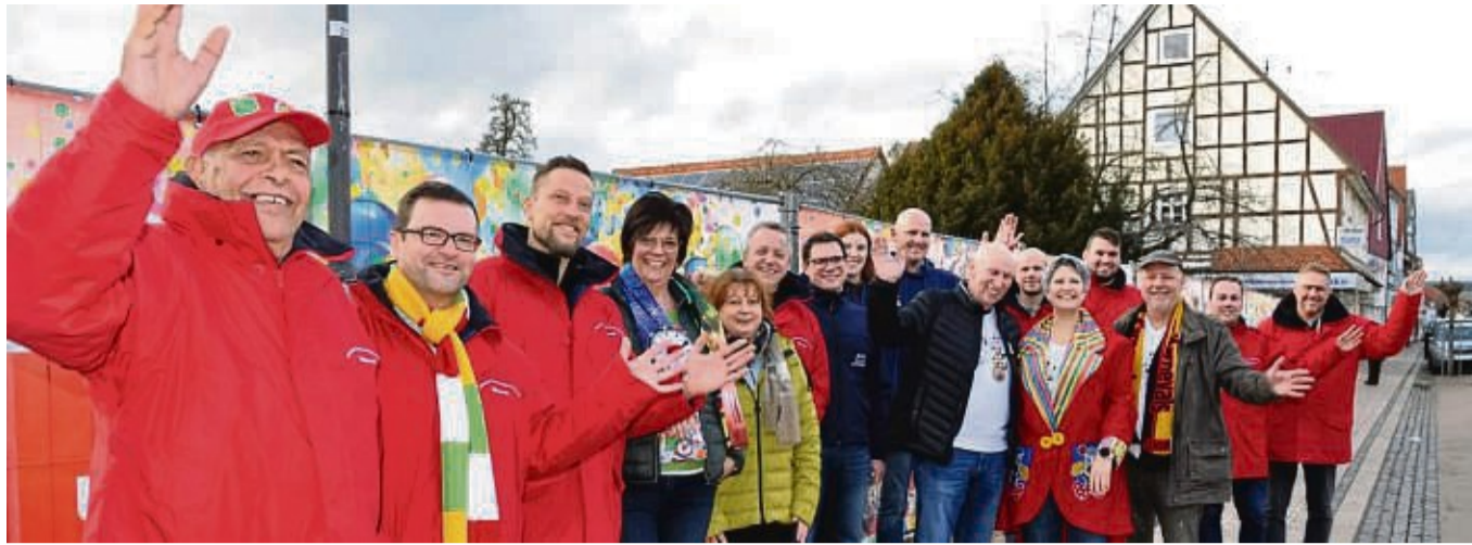
Die Volkmarser Karnevalisten starten in die neue Session. Sie stellten sich vor einer bunten Fotowand am Steinweg auf, mit dem ein verwahtes Grundstück kaschiert wird.