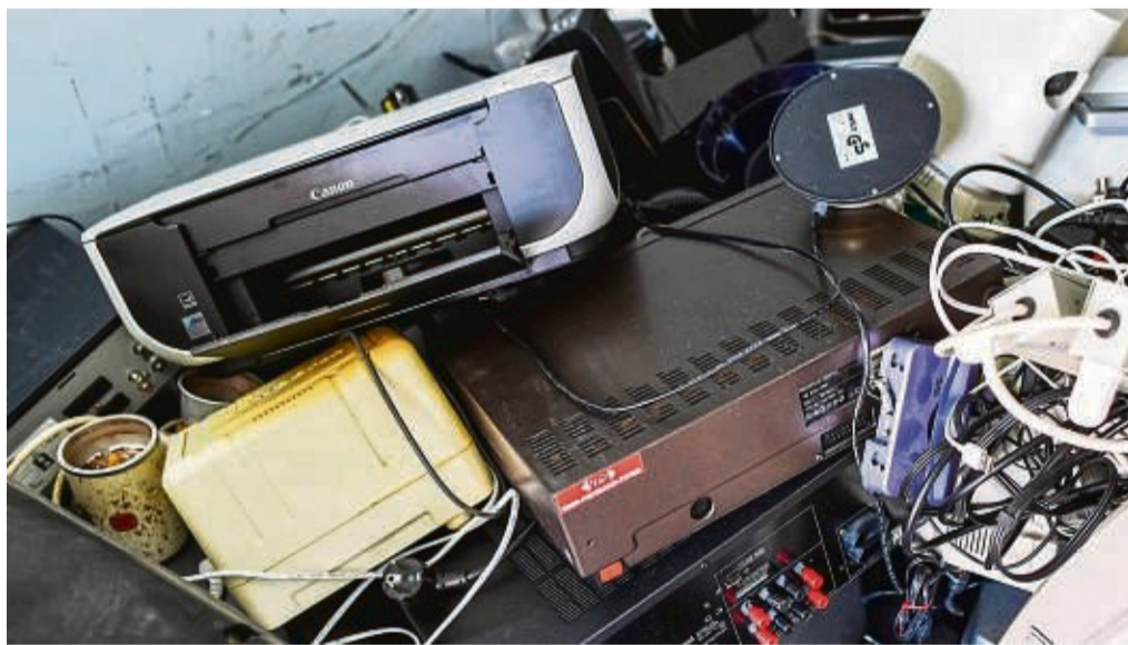
Die Rücknahmepflicht des Handels für alte Elektrogeräte ist im vergangenen Jahr ausgeweitet worden.

Tatsächlich seien die Ergebnisse beim Recycling von Elektroschrott für Deutschland aber beschämend, so der Fachverband. Die Sammel- und Recyclingquote der EU für Elektroschrott wurde seit 2018 verfehlt, so das Umweltbundesamt: Viel zu wenig Altgeräte gelangen in die Wiederverwertung. Statt der geforderten 65 Prozent waren es zuletzt nur 44 Prozent. Die Deutschen wissen also, was beim Recycling sozial erwünscht ist, verhalten sich aber in der Realität falsch. Zahlen des Naturschutzbundes Deutschlands (NABU) zeigen, wo der E-Schrott stattdessen entsorgt wird: Über 140.000 Tonnen kleinerer Elektrogeräte landen jährlich fälschlicherweise im Rest-