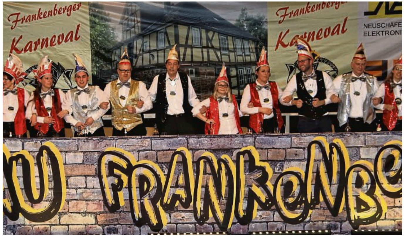
Eine Prunksitzung mit Elferrat, Garden, Gesang und Büttreden veranstalten die Burgwaldnarren in diesem Jahr in der Frankenger Kulturhalle. Das Foto zeigt den Elferrat 2019 in der Ederberglandhalle.

büro Lauterbach und beim Edeka-Markt Schwebel. Für Essen und Getränke ist gesorgt. Die Burgwaldnarren danken dem Landkreis, der Eder-talschule und der Stadt Frankenberg, „ohne deren positives Zutun eine Sitzung in Frankenberg aufgrund der Verzögerungen beim Bau der Ederberglandhalle nicht möglich gewesen wäre“, heißt es in der Mitteilung. Hier alle Karnevals-Veranstaltungen der Burgwaldnarren auf einen Blick: Die Show- und Mottositzung findet am Samstag, 11. Februar, ab 20.11 Uhr im DGH Burgwald statt. Kartenvorverkauf am 28. Januar ab 15 Uhr im Sporttreff im DGH Burgwald. Die Prunksitzung in der Frankenger Kulturhalle folgt am Samstag, 18. Februar, ab 20.11 Uhr, der Kinderkarneval am Sonntag, 19. Februar, ab 14.11 Uhr im DGH Burgwald. nh/mab