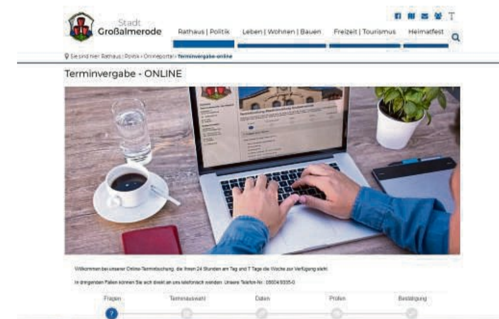
Im Rathaus von Großalmerode ist die Terminvergabe direkt mit dem Kalender des zuständigen Mitarbeiters gekoppelt.

Es sei auch weiterhin möglich, während der Sprechzeiten ohne Termin ins Rathaus zu kommen. Allerdings könne es dann zu Wartezeiten kommen, da Besucher mit