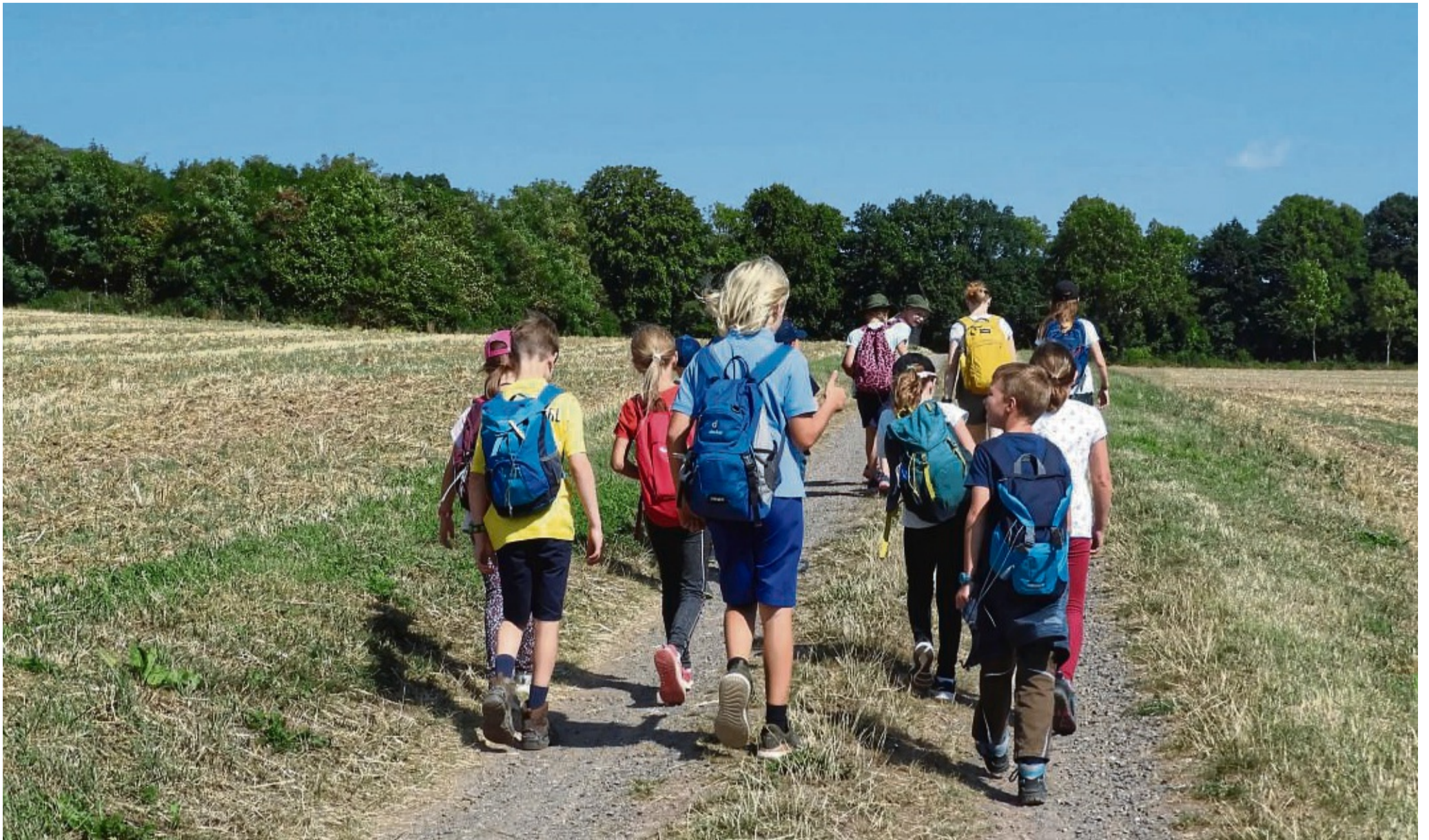
Kreisjugendförderung stellt Jahresprogramm für 2023 vor: Ein abwechslungsreiches Programm gibt es für Jugendliche, darunter auch erlebnisreiche Wanderungen.

Wir holen kostenlos Ihr Alt/Schrottfahrzeug ab! Tel: 0172-5605982