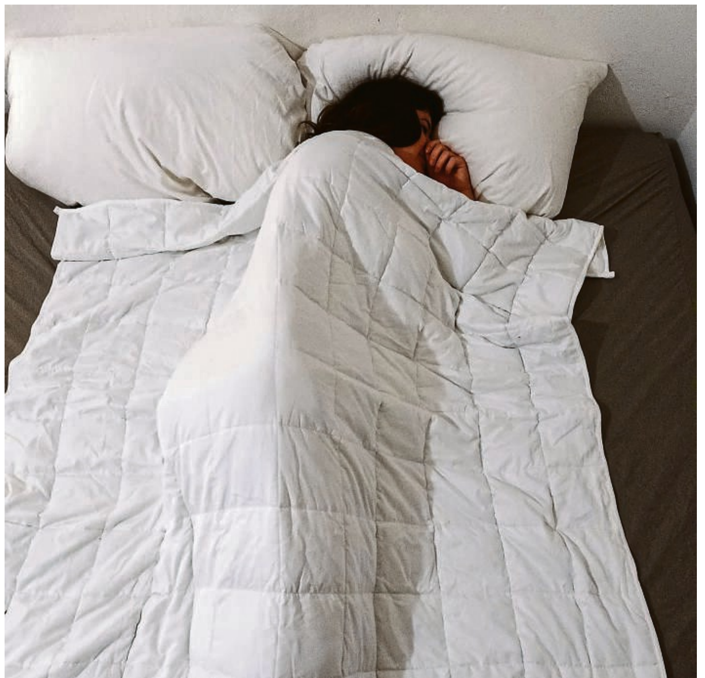
Gewichtsdecken üben Druckreize auf unseren Körper aus. Einige Menschen beruhigt das, andere können damit weniger anfangen.

licht nicht auf den Link tippeln und die Nachricht löschen. Grundsätzlich sei es nach wie vor sinnvoll, Verwandte und Bekannte vor der Masche zu warnen, raten die Expertinnen und Experten. Denn die mehr (schlimmer Unfall) oder weniger (Waschmaschine kaputt) abenteuerlichen Geschichten, die folgen, wenn man sich auf einen Chat einlässt, münden immer in Aufforderungen, Geld zu überweisen. Der Schwindel lässt sich aber meist leicht aufdecken, wenn man versucht, den oder die betreffenden Verwandten auf der bekannten - angeblich ja nicht mehr funktionierenden - Nummer anzurufen, rät die Verbraucherzentrale Hessen. tmn