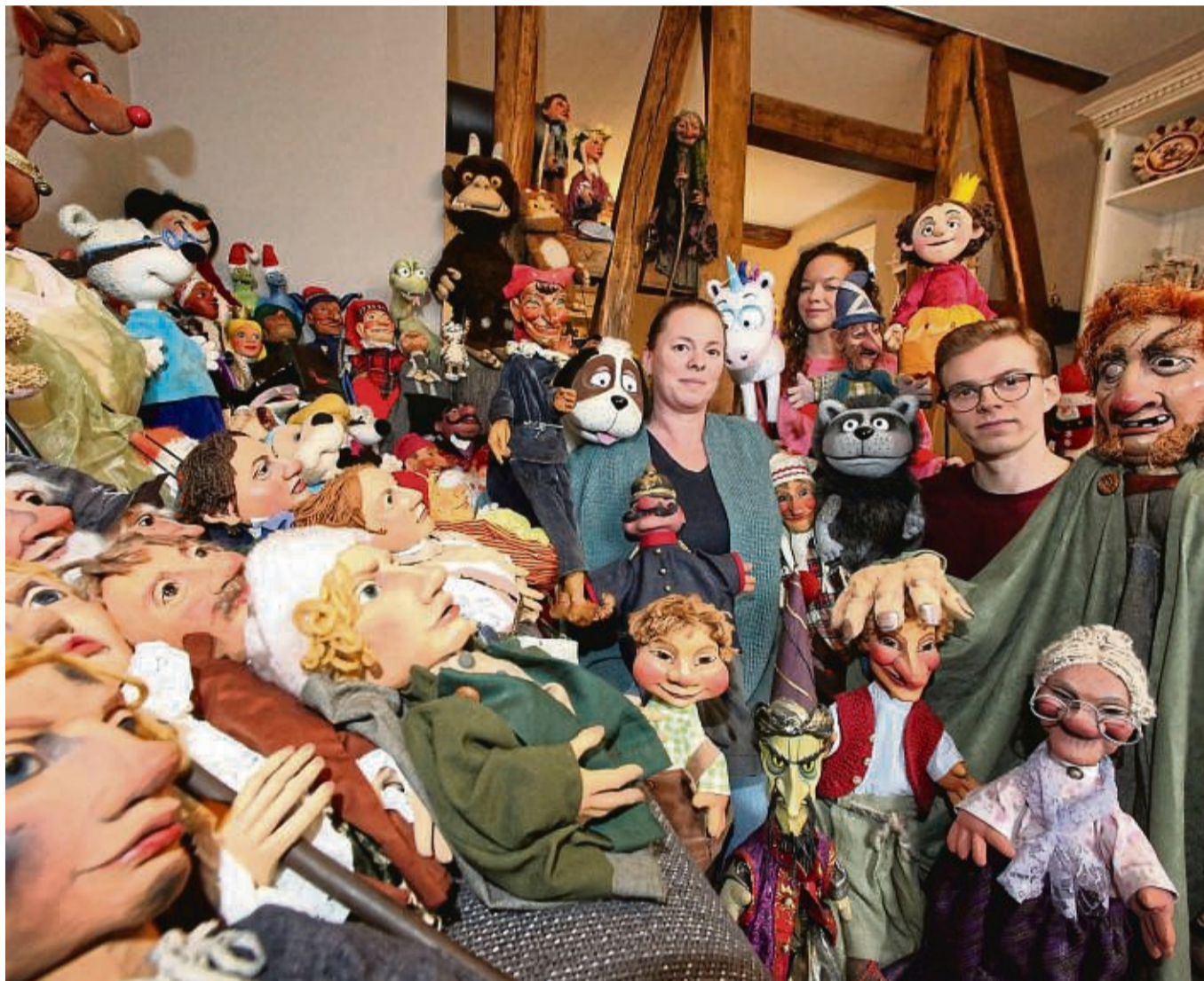
Etwa 150 Puppen besitzt das Wolfhager Figurentheater. Besonders stolz ist die Familie Kaselowsky jedoch auf einen etwa 70 Jahre alten Kasper, der vom Puppenbildner Till de Kock geschnitten worden ist.

In Nicht-Pandemiejahren ist die Familie von März bis zum Beginn der Adventszeit mit dem Puppentheater auf Tour. „Meist zieht es uns in Richtung Norden. Im Sommer spielen wir regelmäßig auf der Ostseeeinsel Poel“, be-