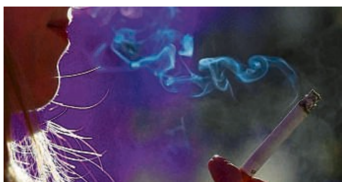
Abschied vom blauen Dunst: Ab Februar gibt es wieder Raucherentwöhnungskurse.