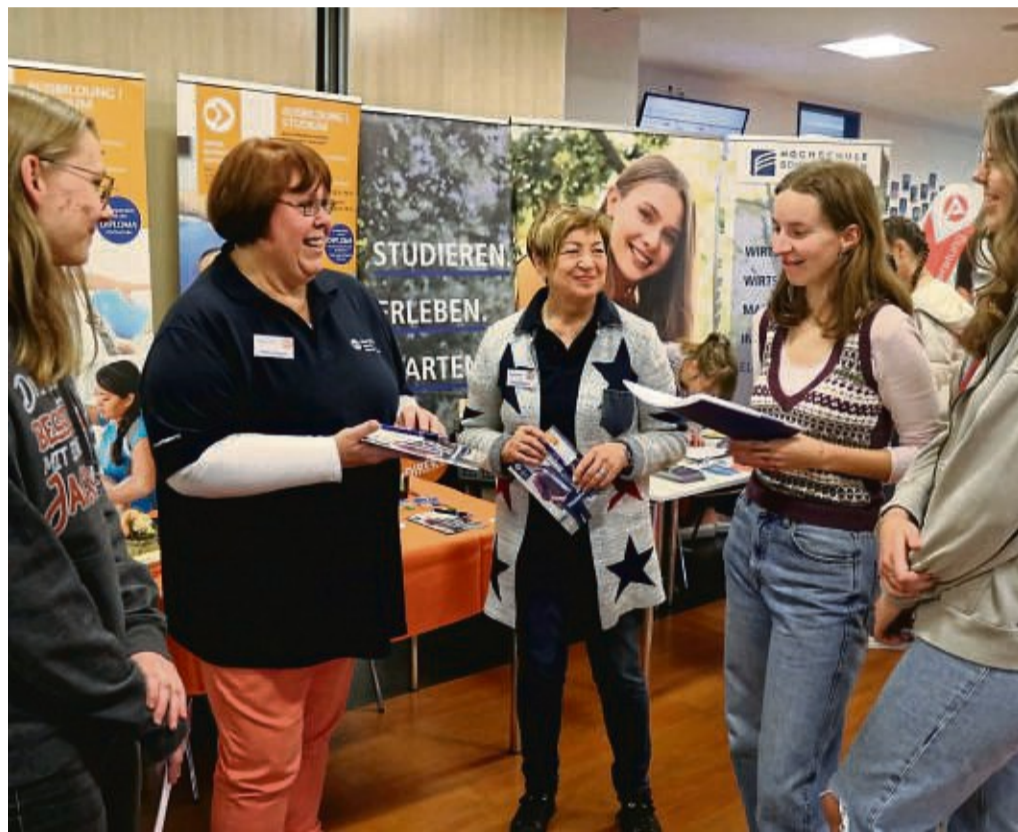
Gelungene Veranstaltung: Bei der „Karriere4You“ standen sich 41 Unternehmen und Aussteller den Oberstufenschülern Rede und Antwort.