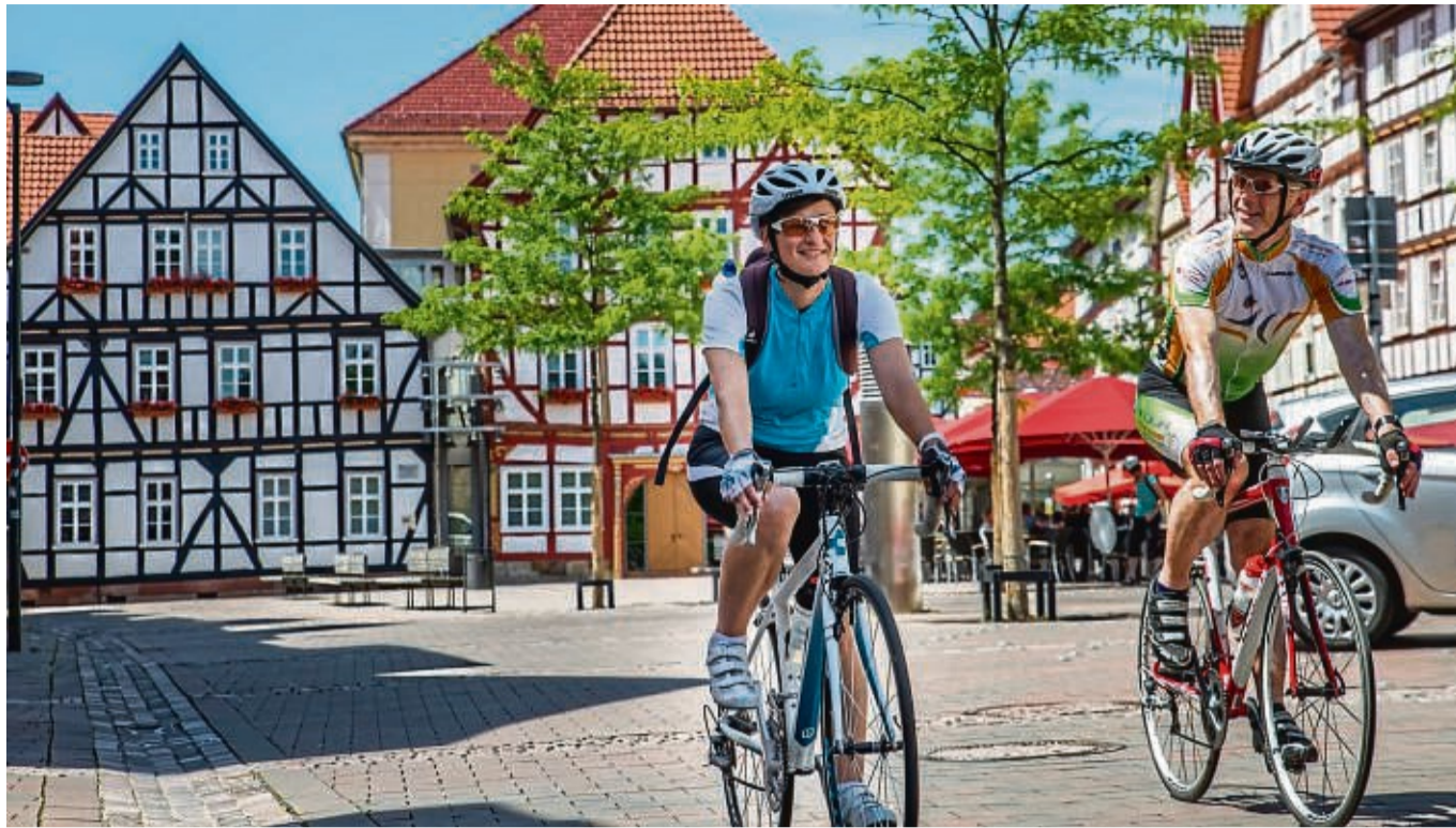
Die Region per Rad erkunden: Rad(t)schlag enthält viele Tipps für schöne Touren und nette Raststätten.