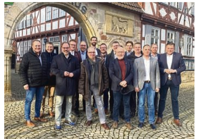
Kreisversammlung: 15 Bürgermeister des Werra-Meißner-Kreises waren zu Gast in Wanfried.

Der nächste Kurs „Rauchfrei in sechs Wochen“ beginnt am Donnerstag, 16. Februar, um 19 Uhr danach wöchentlich jeden weiteren Donnerstag bis zum 23. März. Die Kosten belaufen sich auf 180 Euro. Der Kurs ist zertifiziert und alle Krankenkassen erstatten zwischen 50 und 100 Prozent (BKK Werra-Meißner bspw.) Ein Online-Info-Abend findet am Donnerstag, 2. Februar, um 18.30 Uhr statt. Die Zugangsdaten gibt es bei der Anmeldung. Anmeldung: Gesunder Werra-Meißner-Kreis - Frau Sieland - 0 56 51/9 52 19 22.