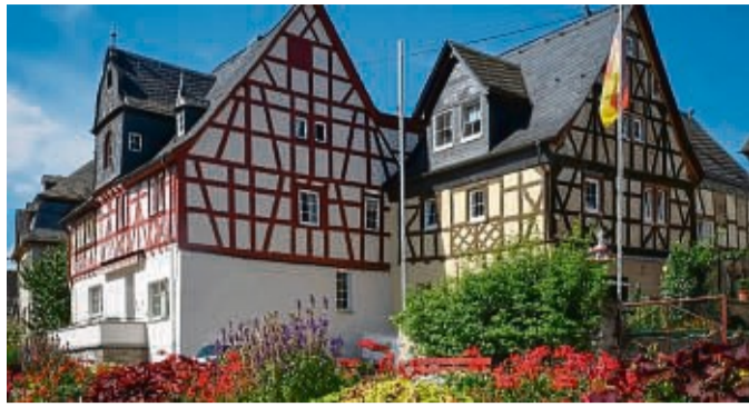
Die imposanten Fachwerkbauten in Spay sind charakteristisch für die Orte am Rheinbogen.

Wie Smartphones bald mit Satelliten funken