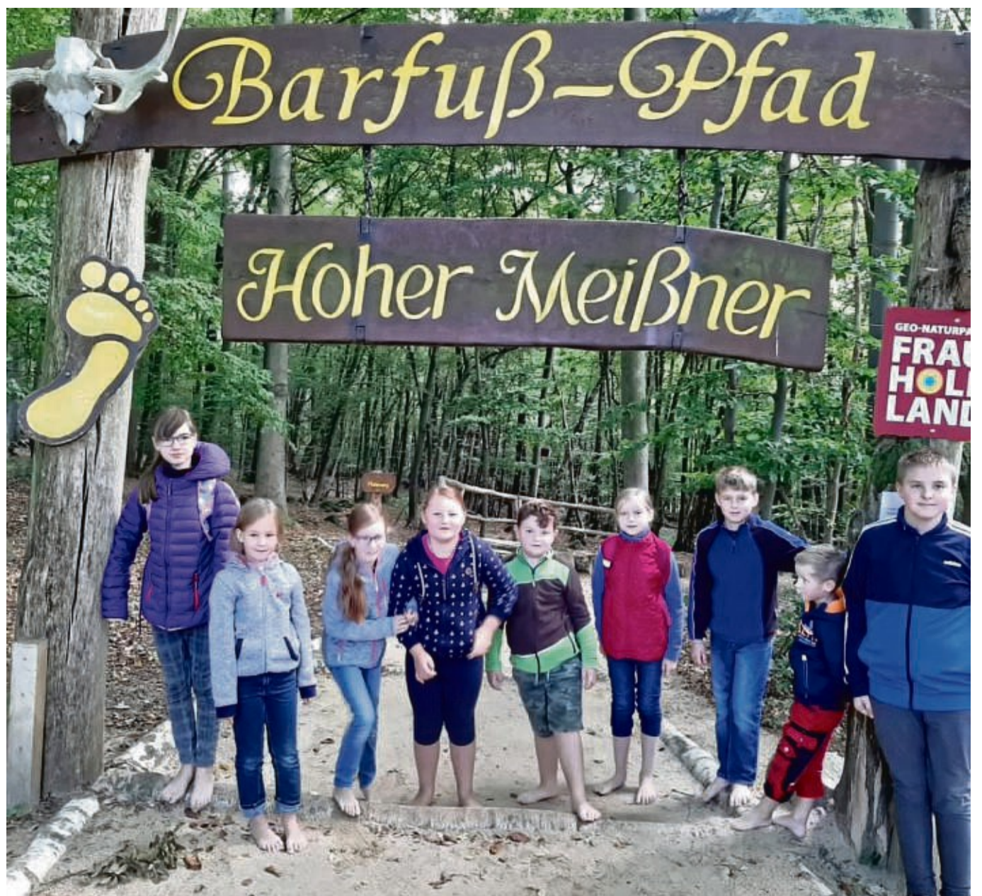
Freuen sich über die Anerkennung: Die Mädchen und Jungen der Kinderfeuerwehr Weißenborn, hier bei einem Ausflug zum Barfußpfad.