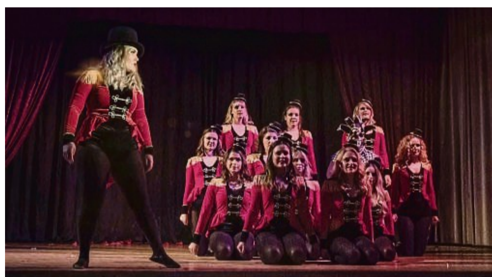
Endlich ist es wieder soweit: Die Reichensächser Karnevalisten kommen in diesem Jahr wieder voll auf Ihre Kosten.

Neben der einheimischen Grünen Garde, dem Männerballett „Schoppendales“, diversen Sketchen und Reden dürfen sich die Besucher auch auf einige Pro-