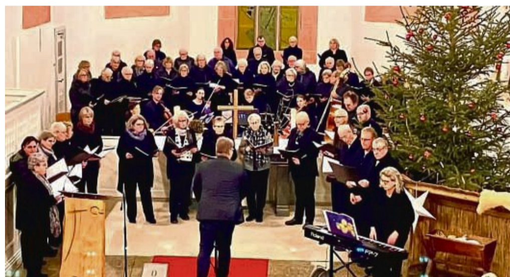
Eindrücke der dritten Vesper: Am kommenden Samstag findet die letzte Vesper statt.

Gardziella Brillenhaus-Blankenbach 06627 8686