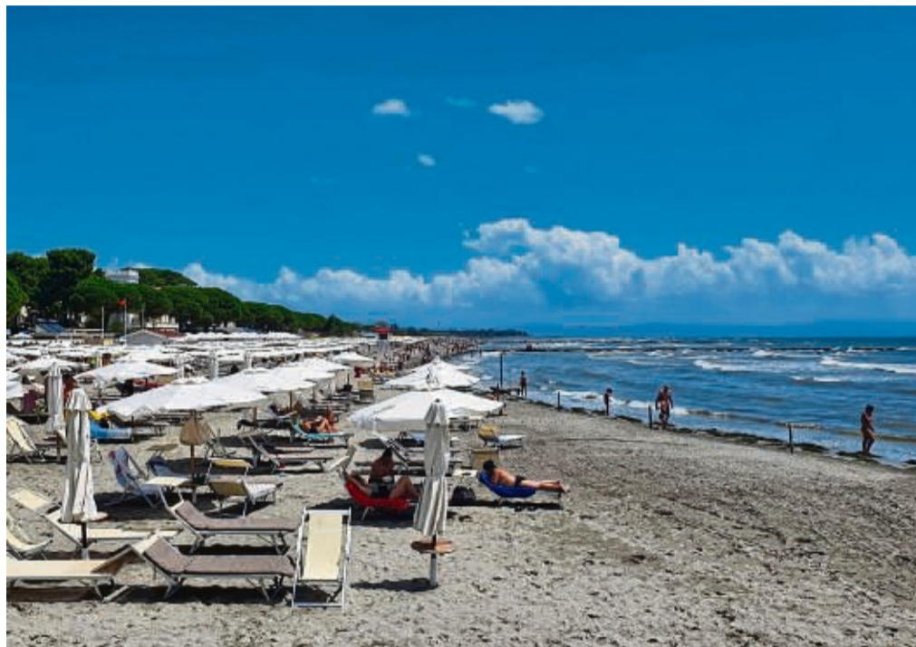
Kinderfreundliche Strände, gute Wasserqualität: Wer will, kann in Grado auch nur Badeurlaub machen.

Vom trubeligem „Riviera“-Charme merkt man heutzutage auf Anfora nichts. Abends, wenn die letzten Tagsgäste abgelegt haben, hat