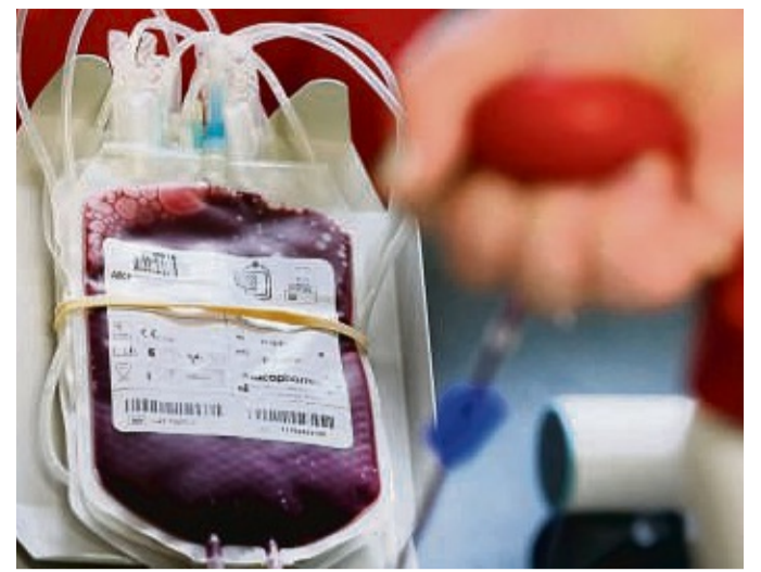
In den Krankenhäusern fehlen Blutkonserven: Weil viele Menschen erkältet sind, gibt es weniger Blutspenden, warnt das Rote Kreuz.