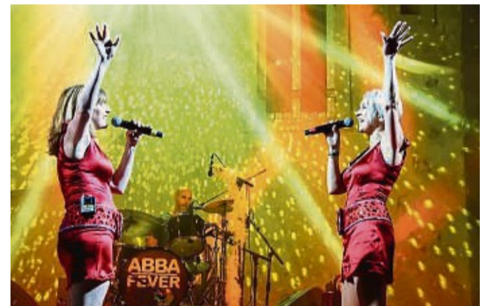
Die ABBA-Coverband „A33A-Fever“ tritt am 4. November in der Schützenhalle in Usseln auf.