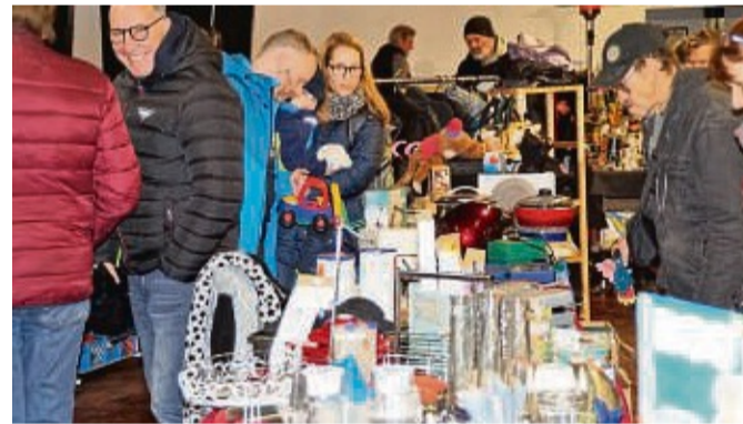
Die Resonanz ist gut: Zahlreiche Besucher durchstöberten das Angebot an den 25 Flohmarktstischen.