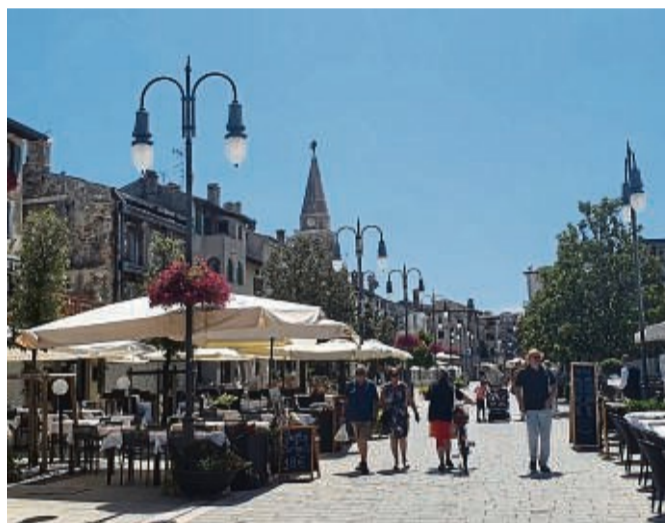
Grado ist das lebhafteste Zentrum der Lagune.

man die „mota“ für sich allein. Ganz anders geht es in Grado zu, dem lebhaften Zentrum der Lagune, in das wir nach einer Nacht auf Anfora zurückkehren. Auch Grado ist eine Insel, aber durch eine Dammstraße und eine Brücke mit dem Festland verbunden. Zwei frühchristliche Basiliken erheben sich in der Altstadt, Fußbodenmosaiken erinnern an die Römer, mittelalterliche Gassen und eine Strandpromenade laden zum Schlendern ein.