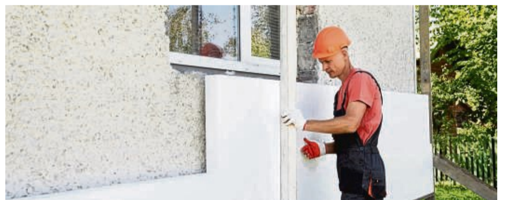
Eine Wärmedämmung der Fassade ist der erste Schritt zu mehr Energieeffizienz in älteren Gebäuden. Eine aktuelle Studie zeigt: Die Maßnahme rechnet sich jetzt noch schneller.

ne fachgerechte Dämmung tragen alle folgenden Maßnahmen nicht effektiv zum Energiesparen bei. Aufgrund der stark gestiegenen Energiekosten und zusätzlicher Effekte wie der CO 2 -Steuer amortisiert sich eine energetische Sanierung älterer selbst genutzter Ein- und Zweifamilienhäuser noch schneller. Zu diesem Ergebnis kommt eine Studie im Auftrag des Verbraucherzentrale Bundesverbands (VZBV) und der Deutschen Unternehmensinitiative Energieeffizienz (DENEFF). Eigenheime der Baujahre 1919 bis 1978 wurden dazu hinsichtlich ihres Energiebedarfs und der erzielbaren Einsparungen nach einer Dämmung analysiert. Auch für Vermieter ist eine Sanierung interessant, da Mieter beginnend ab 2023 die Kohlendioxid-Kosten anschließend zum großen Teil selbst zu tragen haben. Zudem steigert die Maßnahme den Wert des Gebäudes. djd