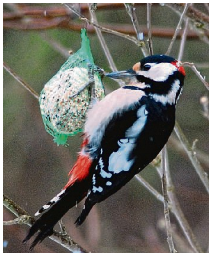
Seltener an der Futterstelle im Garten zu sehen: der Buntspecht.

Der Rückgang der Feldsperling-Sichtungen steht im Zusammenhang mit dem Rückgang der Brutbestände. Petri stellte dazu fest: „Der Feldsperling lebt auf artenreichen Wiesen und an Waldrändern. Diesen Lebensraum macht der Mensch mit der