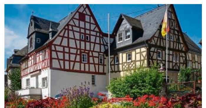
Die imposanten Fachwerkbauten in Spay sind charakteristisch für die Orte am Rheinbogen.