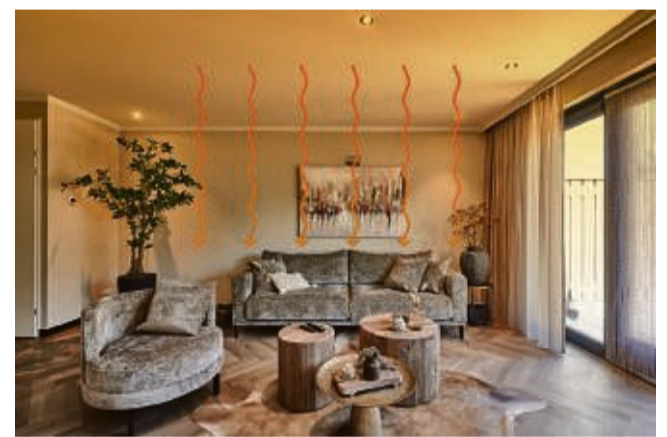
unabhängig heizen mit Infrarot Heizung unter der Decke

Der schnelle Umbau oder eine Erneuerung der Heizungsanlage scheitert oft an der Verfügbarkeit neuer, energiesparender Anlagen und an langfristig ausgebuchten Handwerkern. Das Lagerfeuer im Wohnzimmer ist bekanntlich keine Option, scheidet also auch aus. Was lässt sich alternativ und unabhängig zu Gas- oder Ölheizungen einbauen? Wie wäre es mit einer Infrarotheizung? Infrarot sorgt für behagliche Wärme. Wie bei Sonnenstrahlen spürt die Haut diese Wärme sofort. Herrlich! Auch für Hausstauballergiker. Infrarotheizungen können elegant unter Spanndecken „versteckt“ werden. Plameco bietet Dir eine neue, glatte Decke mit integrierter LED-Beleuchtung und Infrarotheizung. Morgen schöner wohnen – ohne