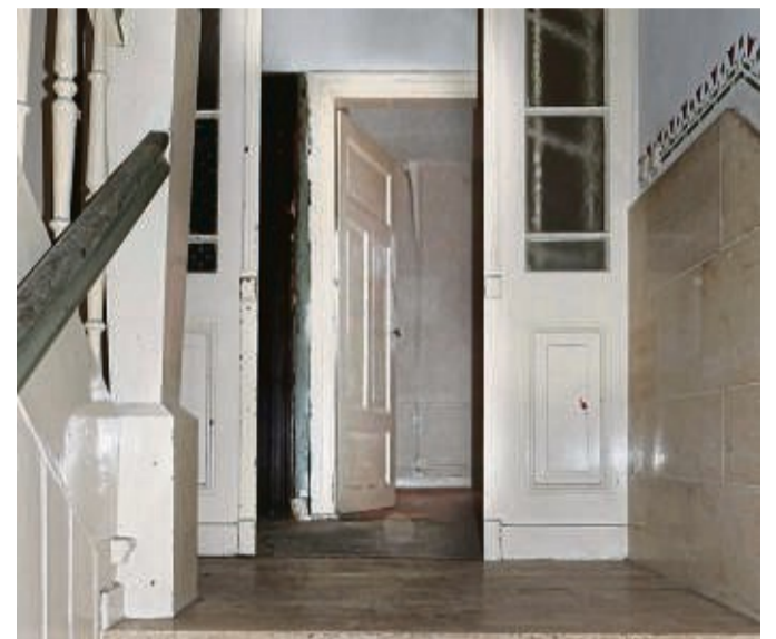
Abgenutzt: Das Innere wird voll saniert.