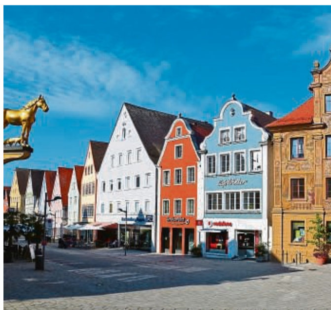
Ellwangen an der Jagst ist eine charmante Stadt mit vielen Bau- und Kunstschätzen.

Die Unesco hat die Insel im Atlantik 2012 zum „Starlight Reserve“, also zum Sternlicht-Reservat, ernannt. Weil die Bedingungen für die Beobachtung des Nachthimmels hier ideal sind. Auf La Palma gibt es ein Gesetz gegen die sogenannte Lichtverschmutzung.