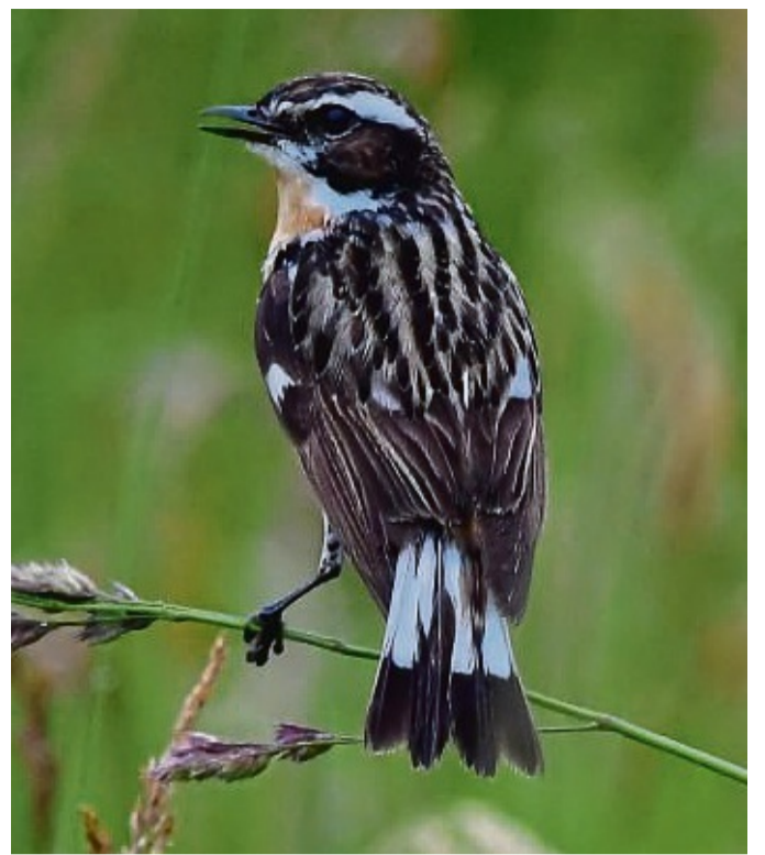
Der Vogel des Jahres 2023 ist das Braunkehlchen.