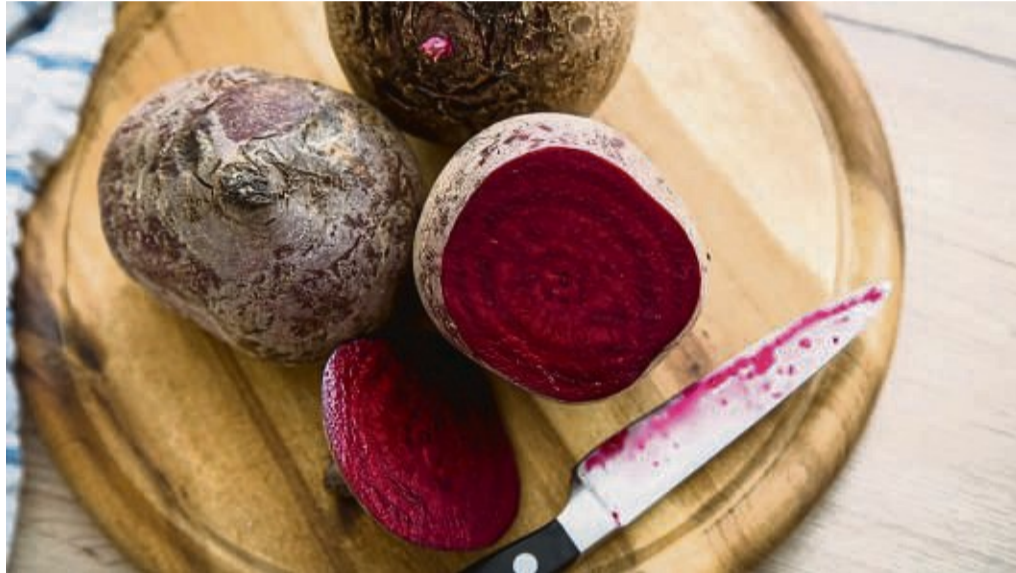
Wer Rote Bete schält oder in Scheiben schneidet, sollte beim Zubereiten besser Handschuhe tragen.