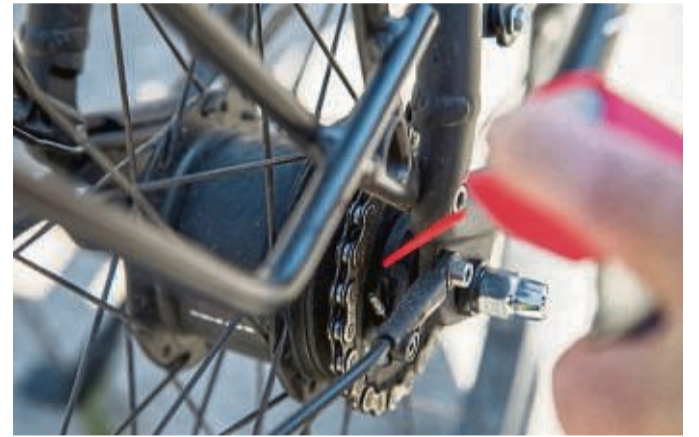
Ein guter Tropfen: Mit speziellem Kettenöl läuft die Kette nach der Reinigung wieder geschmiert.