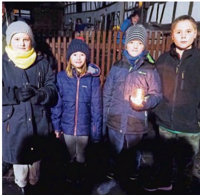
Verlesen 48 Namen der Holocaustopfer aus Herleshausen: die Schüler der Klasse 4 b der Südringgauschule. Sie nahmen mit rund 200 Menschen an der kreisweiten Gedenknacht in Herleshausen teil.