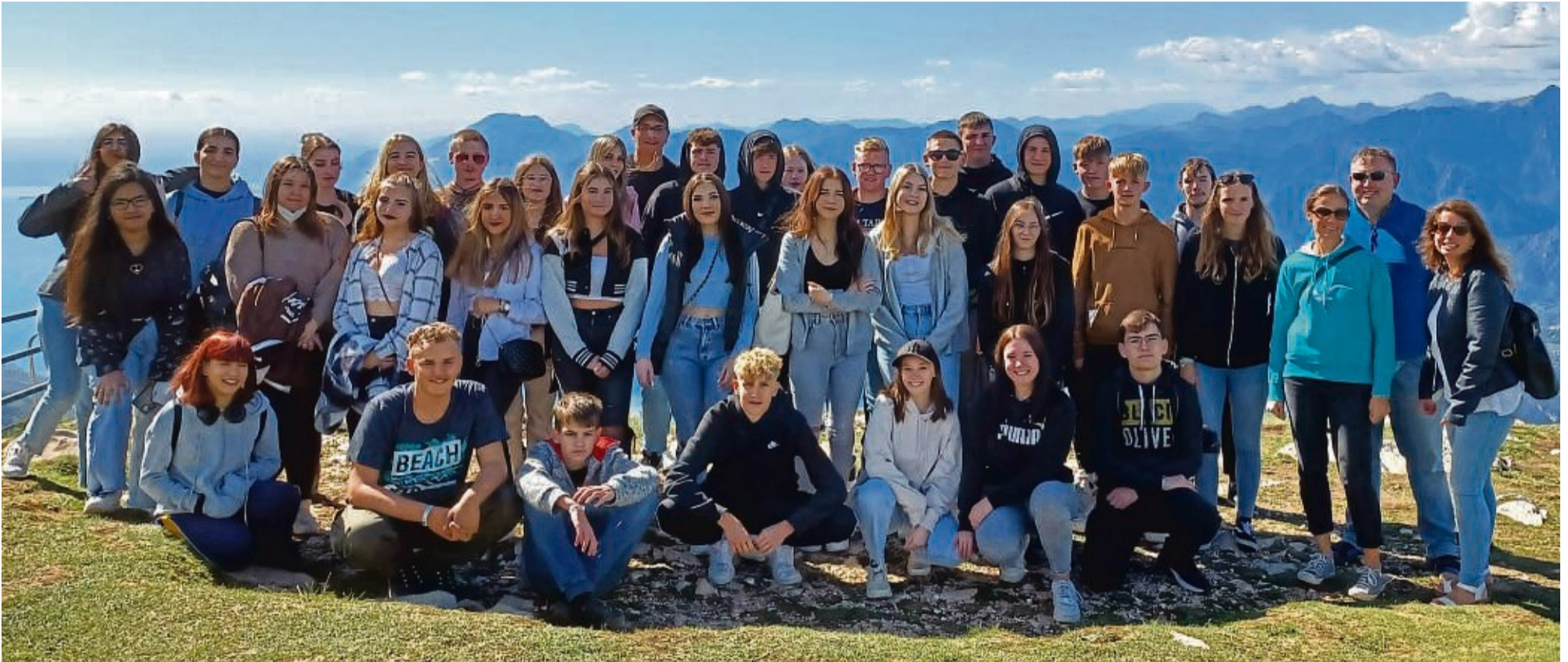
Klassenfahrt in Italien: Die Schüler und Schülerinnen verbrachten eine schöne Zeit am Gardasee und konnten in Verona Shakespeares Werk „Romeo und Julia“ hautnah erfahren.