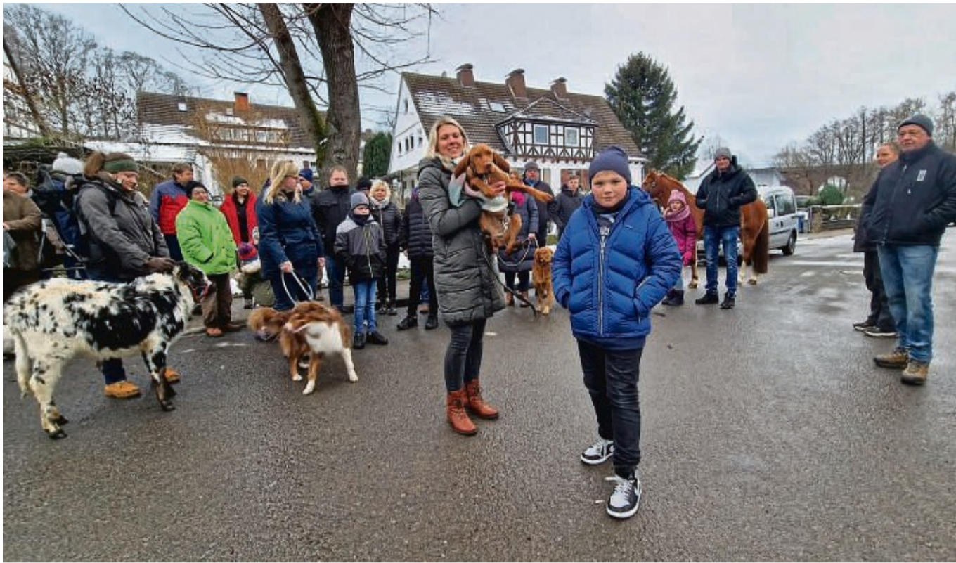
Durch den Sontraer Ortsteil Hornel streifen beinahe täglich Wölfe, die Einwohner haben Angst um sich, ihre Kinder und ihre Tiere.